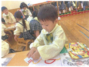
シールあそび★ 1枚ずつ丁寧に貼っていきましょ!