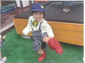
ジャジャ〜ン!!! 今日は赤い長靴です☆