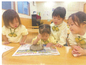
お皿作りの日にお休みなので、 別日に作りまひ！見守り 友だちがいっぱい