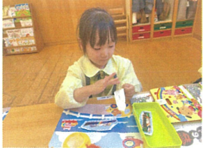
指先を使ってハグハグ 上手に貼れるかな?