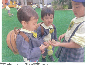
いい天気! 禁煙のうさぎさん 天井高い! とどきとう... 年中のお姉さんに 泥んこを見せてもらいました。