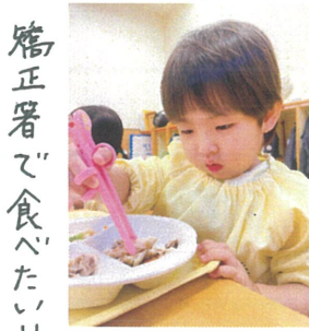
矯正箸で食べたい!!