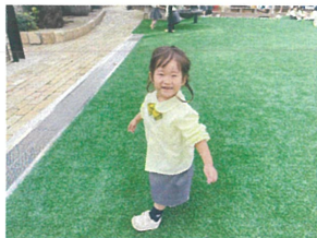
//わたしははー♡ 笛の音を聞いて参加です!