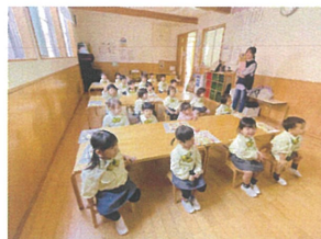
人-左腕はどちらか通ります?!