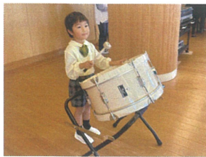
音舞の練習で 大太鼓に挑戦