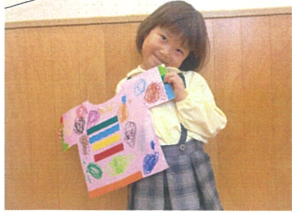
たくさん色を使って カラフルなTシャツが出来たね! 美味しそう~♡