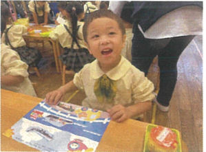
やった〜!!! 1番に完成できたよ!