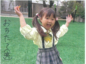
頭に葉っぱを乗せて 移動のはがきが... (笑)