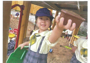
これからお皿に 出しますよ~♪