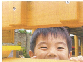
砂場の方から「にこり かわい、お顔を見せてくれたね♡