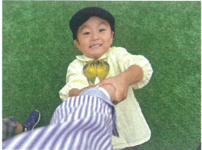
こっちに来て、 一緒に遊ぼうよ!!