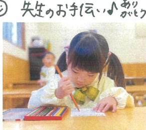
もうすぐ「お誕生日会」なので、 紹介状を書きました♡