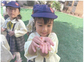
小さくてカワイイ どんぶり見つけたの♡