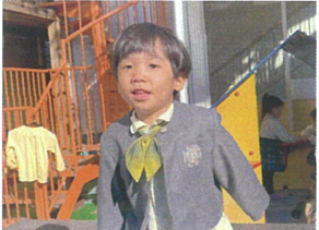
トランポリンがお気に入り! たくさんジャンプしていました!