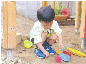
最近のメロクラスのお友達は砂場あそびか、 お外に入りご-人-回は必ず?来ます♡