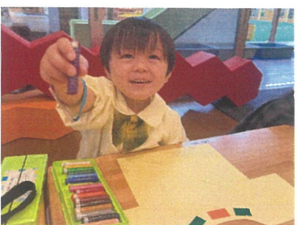
「むらさきにするー!」と 先生に伝えスタートが!