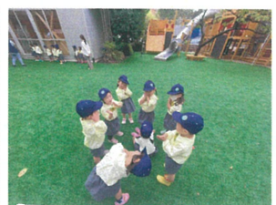
「むっくろくマさん」 おむつをいじるスカス...