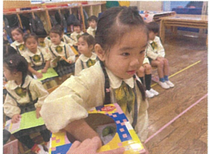
何のステッカーが出るかな? 中を見たくて見たくて 目がキョロキョロしているお友だちの姿が! (笑)