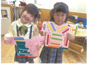
かわいくオシャレな Tシャツが出来たね