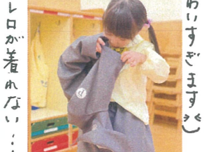
ホレロが着れない!!