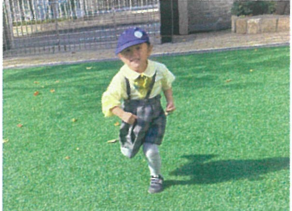
「よーいどん!」 走るのが速くなりました★