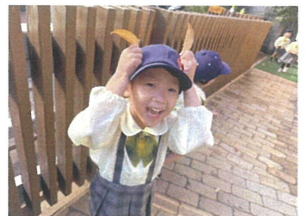
葉っぱの耳をつけて ウサギさん