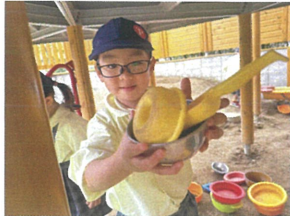
ドーナツが完成☆ 食べてもいけますよ!!