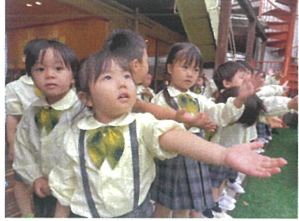
雨が降ってるかな〜? クラスのみんながチェック!