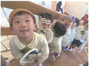
これから音楽遊びに 行ってきます