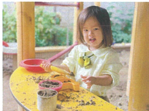
//バカつくり(3才)♡ ここがお気に入りの場所♡