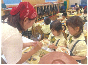
お手伝いにお友だちの お母さんが来てくれます!