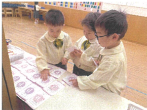
毎朝、サーキットカードを 並べてくれています!!