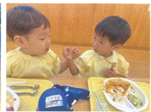
お互いちとばかり お話をして食べます。