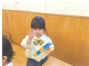
言葉がチカラ 来りてくたす♡