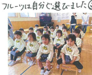
昨年の音舞台のDVDを とっても真剣です!!