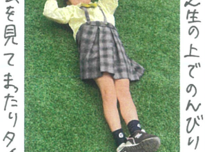
雲を見てまたりタイム ゴロゴ〜ゴロゴ〜