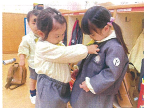
ホレロのボタンを押すと あがる♡真剣です♡