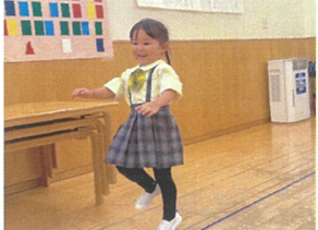
「スキップ上手に出来るよ!」とお誕生日を迎えて4歳! たくさん見せてくれましたよ! と嬉しそうでした♡