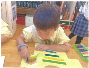
今回の造形あそびはTシャツ作り! ビニールテープとクレヨンを使って作りましょ!