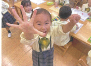
楽しそうでしたよ! 切っていきます!