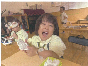
半までおせんべい 作っちゃった♡