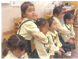
朝の会ごっこ中☆ 《造形あそび》 今日は、日直さん2人です! ☺にシールを見ります。