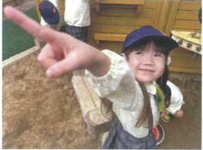
見て飛行機が お空にいたよ