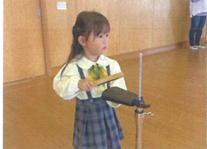
初めてわかるに挑戦! 先生への視線バッチリ★