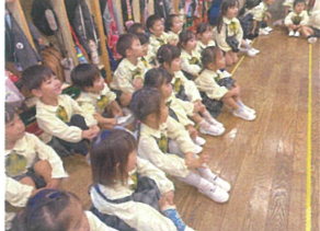
年少クラスみんなで光と影の実験! 真実に話を聞いてましょ!