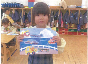
最後まで丁寧に貼れたね! 上手に出来ました!