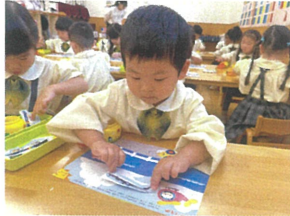
はさみの使い方も 上達してきています!!