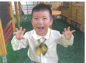
ガオン 🐾 食べちゃって!!