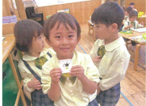
初めてサーキットシールを ゲットできて嬉しそう!