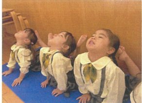
少しづつ読める部分が 増えてましょ!