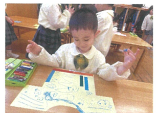
よし!! いい感じ♡と 満足気な表情