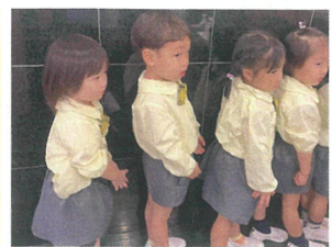
トイレに行く時は、 しっかり並んでいます。