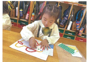
ピッタリとシールが 見えています