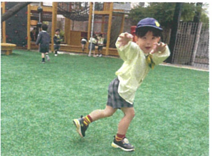
ビュム!! 先生に 向けて発射!