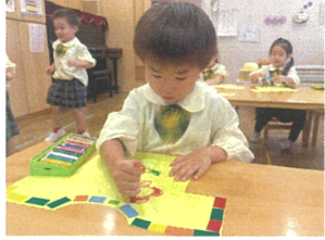
シールを見たら クレヨンでデッサン☆