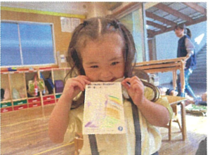
大好きなママに♡ 招待状を書きました!