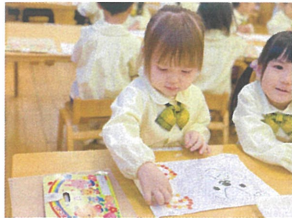
シールあそび、真剣に 取り組んでいます♡