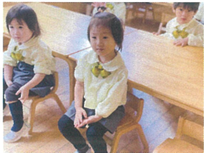
音舞台のDVD、今週は みんな見ました(笑)