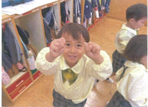
「どっちの手に入ってるでしょうか」 「ブーブ〜入っていません!」と慎重に真剣な表情で