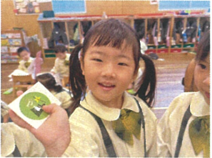
ジャ〜ンマシ♡ 「緑色だった〜☆」