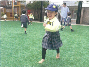
「裸足でも良い?」と 聞いて、ダッ〜シユ〜