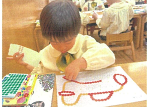
少しづつ指先が器用に なりました!