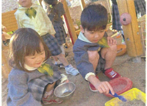
お友だちとお料理中... 何が出来るかな?