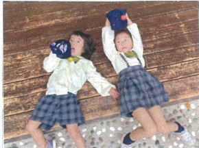
ラッスに寝転んで ちよびり休め