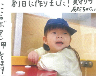
このボタンを押すと音が なります♡