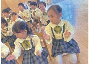
先生を見ながら手拍子! 上手にリズム叩けるかな?