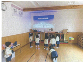
クラスで楽器に触って みたよ-ブロック音の鳥3の 楽しい! ずっと鳴いた、 DVD見えます♡