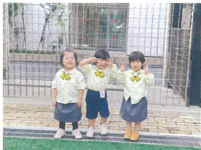
かわいく立っていますか 今からかけこみます!(笑)