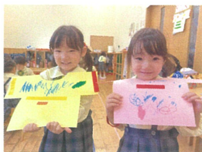
好きな柄を描いて... みんなTシャツが出来るかな?