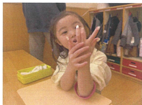
今日もキールしたの♡ どう?? かわいい??