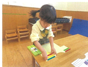
ビニルテープを使い、 Tシャツを作りました!!