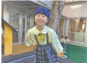
トランポリン高く跳べましょ!