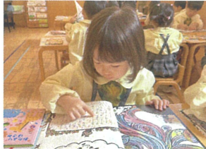
少しづつ読める部分が 増えてましょ!