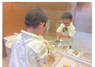
バイ菌さようなら