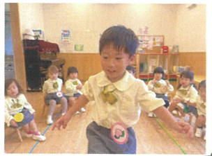
たふんと.. 110円の110円中「せんせい、いた!!」 たき焼きも作っています。 フルーツバスケット たくさんお皿を並べて準備しています! 招待してくれたい。 たき焼きはおいしく見立。真ん中に立ち。緊張