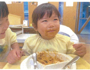
お口の周りにおみか

だりすまはスロウ 「せんせいどうぞ てまあかしました 空りくる椅子 まわらねまか