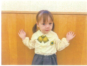
Happy Birthday ☆ 3才になりました♡