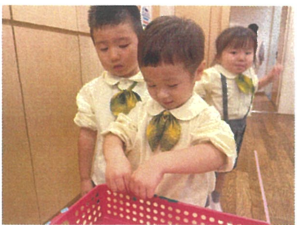
先生が切ったシールを 少しづつ取って貼ります!