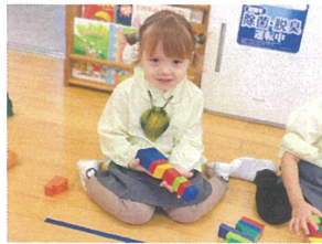
ブロックあそび、ブロック //せんせーとるねーが