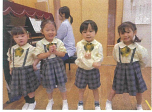
朝の会の歌の時間! お手本に4人のお友だち☆