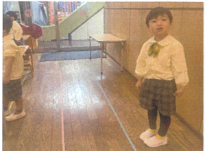
久しぶりの日直どきだ!