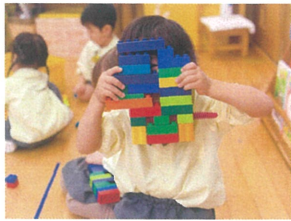
ブロックあそび、ブロック //せんせーとるねーが