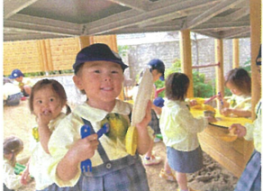
「今お友だちと一緒にケキ 作っているのよ!」とニコニコ♡