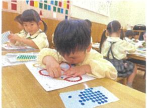
集中しすぎて、距離が 近くなってしまったよ