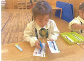
落ち着いて上手に 切れるようになってましょ!