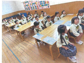
月夜を立して、キップが 少しづつ出来るように