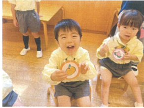
集団あそび、今回はフルーツバスケットを行いました♪