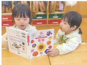
友達を見て、3冊鑑が 気に入るから-一緒に♡