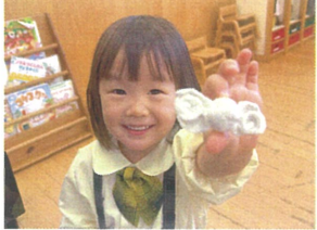
「見て! キャンディ作ったよ!」 自由あそびが始まると...