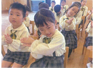
《音あそび》体をゆらして、手をたたいて♪ 音舞台の曲を音階で歌ってリリリです☆