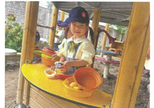
お皿を洗山準備して お店を開きまーす♡