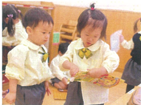
今日お手紙あそびと 連絡帳を出してきます!