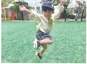
いえ〜い!!! ヒーロージャコブが参上!