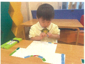
1枚ずつ集中して テープを見取る姿も!