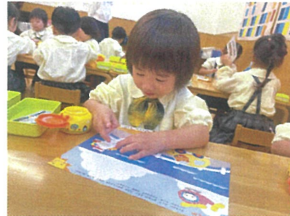
剥がれないように 端まで塗ろう