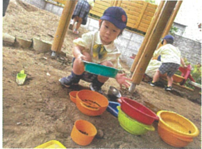
石臼をふろいにかけて ケーキ作りです