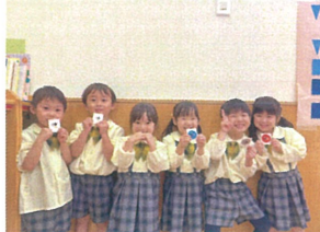
みんなと一緒にシールをGET! 手を挙げて合図です!