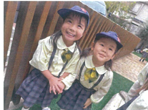
手を繋いで散歩中♪ 1歩良しですね♡