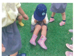
くまさん役は 眠っています??