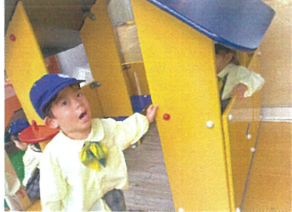
「見て見て~黄色いお家で 遊んでいるの。いいでしょ~」