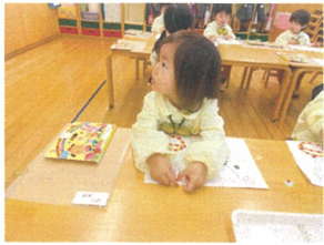
シールあそび、どこに 貼るのか確認中♡