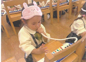
曲に合わせて吹ける音が 増えてましょ!