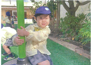
勢いよくワルワル〜と たくさん回っていましたよ!