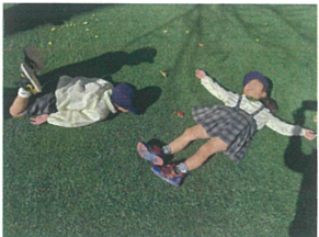
新しい先生はフカフカ 気持ちいい~