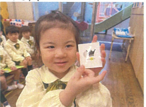
「私は、コレでした! (笑)」 カッコイイ見せ方デス☆