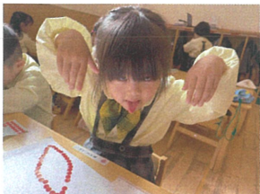
おばけだぞー!! おばけの真似