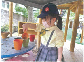
今はお菓子を 作っているの~!!