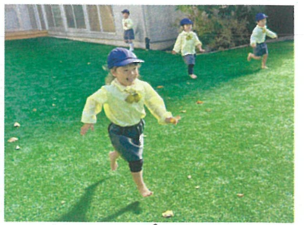
カスタネットに挑戦 マラカスは鳴らすと ワッキンク タイム 裸足にはなつて、走って 走るの楽しい～!! 先生の合図を見て真検モード。 どんな音が聴かれますか? みまもつてクククして痛いかは