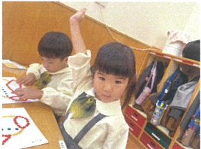
出来たら、右手を挙げて 合図をします