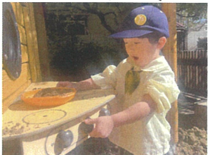
砂場で、クッキングの グツグツ何が出来るかな?