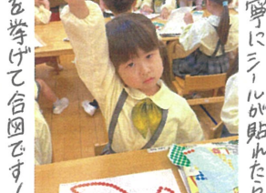
指先が揃ってハッチャリ♡