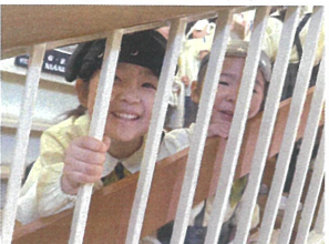
先生撮って〜と 間から、カアイ笑