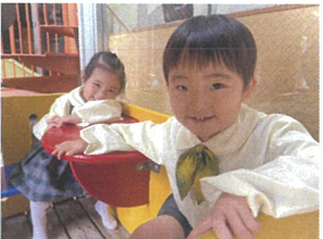
お友だちと一緒に お家ごっこです☆