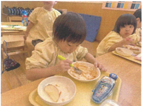
最後までキレイに 食べられたね♡!!