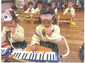
朝の時間に先生と 鍵盤ハーモニカ☆