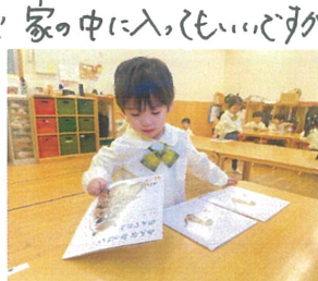
（ぼくの絵本はどれか?）