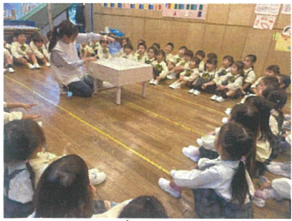
すくわくプロジェクト を行いました