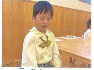
「ニ、あいてるよ!!」 トラに变身して 「かオ～」 みんなで輪にはなれたよ☆ とても真剣な表情多 目を見つめて静かに音を聞 いています!