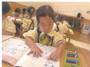
クレヨンの前に拍で なぞります!! 上手