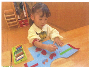
自分で作ったオリジナルの Tシャツが出来上りましょ!