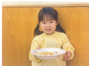
全部食べたから りんごのおかわりしたよ♡