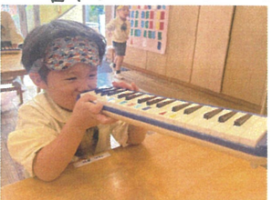
あれれ!? ホースを 忘れた子の吹き方が... (笑)