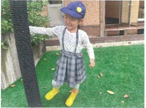
ゆりかごスイングの 11順番待ちのお友だち!