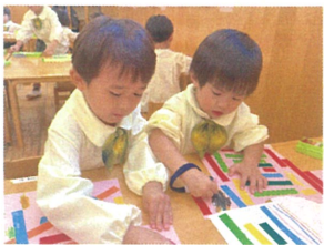
好きな柄を描いて... みんなTシャツが出来るかな?