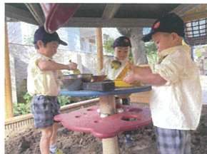
3人でお料理中。男 勇気ですね