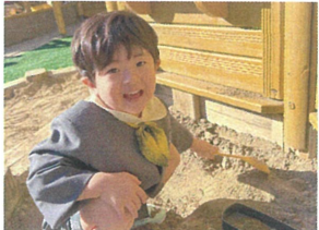
今先生のために ご飯作ってるよ!