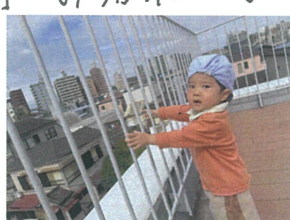
指をさして... 電車が来たのを知らせてくれました