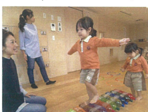
両手でバランスをとり まっすぐ前を見てステキ♡