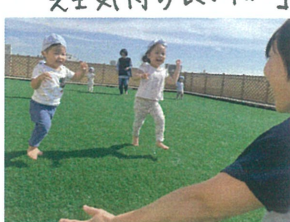
先生のところまでよーいどん! 速い! 速い!!!