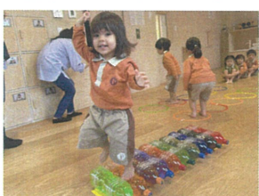
ちよと小布いけビ... 元張りました♡