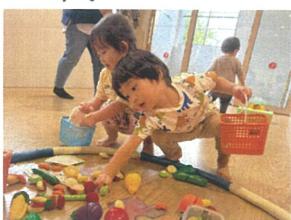
"これは何屋さんで売ってるかな?" "好きなものを2種類選んで!" "お店屋さんお届け~!!!" "キッチンと品物を届けられたかな?"