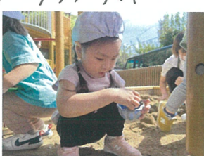
久しぶりの砂遊び 夢中で遊んでいます!