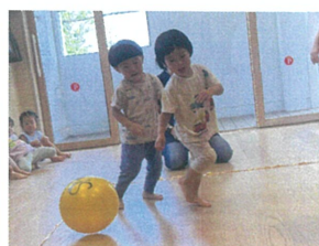
"おーっととっ" "重さがジャンクロしてます"