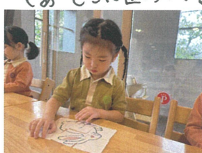
パズルの知育に挑戦! "完成" とは上手です♡