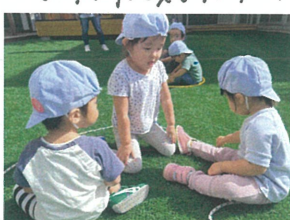
笛が鳴いたら フラフープの中へ