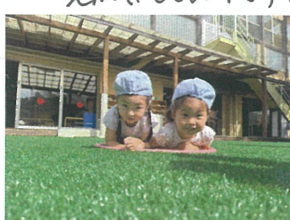
2人中長くフラフープへ "気持ちいいね♡"