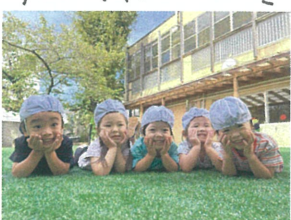
秋めいた気持ちの長い日 かわいいポーズで...♡