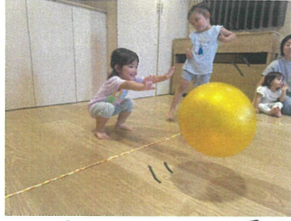
"中あて...で最後まで残った3人には、外野をやってもらいます。" "身体全体を使って..." "えい!" "それ!!" "当てちゃよう"