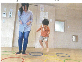
横にジャンプ!!! すごいジャンプカニ