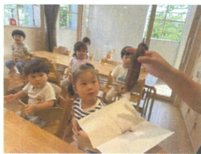
"大きいねー" "電車" "みつけた" "泥のついたおもい" "おーい!!!"