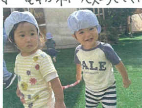
"しっぽい" "つかえた"