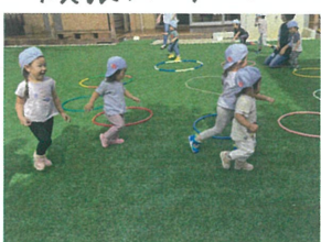
走れ走れ~ たくさん身体を動かします!