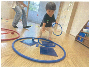
同じ色のフラフープに入れられるかな? 1歳児クラスのお友だちも正解することが出来ました!