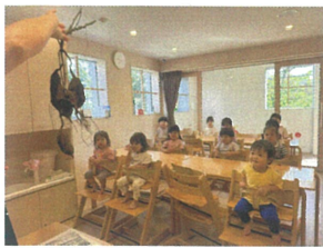
つるのつたにおもい♪ みんな夢中で見ています