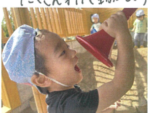
"聞こえますか~?" とても楽しそう!