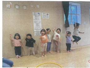
始まる前に気合いを入れて... "頑張るぞおー!!!"