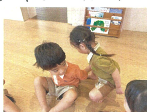
"ハンカチ落とし" "さあどこに置くかな?"