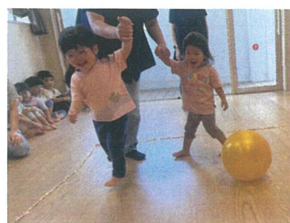
逃げろ! 逃げろ!! 先生と一緒に逃げる練習