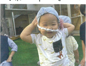
あれあれ~?? しっぽがお鼻に!!!