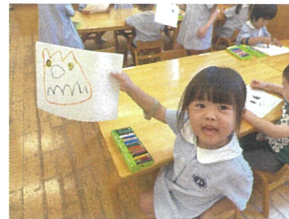
二コノコがぼちやに してみました!!