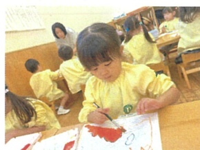
今回は初めて絵の具を混ぜて