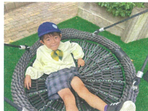
新しくなり乗りやすくなった