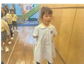
準備が早くて"目直"さんに