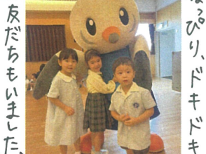
お友だちもいました カメラ目線は バッチリぞすね! ☆