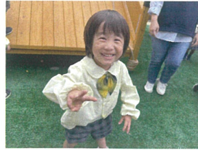
今日は15時に帰ったら お迎え来るんだよー!!!