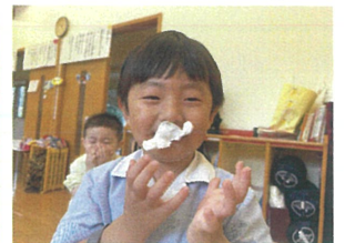
粘土でヒゲを 作ったよ!! (笑)