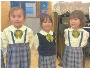
歌が上手なお友だちに