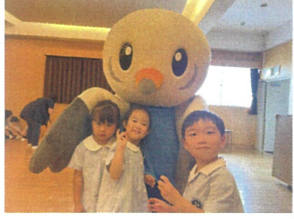
カメラ目線ぞ... ハイ! ポ〜ズ😊