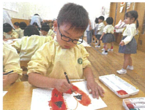
絵画の発表は... "はじき発表"♡