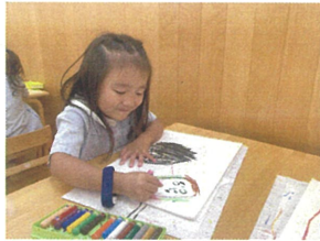
人の集まりが上手に 描けるように♡