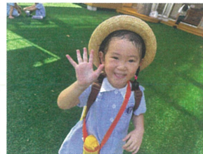
また明日も 元気に来てね!!