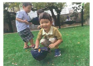
葉っぱ拾いゲームが 到来しています♪