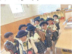
降園前"クラス"を"覗"くと