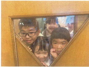
年中の鍵盤ハーモニカを 廣下から見学中♡