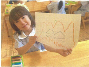
かぼ"ちゃ"のお山がポイント!