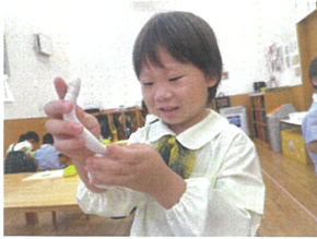
今、バック作り の途中だよ↑