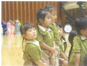
他の学年の種目は

チキンダンスみんなニコニコでした♡ 真実な顔で応援していました! 上手になってきました♪