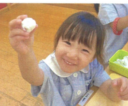
自由あそびの時間も"先生見て〜!"と