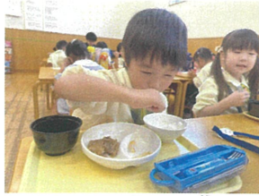
大きなお口で モソモソ食べます♪