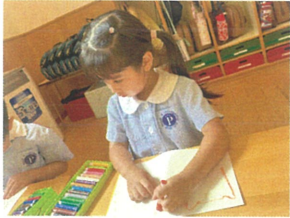
お友だちの絵を見て