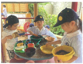
お砂場で、パーティ準備!