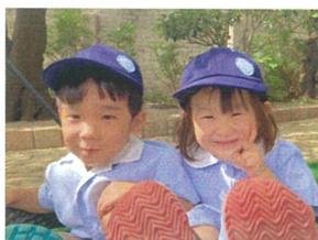
お友だちと一緒に"ゆらゆら"