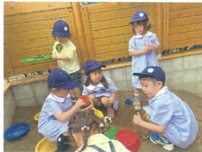
お友だちと"借して"と