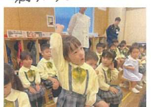
指先が揃、っていて"素敵"だね*