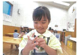
ひつたりの指車輪が 出来たの♡