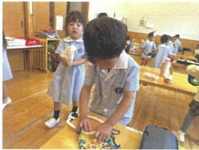
ホースはまるめて 片付けます♡