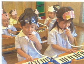
ホースの持ち方、指使い、