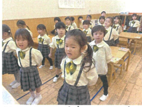
年少合同で車月の会を 行いました♡