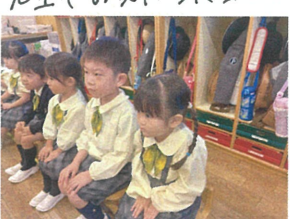
座、ているときも指先まで