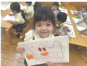
ハロウィンの発表を 描いたよ!上手??