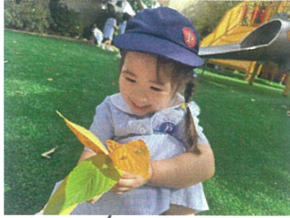
いっぱい見つけて 嬉しそう♡♡