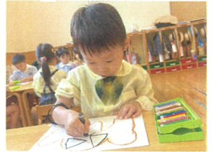
絵画で"かぼちゃ"のハタケを描きました♪