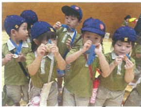
園長先生からメダルを いただきました☆