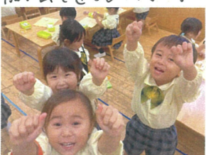
粘土を持って"どっちの"手に入、てるか"大人気"々々