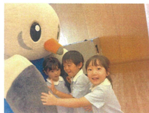
ゆりーとくんが"遊び"に来てくれました!