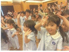
みんなでゆりーとダンス♪ "左手数字、右手準備"