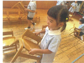
椅子のお片付けも 上手になりました↑