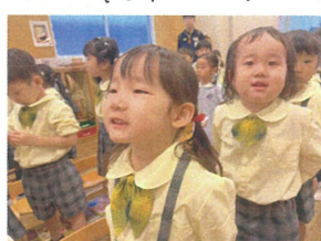
歌の"姿勢"も"視線"も