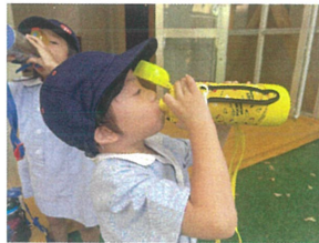
こまめな水分補給も 忘れずにね♡