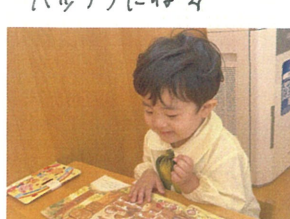
ゆっくり"クラス"で"絵本"14♪