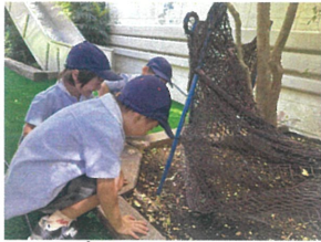
園庭に出ると... この場所が一目青々!!