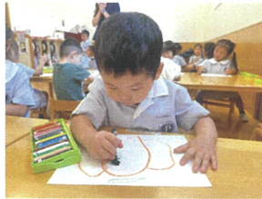
絵画で口おぼちやおぼけを 描きました♡