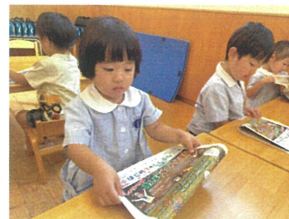
自分で新聞紙も 折ってみました♡