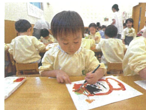
オレンジ色も自分で 作りました!!!