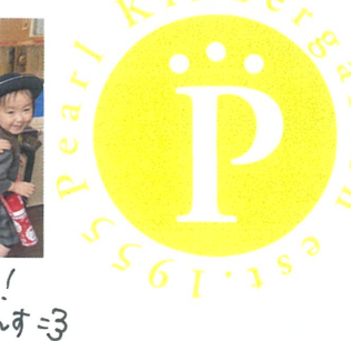
降園電車、出発です! 下馬太箱まで、まいりま〜す😊