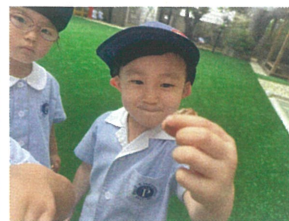
セミの抜け殻も GETしたよ!!