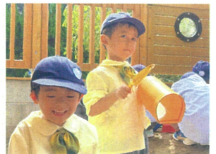
砂場の玩具でトントントン♪