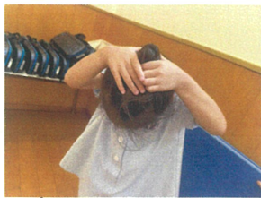
見て!!自分で お団子作れるよ♡