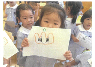
二コノコがぼちやに してみました!!