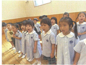
ハも1つにして... 音楽をしています♪