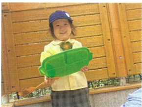
砂場では"ご飯"や"ケーキ"をみんなで作、てくれます!