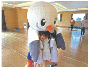
ゆりーとが遊びに 来てくれました♡