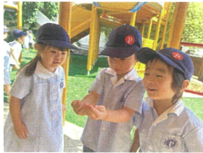
たくさんのお団子 見つけたよ♡