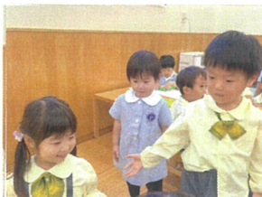
お部屋に"アリドット"クラスさんが"遊び"に来てくれました!