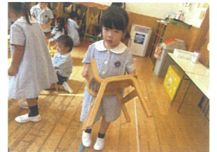
持ち方 運び方も バツキリです♡