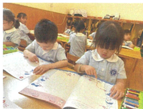
最初は拍でなぞって から始めます↑