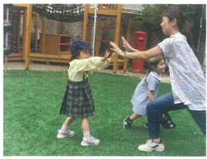
フリフリ バリア〜☆ (先生とフリキアごっこ)