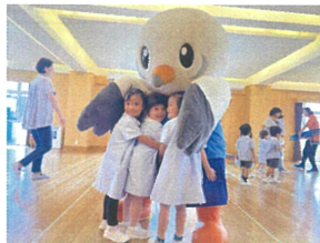
お昼合いタイム♡ キュー〜したよ!!