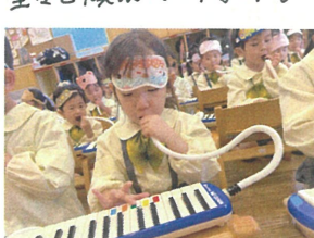
鍵盤"ハーモニカ"の