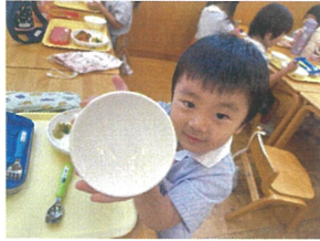
全部食べて ピカピカになったよ!!