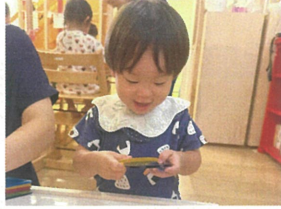
絵本に出てきた、あおくと ときいちゃんだね♡