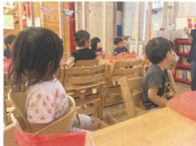
敬老の日の製作は 「りんご」を作る!!