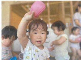
自分でカップに水を ためて...「ジャー」