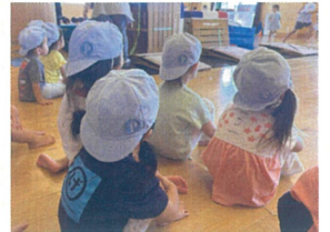
サーキットの様子を 真剣に見てます☆