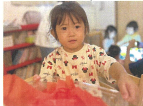
お花紙ってなんか フワフワしてる...?