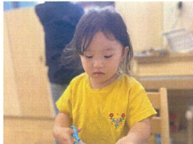
ワキをギョッとそして 下からチキチキ〜!!