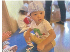
ヒーローヒーローのバス の音が聞こえてきた!!