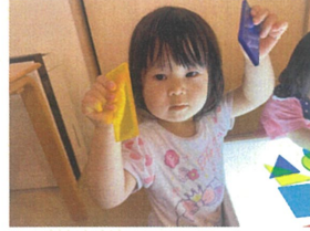
形が同じことに 気付いたよ!♡