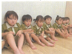
お山座りが上手だね お友だちが増えてきた☆