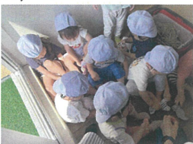
久しぶりの屋上〜!! みんな支度が早い♡