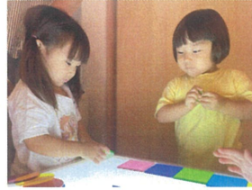
HIKARI to Tableで 光をあてみる☆