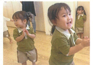
こんなに楽しく踊って くれています♪