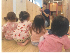
モザイクタイルを使って 実際に見てみよう☆