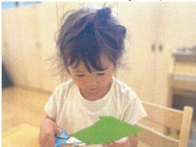
ベリルクラスは一人で セッティング!