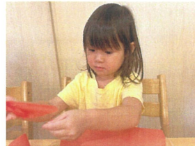
ビリビリ石版くま〜! せーの! ビリビリ〜!