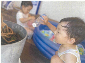
元気に育つねの 気持ちを含めて水やり♪