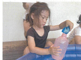
器用に水を入られる ようになりました☆