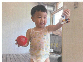
大好きなキャラクター! さっそくお気に入りです☆