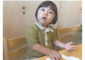
足の向き、こうであって? ノリ付けるね!!