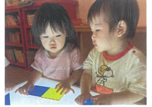
テーブルの光に 針付けの様子...♡