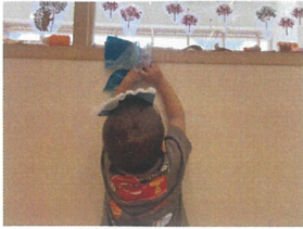
こんなところまで 届くようになりました^^