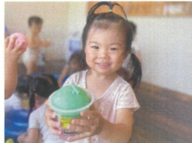
先生 お待たせ〜 メロンジュース完成したよ!