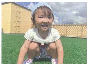
何してるの〜?と覗いたら 「バァ!」とこの表情^^