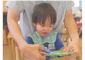
ルチルクラスモハサミ に挑戦せ! がんばれ!