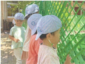
少しお園がででき あがってきた!楽しみ♪