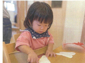
みんな最後まで 集中して行っていました。