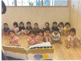
「あおくとときいちゃん」 どんなお話かな〜?