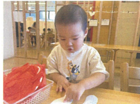
ハサミの後には... ノリの作業☆