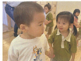
チキンダンスの練習! お母さんに教えないと☆