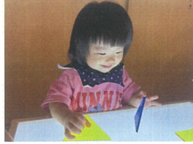
私はタイルを立てみる! 上手に立つかな...