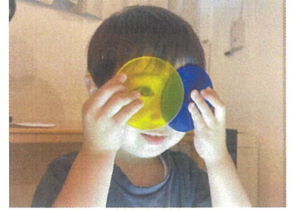
モザイクタイルを メガネに見立てて...!?