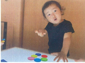
同じ形を集めてみた! キレイだね〜♡