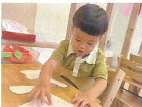
足が大きくなったから のりもたくさん貼らないと!