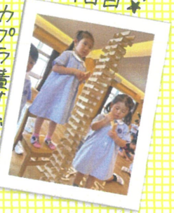
カプラの積み上げられました!!