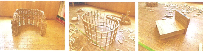
メノウで合同の朝の会を行っている間に作ってもらった作品たち!!すごい!!