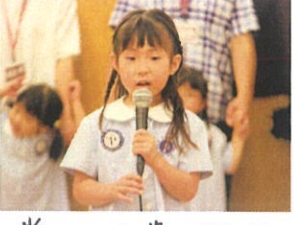
堂々と6歳にちよと頑張りました👧