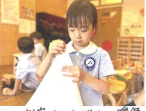
〜お店屋さんごっこの準備〜綺麗に三角に折れています👧