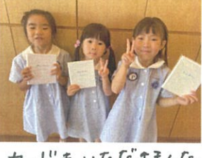
カードもいただきました。みんな大きくなったね👧