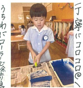
うちわにローラを塗ります♡