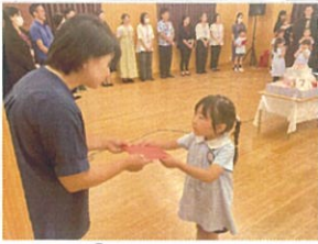
目を見てプレゼントを いただきます♡