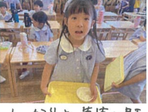
しっかりと先生の目を見て「ありがとうございませう!!」