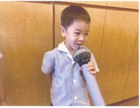
インタビューの練習♡