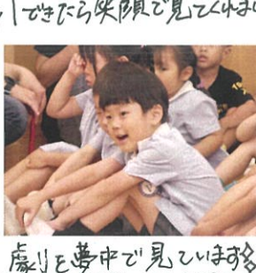
劇を夢中で見ています♡ 次は何色かな??