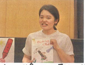
今日のお楽しみは「おしゃべりのくねん」深山笑「にねん」