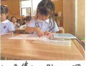
とても集中して貼っています👧