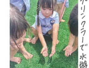
スプリングラワーで水遊びが 涼しい♡