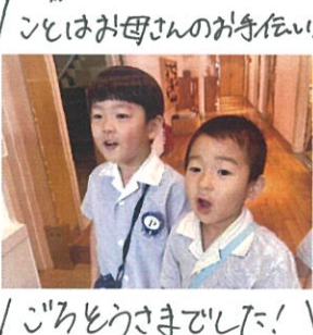
「ごちそうさまでした！」 おいしかったです♡