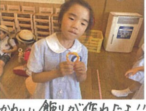
かわいい飾りが作れたよ!!