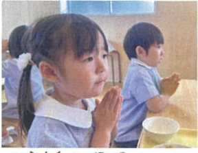
感謝の気持ちを入れて 「ごちそうさまでした」