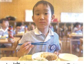
お箸をしっかりと持ち美味しそうに給食を食べてます!