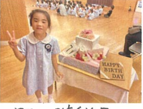
7月の誕生日ケーキと一緒に👧