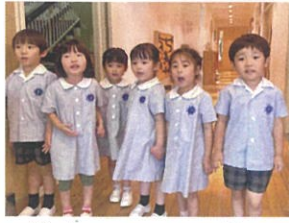
P-kitchenの日に、 「美味しかったです！」