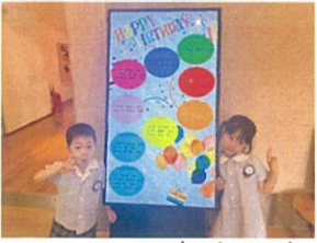
Happy Birthday ☆ 5歳になりました!