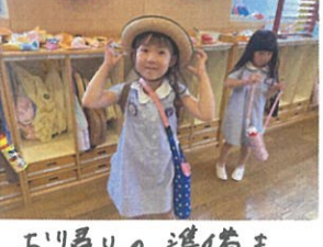
お帰りの準備もバッチリです👧