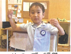
〜ソーラン節の練習〜真剣な顔で頑張っています👧