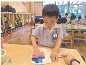
うちわにスポンジで 色を付けました♡