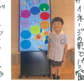
カーネットクワース♡