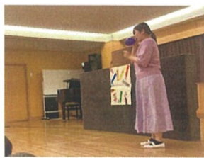
夫からのプレゼントは 「おしゃべりクレヨン」でした♡