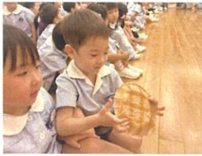
ハイをもらっちゃった♡