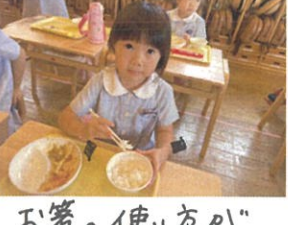
お箸の使い方が少しずつ上達しています👧