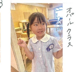
バスケットももらってよ♪