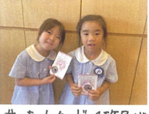
「サネットカード」1枚目が終わりました👧