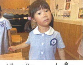
じゃ〜ん👧青いバッチイ合ってる〜