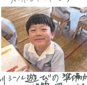
シール遊びの準備が できたら笑顔で見せてあげよう♡