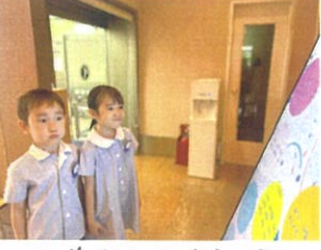
名前あるか?〜?にらめ。心中の顔が可愛い💖