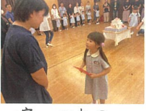
丁寧に お礼を伝えられていました👧