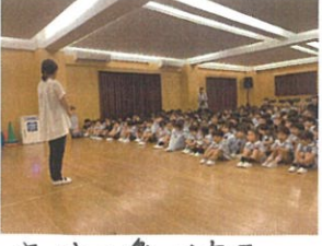
座り方や楽しみ方と確認してからStart👧