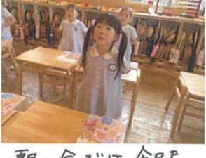
朝の会では今日も素敵な表情で行っています👧