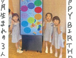
7月生まれの3人でサインと一緒に👧