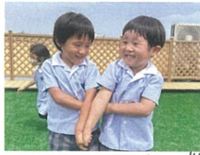
大女子きばお友だちと♡ 何のポーズにしよう??