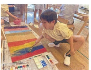
7月に6歳を迎えます