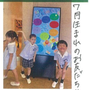
7月生まれのお友だち♡ それぞれ個性が...♡