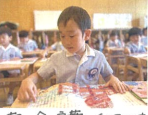
朝の会の言葉のチカラで指の位置、声の大きさをバッチリ