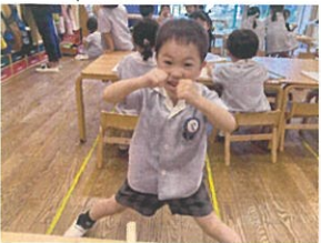
パンチパンチ ☆ 強くなったね