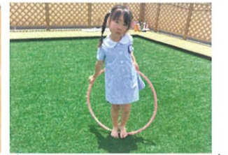
フラフープ何色しようかな??