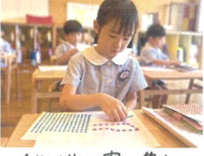
1枚1枚丁寧に集中してシールを貼っています☆