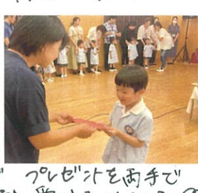
プレゼントを両手で 受け取りました♡