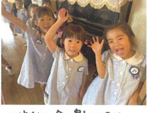
お誕生日会楽しみな〜 / ほ〜い!!👧