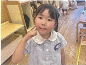
たくさん遊んで りんごは、へに♡