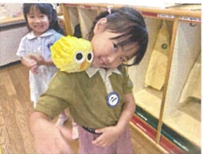
劇で使っていた 肩乗せピョちゃん♡