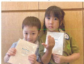
園長先生からプレゼントを いただきます♡