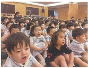
7月生まれのお友だちに おめでとう〜！♡