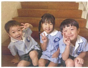
お誕生日会の前に！ 7月生まれの子でポーズ♡