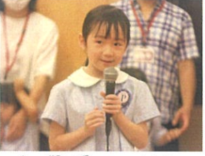
少し緊張したけど笑顔でインタビューを受けています👩🏻‍🍳