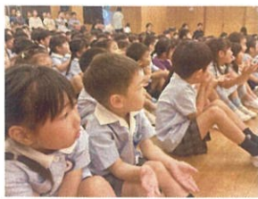
お口はチェリー♪チュ！♡ ミックスジュースの手遊びが夢中♡