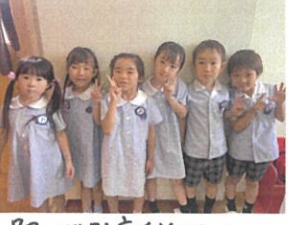
7月のお誕生日の6人です👧