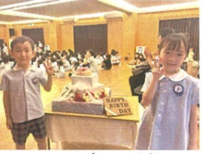
ケーキの前で仲良く2人でハイ、ポーズ👧👧