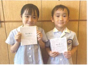
先生からプレゼントをいただきました📄