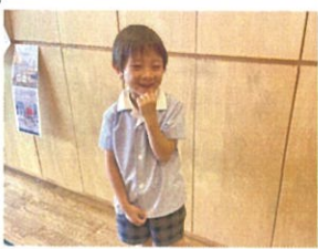
インタビューなんて答えようかな〜と考え中です💦