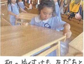
お礼の片付けも友達と一緒に行動していただきました👧