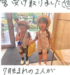
7月生まれの2人が 一緒に登園してきた♡