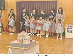
7月生まれの年長さん / ほ〜い!!👧