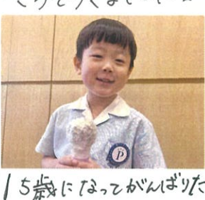
5歳になってがんばりたい ことはお母さんのお手伝い!