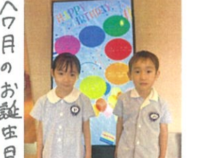
サインの前でパシャリ📷