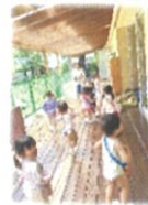
水あそびするぞー!! 哭娘のメノウさん

水着のご用意ありがとうございました。なのでか 水遊びできるタイミングがよくなりました。先日初めて水着に 着替え屋上へ行きまして! 水遊びするところと音こで いた子どもたちです! 屋上へ行き園長先生が新しく 用意してくれたスプリングラーを回してみよと... ちょっと びっくりしながら、誰も近寄らず先生のほじこへ(笑)