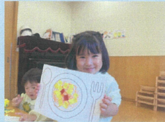
初めての集合写真!