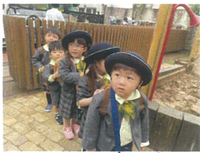
桃コースト列車です♡ おはようございます!!