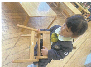
両手で椅子を持って お片付けするよ♡