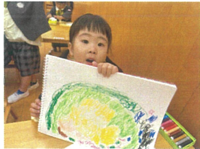
大きな庭を 描きましたー!!!