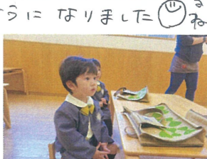
スモックを取って お荷物作りスタート!!