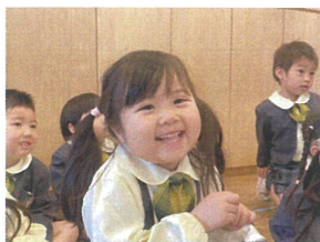
絵本が、気に入ったのか、 笑顔が沢山見られました☆