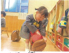
お着替え袋リュックをあけて自分で持つ 来々かてます