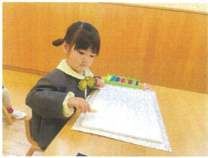
クレヨンの持ちかたがオシャレ☆ 何描いてるのかな?!