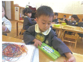
クレヨンを使う時は 必ずゴムの外すよ!