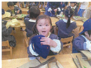
クラスキャップも一着に 入れるんだよ!