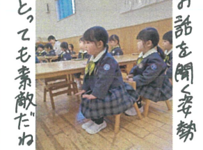
とっても素敵だね♡ お話を聞く姿勢