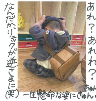
あれ? あれ? あれ? 一生涯懸命な姿にきゅん♡