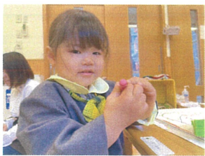
ピースのワロンで 何を描くのかな!?