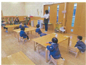
卓月の会が始まります