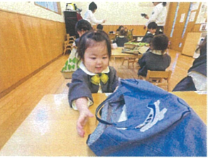
サブバックの中に 丁寧にしまうことできるかな?!