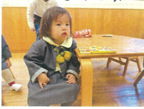
話を聞く時は手はおんぞ! 真剣なまなこ!