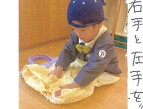
右手と左手を 「おこの七割、ニャー」