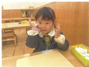
コロコロ～コロコロ～ ほのぼほコロコロ～♪