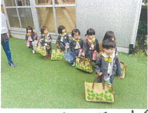
一列で並んで待つ上手!! お母さんいるかなー?!