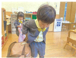
リュックからあつる たいはん