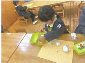
1つずつしっかり お片付けをするよ!