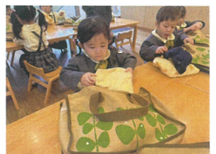
畳んだスモックを、そ〜と 入れられました☆