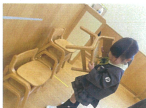
しっかり重ねて お片付けできるかな?