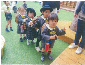
紺コース幼稚園に到着♪列車も上手☆