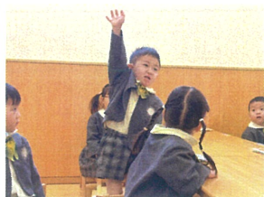
勢いよく手を挙げて お返事してくれました!!