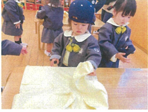
スモックはまね袖から たにみま!