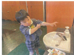
手を洗う時は 必ず袖をまくります♡