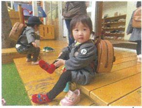
「おはようございます」 今日元気に登園してきます