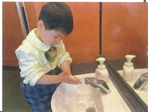
手を泡で、よ〜く洗います!