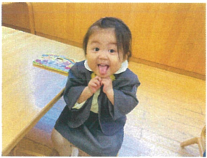
手遊び途中にゴメン すてきな表情を見せてくれたの☆