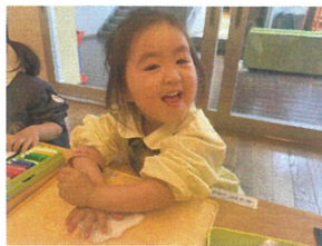
ねんど板の型に 押し当てて、ぎゅぎゅっ☆