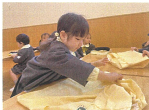
スモックの袖の部分 折り畳んで...