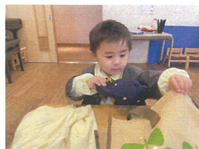
できたお友だちから、 サブバックの中へ♪