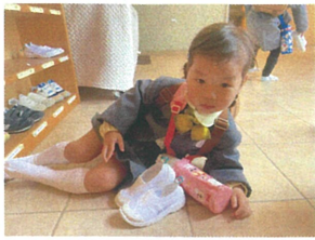
靴をぬいたら すべっすまいます