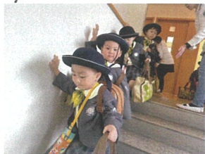
週末はサグバックを持ちながら階段を 昇ります...ゆっくり慎重にね! さようなら♪