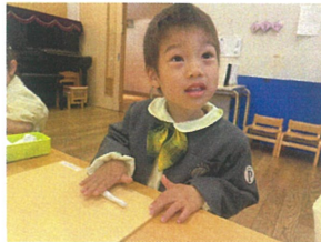
コロコロ〜って、やってみると 長くなったよ! 目がキラ☆