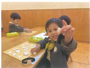
1見て見て 置たるまへ と見せてくれました。