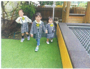
年少クラスのお姉さんと一緒に散歩中♪