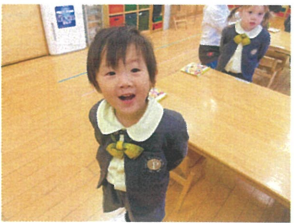
なかいまの歌かうにえず... かいじゅうさんの口 見せると伝えたら こんばんはにスマイルが!