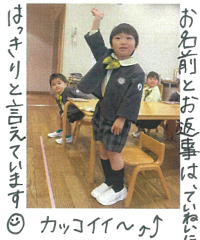
お返事を忘れてしまいました は、ッキリと言えてます カッコイイ〜♪