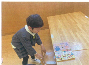
席を立つときは丁寧に 椅子をしまうよ!