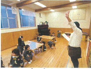
お名前呼びしたら 大きな声で返事をしてくれ!