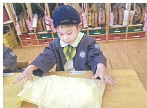
1つ1つ丁寧に 畳んでいくよ!