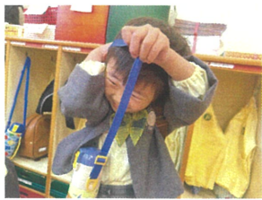
水筒のヒモ、上手に 取れるかな??