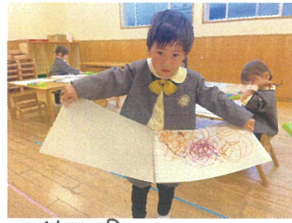
「先生見て〜!」と 見せに来てくださいました