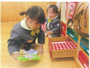
お名前付けの時間 引き出しにしまおう!