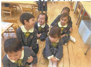
お片付けが終わったら すぐにお山座り!