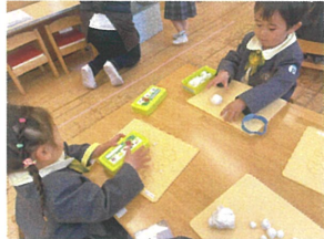
蓋を開けてゴムまき かけられるかな?