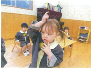
トントントントドキ〇ちゃん かかんどキ〇ちゃんに変身☆