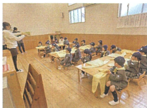
スモックの畳み方を 聞いている時も真剣な表情♡