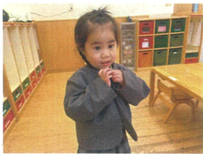
ホレロのボクワンモ 自分でできるよ♪