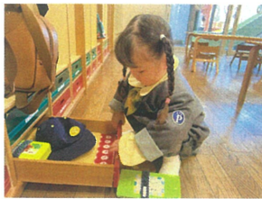
今日は、クレヨンで お絵かきにするのよ