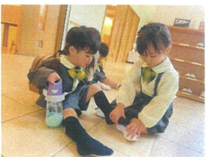
うわはき難しい〜な 年長さんが手伝ってくれたよ〜♪上手に描けるね♪