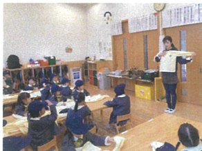
スモックの量かさを 説明しています♡