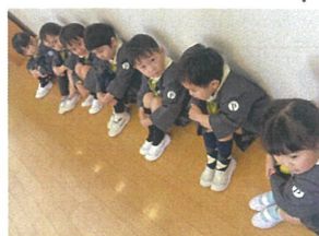
お山座りとも 上手にできるよ♡