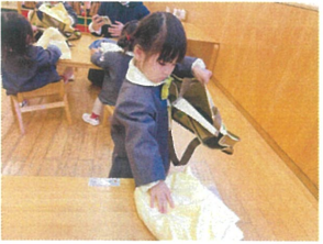
初めてたにんだのに とっても上手にできたね!!