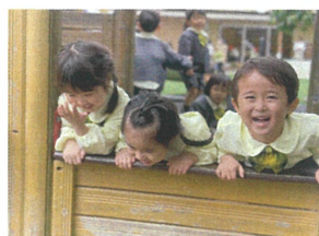
こちらも素敵なお顔を 何か見つけたのかな?