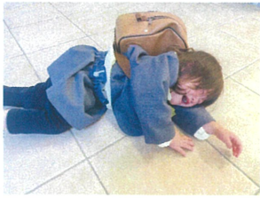
今日も絶好調♪ 元気に来てくれたね😊