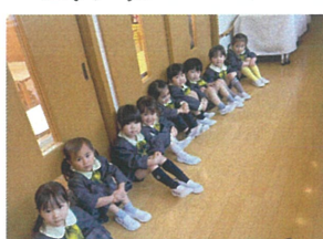
真剣な表情でお話を聞く 準備はバッチリだね♡