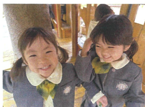
仲良しなお2人... 素敵なお笑顔だね♡