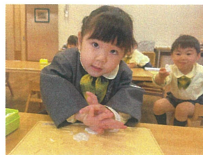
私もやってみる〜!!!と お友だちの姿を見て挑戦!