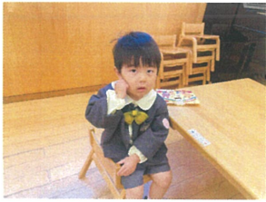
こぶじいさん 片方のみこぶが!