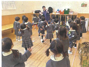
大好きなダンスタイム! 今日も景色大好き周ア!