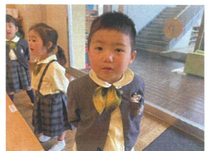
↑ちょっぴり緊張を しているお友だちも、いますよ、 やってみようとしてくれてます☆