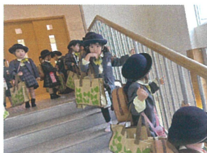
少し重いけれど、自分で お荷物を持ってるよ♡