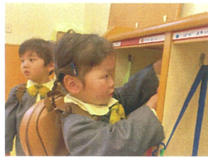
荷物をフックに かけていきます