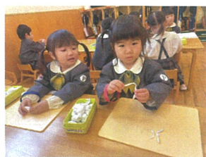
コロコロしたら長年しい ものが出来たよ♡