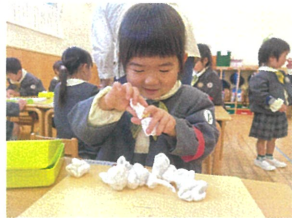
粘土をいっぱいつけて... 何が出来るのかな?