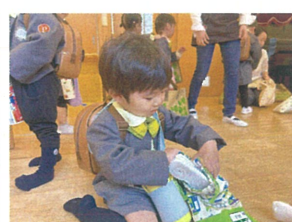
うわばきを自分で... 上手に仕上げます