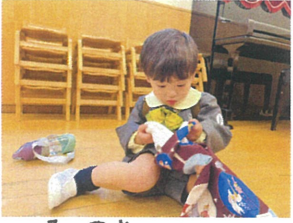
帰る直前にうわはきを見せたくれましたよ!