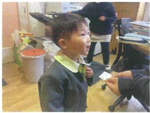
お誕生生日バッチをもらい お礼を伝えに言ったよ!