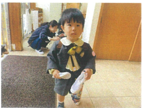
うわはき見つめました! さあ、自分で履けるかな?!