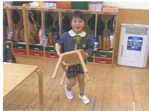
椅子の持ち方も 伝えました☆