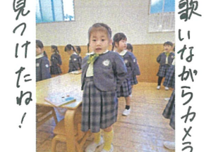
見つけたね! 歌いながらカウを 見て歌えているね♡