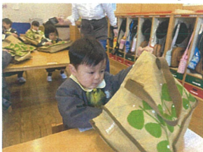
ひとりで、できましたん!