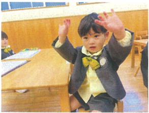
室内あそび中にピアノを弾いたらキラキラして☆