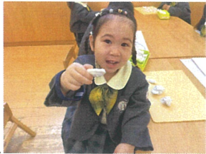
はい!! お寿司を どうぞー!! 食べて!