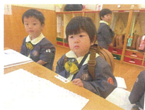
早く遊みたくて、先に 座りました