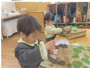
まずは、自分でやってみて もらいました☆☆