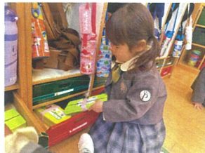
クレヨンが1番上に 片付けるよ☆