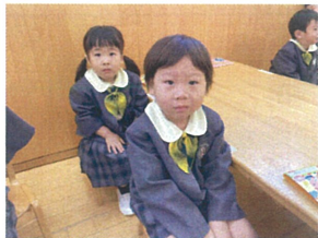
腰背が立っています!! カッコいい♡