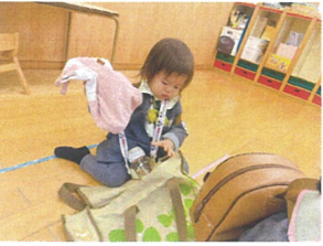
私も自分のことは自分で... かんばる