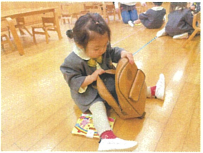
車目の会が終わったので 自分のリュックにしまおう! かたより上手にばらね!