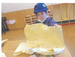
スモックを七割かた 見立てて、生地を作っています