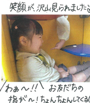
「わあ〜!! お友だちの 指が〜! ちゃんちゃんしくる(笑)