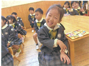
"なんでやねん"の 年芸事にこの笑顔♡