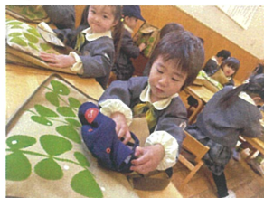
ギョウザにしながら 入れるんだよね♡