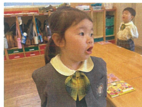
朝の会では、大きなお口で、歌っています!