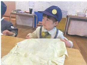
スモックは、袖を 畳んで、半分こ☆☆