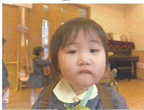
はんげんして みてる