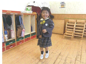
ジャンプカ板着です♡