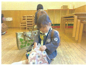
昔草を仕上げた 自分で入れています