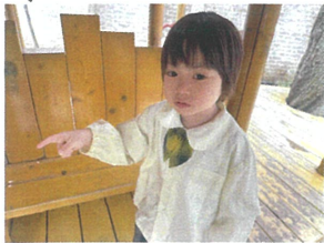
あっちに何か あるかもしれない!!