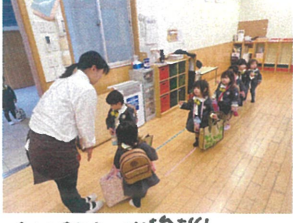
みんなとご挨拶♪ 明日の入園の日待ってるよー☆