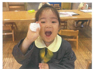
じゃ〜ん! ☆ ねずみさん ♪