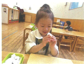
ハンバーガーを 作ってるよ♪