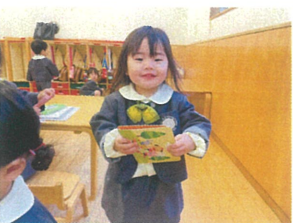
車目の会が始まるからおたよりばらみ持ってきたよ!