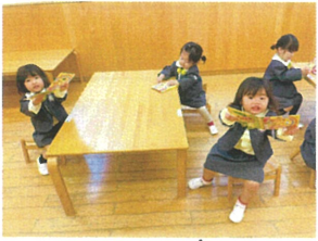
おたよりは机の中は 何もありません!!