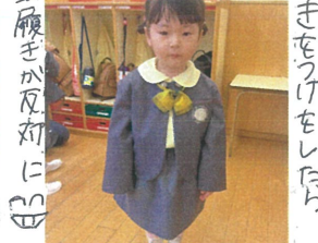
上履が反対に まをうけたら...