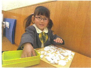
粘土土板の上に粘土が いっぱい!! すごい?