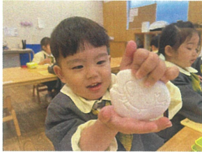
ぼくは、カブトムシ カッコイイでしょう? ☆