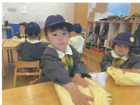
更に、もう一度、半分こ!! ☐→☐→☐完成☆☆