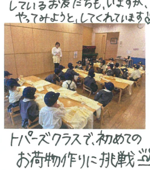
トパーズクラスで、初めての お荷物作りに挑戦☆