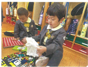
持ってきた着替えは お着替え袋に入れます!