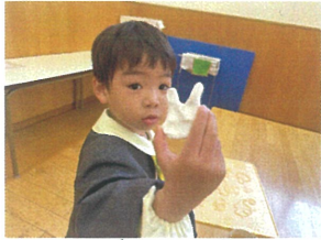
先生がウサギを 作ってくれたの♪