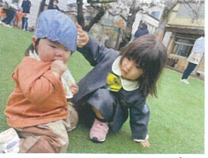
Pearl Nursery Schoolの お友達に優しくしてくれましたよ!