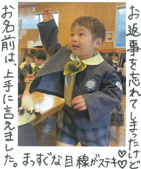
お名前、上手に言えました。 まっすぐな視線が素敵♡