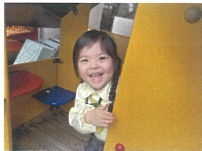
ばあ!! こくに 隠れていたのー!!