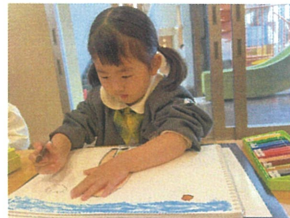
この間、お父さんの 絵の続きを描いてお☆