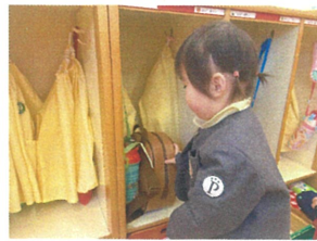
リュックの片側の方を いっちょリ