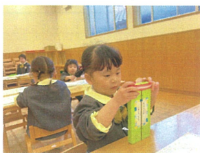
上手にしまえるかな? 早く遊みたくて、先に 座りました