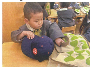
自分で上手に 出来るかな??