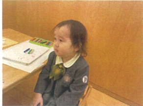
真剣な表情が カッコイイね♡