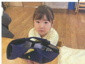
クラスキャップは、 ぎょうぎょうのよりにくると☆☆