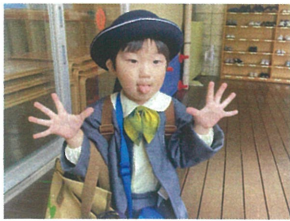
上履きもバッチリ♪ 準備できたよ☆☆