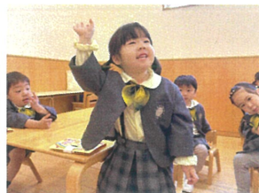
目を見て上手に名前が 言えました♪