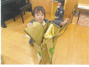
サブバックの中に 全部入ったよーグッ