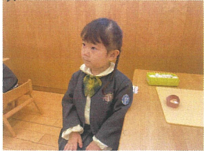
「アワアワリンさん」と 声を掛けるとすぐに お話を聞いてくくれるよ♪