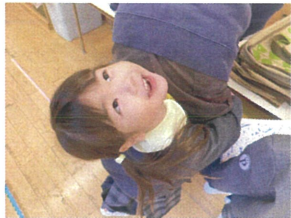
先生にきゅー♡♡と くっついちゃった😊!!