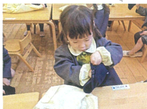
ワラスキャップも 上手に畳めるかな?