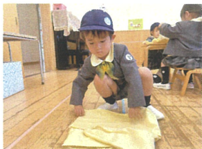
10分と半分 できるかな?