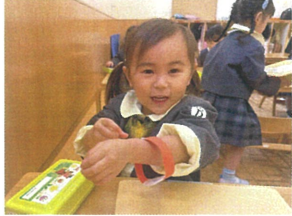
遊んでいるときは ゴムを腕にかけるとだよ!