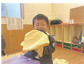
「先生できました!!」 上手に仕上げニコニコ笑顔