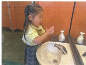
鏡に映る自分を見つめてました(笑)