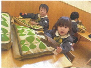
もう出来ちゃった♪ 準備バッチリだよ!