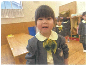
お友だちのお誕生生日バッチを 羨ましかる涙も... 楽しめがき増え嬉しいね♡