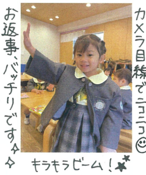
お返事、バッチリです☆☆ カメラ視線でニコニコ キラキラビーム! ☆