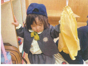
今日は週末はのびー お荷物づくりに挑戦!