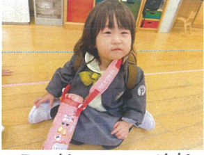
降園前にかわい笑顔を見せてくれましたよ!