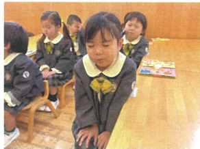
立月の姿勢... 元氣取っていますね!