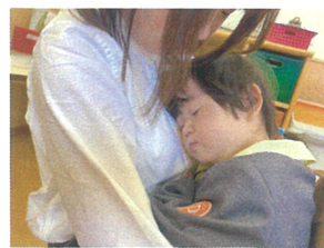
たくさん遊んで疲れたら 気持ちよくうに寝て