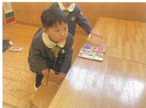
お話を聞くときは 椅子を前に向けるよ!