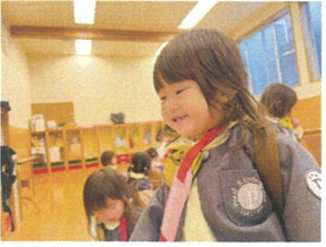
もうすぐお母さんに会えるよ! (ほっぺにもおべんこくれしぐろ)