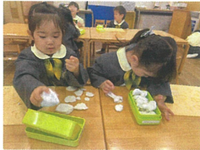
型押しに夢中の 二人の姿を発見 ♪