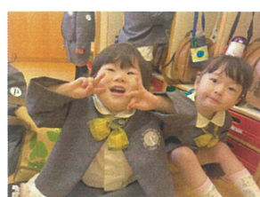
手あそびの真似 干草 「おこの七割、ニャー」