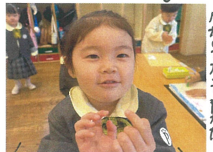
血が出たよ〜(笑) ですが クレヨンが付いた指でした(笑)