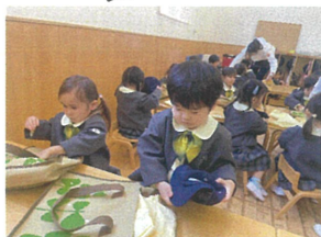
畳めたら自分で サブバックに入れるよ♪