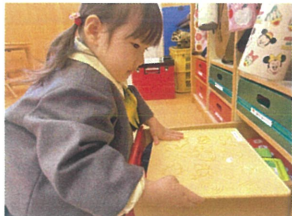
わんど板 上手に お片付けできるかな?