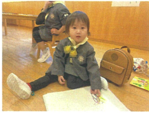
お絵描き大好き!! ゆかの上で始めました...