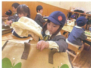
サグバックの中 に入らなくちゃ!