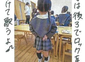
かけて歌うよ 手は後ろでロウを 素敵なお声で歌えたね!