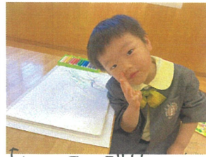
「ほい、チーズ!!!」 ピースが「本」にたっぴ かわい!