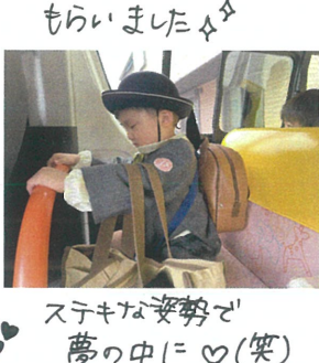
ステキな姿勢で 夢の中に♡ (笑)