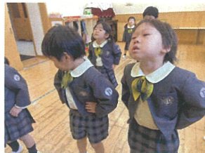
ダンス中に出してくる 首の侍様...♪