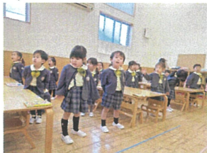
歌の華朝 とも カッコイイね!