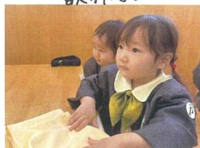
できたら先生に できたよアポロレ♡