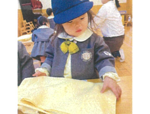
袖にたためたら下から上半分☆