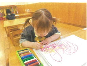
ピンクと黄色のクレヨンも