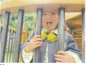
ツリーハウス中2階から いい表情を見せてくれます(笑)