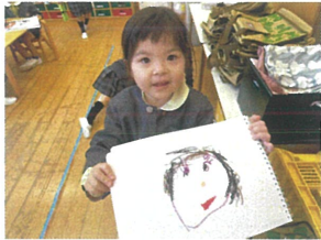
先生の似顔絵だよ!! ありがとう♡♡