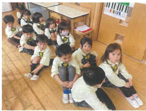
準備が色々わって お山作りで待っています!