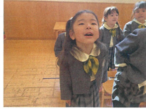
朝の会で"は"いっ ま"柔"軟な表情です♡