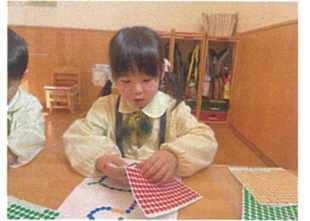
みんなが"準"備して 間に練習していました