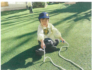
トビとびを跳ぼう したら尻もち(笑)