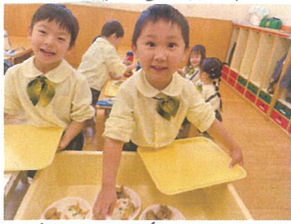
一番かた!!! 鬼さんごはん 見つけた! エレコムにしよう!!