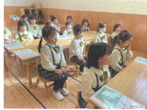
3-1が"中"の取れず 元"張"っています(笑)