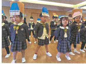
歌が始まると、110 以上は真剣でした