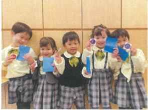
2枚目のサーキット カードも終わり☆