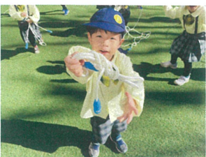
お友だちに系着んで もら。トビと喜ぼう♡