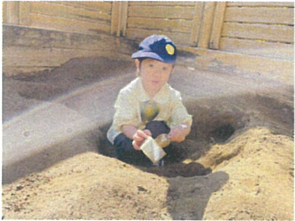
穴の中に入っている!? お砂場遊びに夢中♡