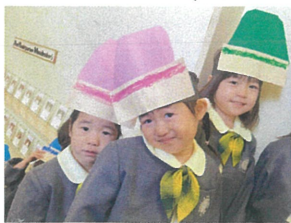
色とりどりのクレヨンたち ひとつもキョー♡