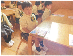
見て!カッコいいでしょ! 腰骨ヒーンっ!