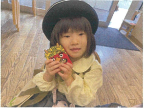
おにぎんと一緒に ハイ干杯! ♪