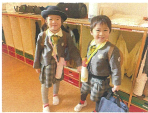
手を繋いで一緒に来たんだ 仲良しさん発見♡