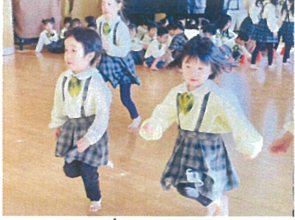
お友だちに負けないぞ! ゴールまであと少し!