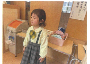
目直に"選"ばれ少し ドキドキしていました♡