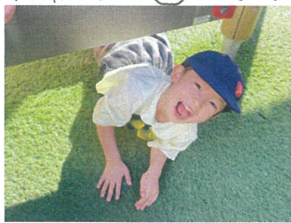
下からひょこりはん! 先生みつけた!