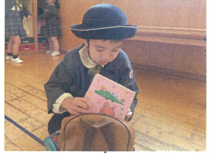
片付けの"志"かた~ お見送り