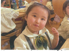
丸々1個"ハ"ンバ"グ"の おかわりを貰って嬉"し"い