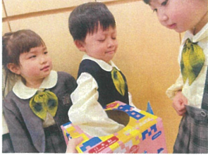
今回ほとんど ステッカーがもらえるかな?