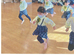
月曜の振り方が 良くなっていきます