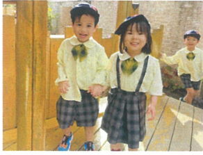
さてどこに行こうか？ 一糸着にお背負物中♪