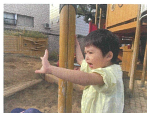
11"スコアの友だちを お見送り。ま(=明日)~♪