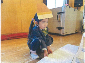
お仕事をお原真い してみました!お楽しみに♡