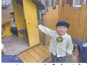
こ"い"さん出来たから 入って"い"いよ~♡