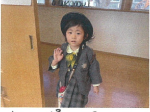
毎回"帰"り時には 挨拶をして"小"ま"ま"に