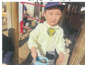
(ニ)がだんごイ作ったよー!