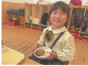
朝、会では気持ちを 切り替えて取り組んで"頑"!