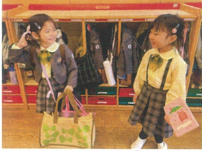
お友だちと同じ 髪型で嬉しそう♡