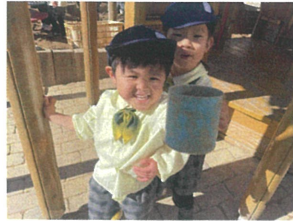
特製"ドリ"クを 一緒に"乾杯"~♡