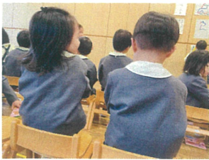
僕かっこいいでしょ! と自慢し合う後ろ姿♡