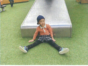
ちゅと休憩タイム