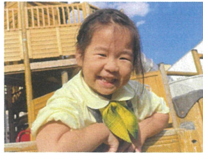
先生！せーぽー！ 園庭おそび最高♪