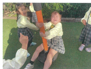
11よりも97めに回ると おります(笑)目が回る~