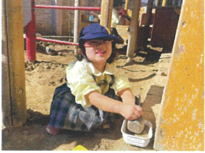
一生懸命作って 誰にあげるのかな?