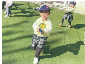
友だちと一緒に♡ さあ、出発進行!