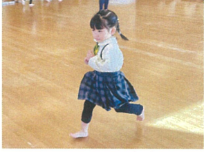
<朝のサーキット> 月曜を振ってアツシ!