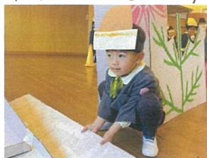
タイム見計ってよ!持ち上げろ! もう気分は年長さん