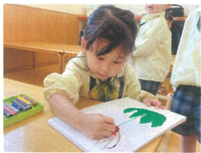
絵本「ウツクシのこころ」の クローリングを描いてよ♡