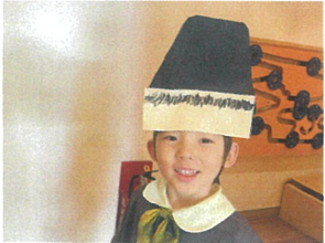
くねふんのくろくに 大変身々