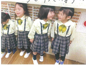
ギリギリ頭がっついたん! 先生はせまいな〜の