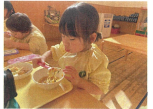
今日は"ラ"ンチ みんな黙々と食べています