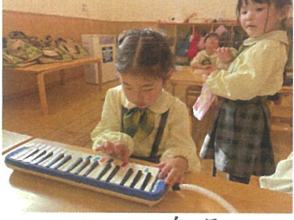
みんなが"準"備して 間に練習していました