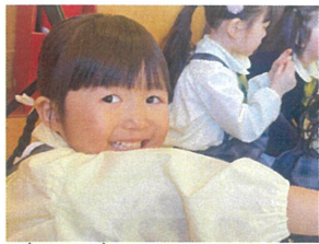
見て!! 年長クラスの 千と千尋の神隠しすご!!