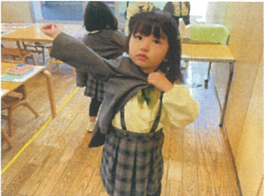
ボレロを着て UTABUTAの練習へ