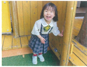
きさ〜!!!助けて! 捕まっちゃおうよおの