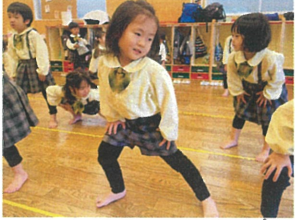
1.2.3.4... 竹がをけいように伸ばそう