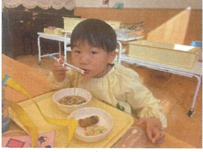
1本ずつ"展"びています(笑) 1本1本が長~い