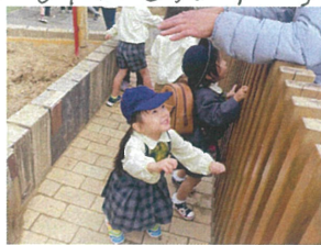
届かな〜どうかかな〜 ドライバーさんと遊んでいます!