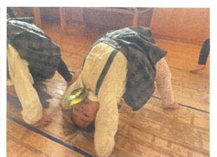
ブリッジが"できるよ"に なりました! Good