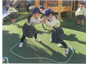
年長クラスの真似を して相撲に"挑"戦!