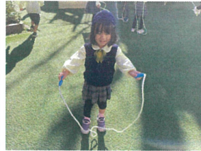
跳べるか?~? 思ったより難しい