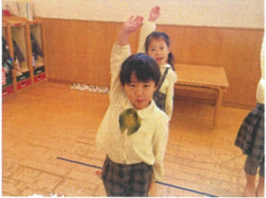
堂々とクラスと 名前を言ってくれませ!