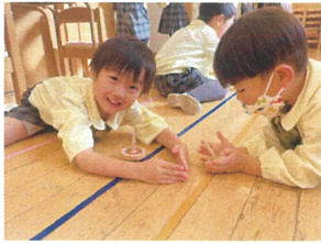
コマがぶつからないうに そっと手で守っています!!