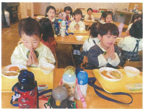
今日もおいしい給食 いただきます ♪