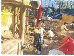
石をよに運んでい封！ よいしょよいしょ