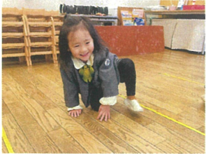
ハイハイおにごっこ ハイハイおにごっこ