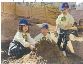
ドライバーさん! お山作って来てありがと!