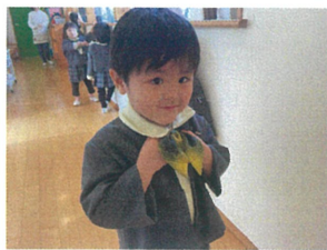
ホレロを着るのが上手く なりました。どの音調子も