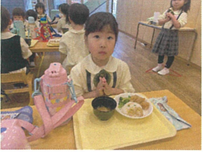
今日は節分メニュー おにぎんと一緒に ハイ干杯! ♪