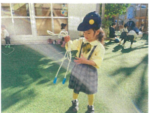
使い終わったら 結んでお片付け★