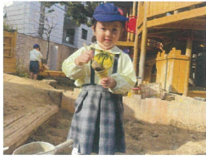
チョコアイス美味しいよ 食べてみて♡