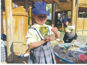
最後のトッピング 今日も仕上げそうです(笑)