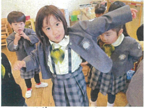
ボレロの着脱が 僕・今日お弁当! トビたん早くおできませ!