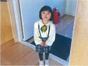
しっかり止まって ご挨拶々々