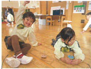
自分で回せて嬉しい! まだまだ回ってるよん!♡