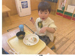
今日は"節"分X=ユ- 鬼さん"ご"飯"かわいいね♡