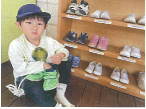
履き物を揃えて 園庭いってきませ!