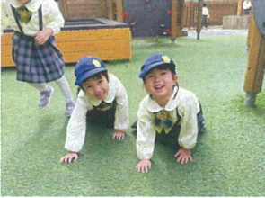
ちゅと休憩タイム