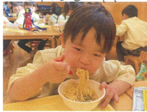
ラーメンってなんでこんなに美味しいのかな? みんなで食べると何倍も美味しいね♡♡