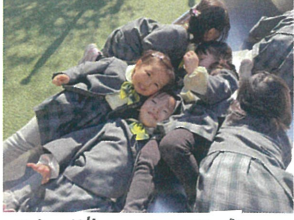
スライ"ド"の"上"が暖かい ので"ゴ"ロ~ん