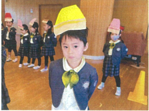
悲しい曲は悲しそうに 歌ってくれる姿も★