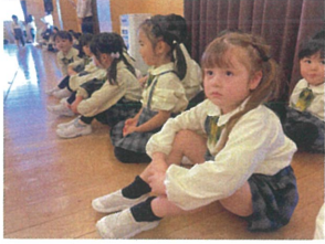
年長クラスの歌を 聞いてみんなが釘付け