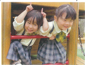
鬼はまじでー!? こにだよん