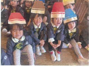
くれよんに"変身"が なっています(笑)