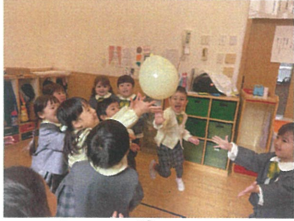
風船と落とさない ようにみんなが"頑張"り ました。友だちに"ま"~♡