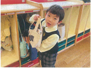
2人で中々 ごっこ遊び!いい笑顔