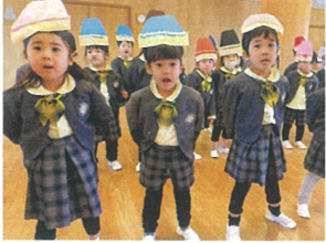
歌の姿勢が素敵 口も大きく開けていっぱい