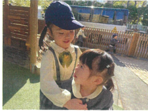
大好きな最年少クラスの お見送り。ま(=明日)~♪