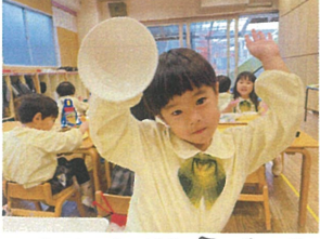
もう全部食べたよ びっくりン々