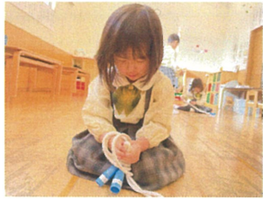
(ま)じめてのなれとび 結ばようになりたいな!!