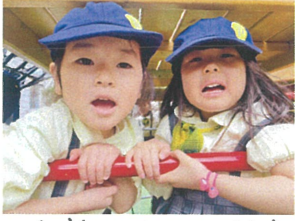
やっほー!! カメラにアピール♡