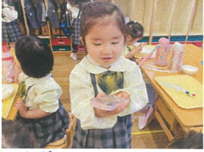
お箸セットのケースに シールがあるんデ!