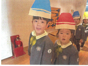
くれよんに"お"かき 3Fに行くときま"ま"~♡