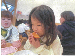
今日は"お"かき おかわりあるかな??