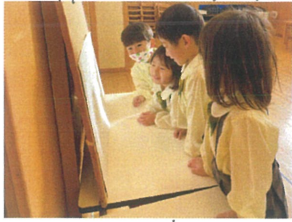
目(ま)心の窓!!! ボクもワタシも言えぬもん!!