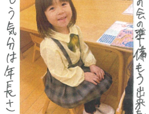
腰骨もピンと立って封