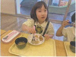
おにぎりの食べ方 次はどこ食べようかな?