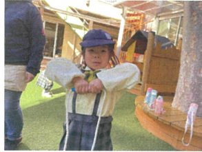
"な"わと"ひ"を初めて 使いました。やっ"ぱ"~♡