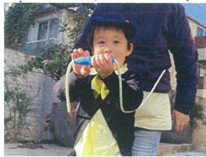
先生乗ってくださーい! 電車が通りまーす 三三