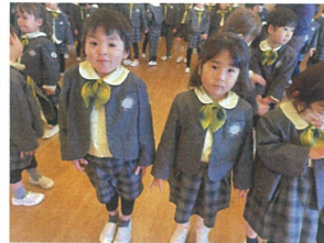
気づきの姿勢で から、こ良く待っています