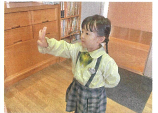
お誕生日おめでとう 4歳になりました