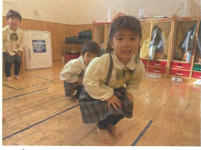
今日も1位取ると~!と ほ"ろ"きって"柔"軟体操して"頑"!