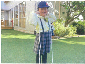
園庭に出て早速 なれとびで遊びました