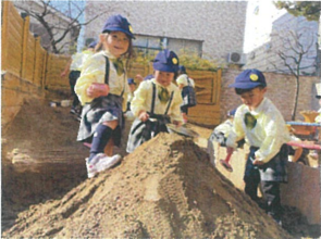
大きな砂の山が あると大興奮 ♪