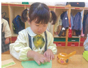
クレヨン帽子を自分たちで作っていきす♡ ハサミのりを使って愛情もたっぷり込めて♡