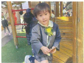
落ち葉を沢山集めて いろよん！ 楽しん！ 月