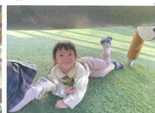
スライダーの下は、居心地が良いみたい