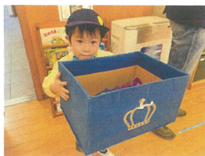
プレゼント運びの お手伝い♪ ありがとう♡