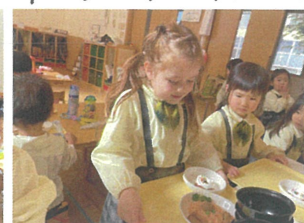
ごはんがクマにはてるよ