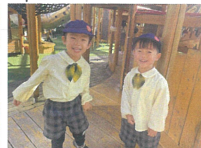
友だちと一緒に遊ぶの楽しい! 走る大好き仲良し2人組