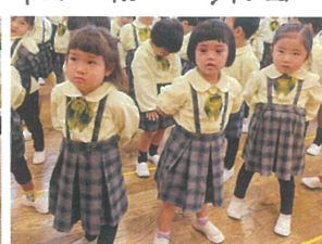
UTABUTA! に 向けて練習中♡