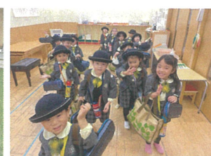
また来年会いましょうよ良いお年を。