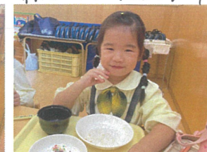
♡ドーナツ最高 系合食でした♪