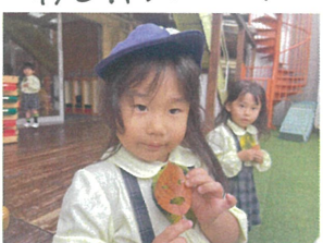
葉っぱに穴を空けて顔が出来ます！