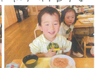
/こんたに! 食べちゃって! ♡