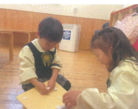
粘土のクッキーを友だちにどうを