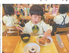
今日は最後の スペシャルメニュー♡