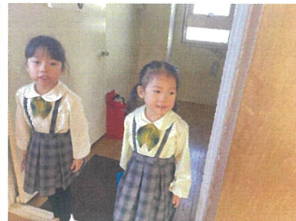
/おはようございます！元気に挨拶できています！