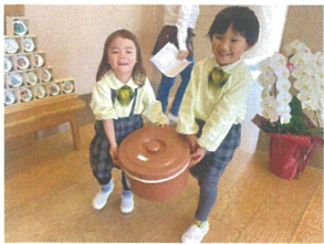
サンゴグラスから kitchen と一緒にぼろぼろ