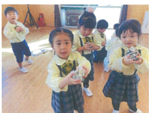
年少さんで集団あそび/ 新聞紙を丸めて…