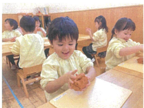
テラコッタ粘土でクリスマスキャンドル作り