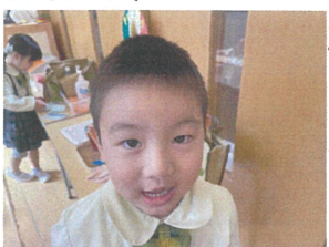
鼻に焼きドーナツのクローンを付けているよ