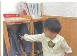
見て見て!! 友だちのボレロにボタンが掛かっている