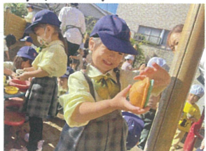
重ねてみると... ハンバーガーみたい!?