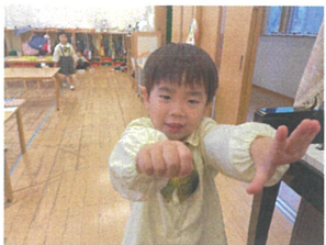
どちらの手に入ってるか!? 片手が開いているのでバババ