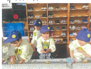
テラコッタを使って キャンドルスタンド作り