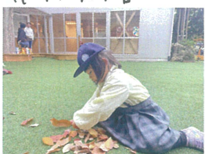
沢山の落ち葉の中からお気に入りの葉を選んで