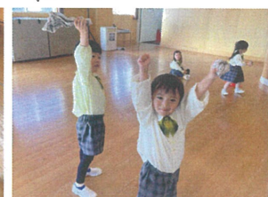
年少クラスで新聞紙ボールゲーム多頑張りよ！