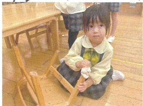
いつも使っている椅子も ゴシゴシピカピカにしよう