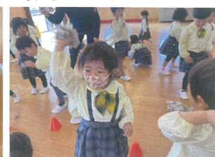
相手チームにボールを沢山入れたチームの勝ち