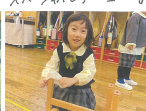
足の足をお掃除 キレイになっ♡