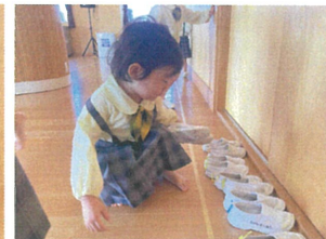
うわはきは、どこに置くか...考え中です。