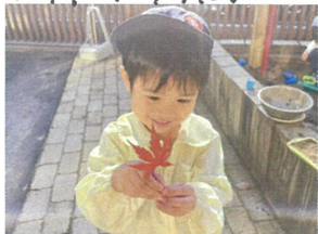
もみじ見つけて 嬉しいかな? キレイ