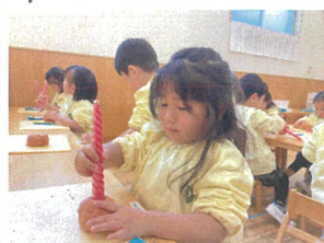
模様を付けて...キャンドルが立っかな??