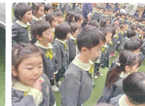
<終了式> 2学期が終わり みんな元気に登園して来よう