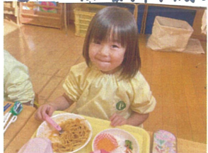
みんなで 沢山食バ子で"ン