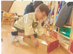
もうすぐ冬休み... お掃除頑張るぞ!!