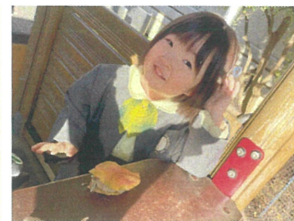
華やかな色をハンバーガー を作ったよ。いかにですか？