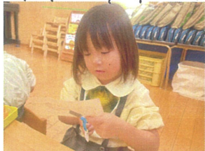
<ハサミのワ-ワ> 今回は動物園を完成 仕上げました。自由にはりかが残らないように切ったよ!!