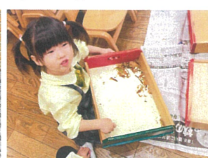
お家に持って帰る 予定の葉っぱが引き出しに(笑)