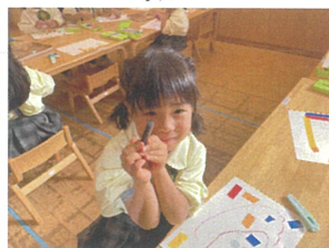
おニールとビニールテープとクレヨンを使って絵を描いたよ!