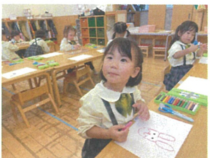
おニールの目のうさぎ