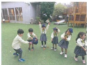
落ち葉を集めてせいの！パッ！