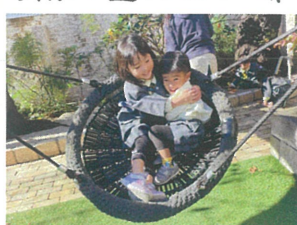
お友達とギューと 抱き合って嬉しそう!!