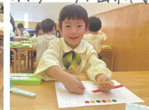
サーキットカード スタンプ見守ったよ!!