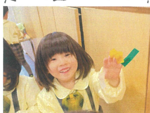
ビニールテープと丸シール/ クリスマスツリー描いて♡