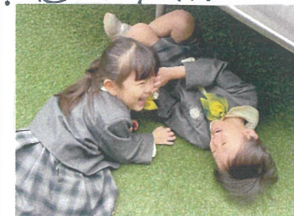
よし! 捕まえたぞ♡ 3学期も元気に登園して来よう