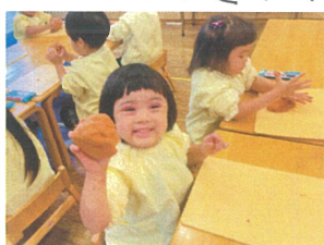
いつもの粘土よりも 冷たくて柔らかい♡