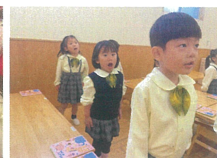
朝の会の音読も口をしっかりと動かしています