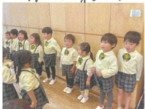
歌の姿勢や歌声が素敵 選ばれて前に出て来てくれました。