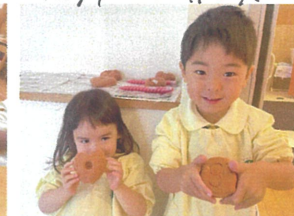
本番です!! 上手に出来たよ。