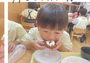
2学期最後の 系合食でした♪