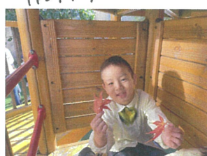
大きな紅葉もとても綺麗な色だね