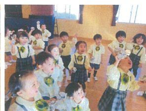
かんぱさぞ! おお~! みんないいお顔♡