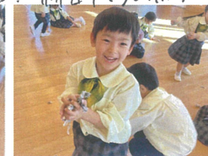
あそび"をしました。 相手チームと勝負!!!