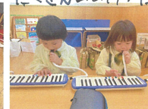
UTABUTAエのワジ 席どこになるかな〜