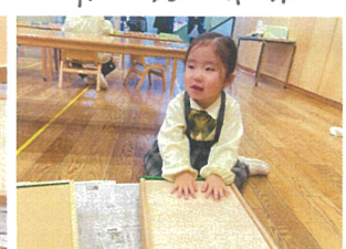
3学期もまたキレイに 使えるようお掃除