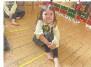
もうすぐ柔軟体操 始まりよ〜! っ