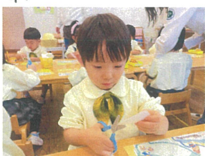
スモックから園服が 出ていると直してくれました!