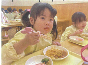
月 ミートス(ロブスター)の日 食バ子と美味いかな。