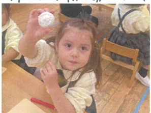
粘土バラを使って模様を付けたよ