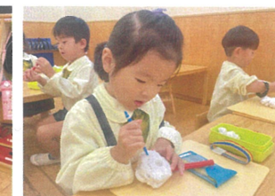
とても糸田から綺麗に 仕上がりましたよ！