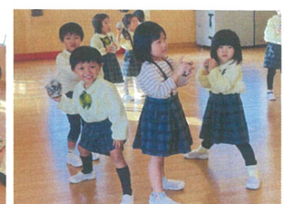
スタートの合図を わくわくしながら待ち☆