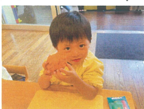
コネコネ…♪ どんな形にしようかな~