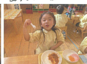
ミートソース、エスニック、