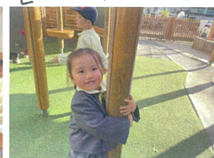
柱の周りをクルクル回って目が回る