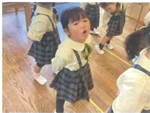
合同歌練習♪ 歌の姿勢キープ