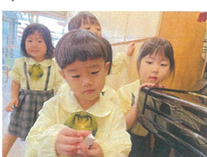
手が出るとかた〜♪ お友達もドキドキ…