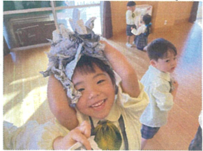
ゲームの後は、みんなでお片付け～♪