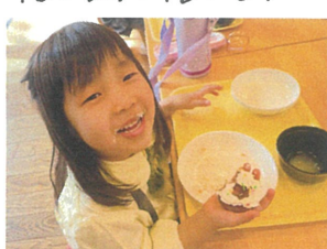
ホイップのおまげ♡ サンタさんみたい!