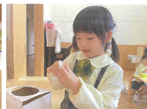
UTABUTAIの座席のくい引き中...ドキドキ