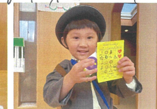
「かえりの合唱」 新しい曲にチャレンジ中!