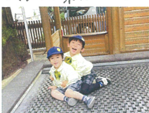
お友達とギューと 抱きしめて「フかまた♡」