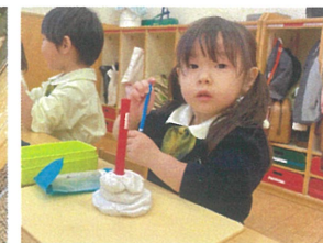
キャンドルスタンプ製作 練習中ですよ！X-BOX! 並んでいますよ〜