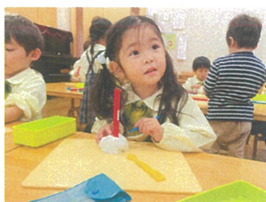
キャンドル作りの 練習をしてみました♡