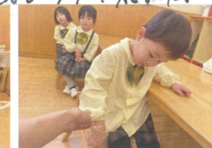
2学期最後の 系合食でした♪