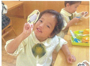
造りのあそび" 丸シールを使って何を作ろう?