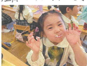
おいしくてお口の 中に入れすぎちゃった(笑)