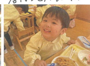
みんな口の周りには、オレンジのお汁が...