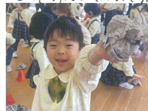
3クラス合同で集団 自分でボールを作って