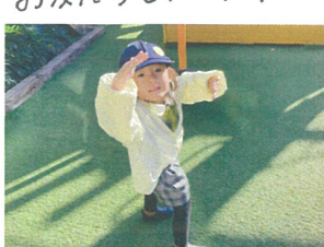
変身して色んな ポーズを見せてくれました♡