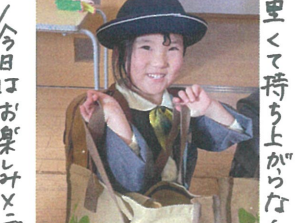
見ている以上に重いサック...