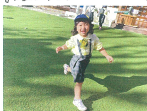
/先生もタッチするぞ!\ 走るのも速くなっ♡