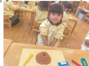
キャンドルスタンプ製作 山の形とハートの形