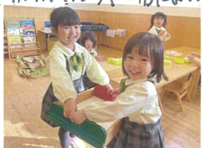
一斉に持ってあげて! 友だちの手助けするよ!