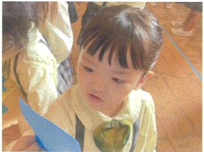
このカード、私ので合っているかな...??