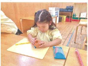
キャンドルが立っように形を作っていきます