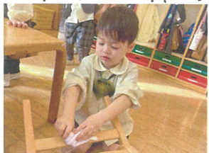
お掃除屋さんです 綺麗になりますように!