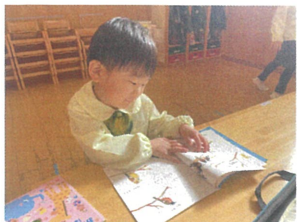
12月の絵本の鳥のページがお気に入り