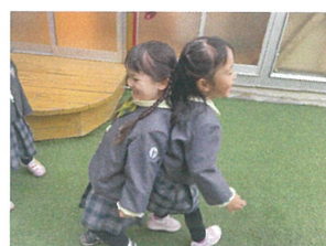
おしくらまんじゅうで身体を暖める作業