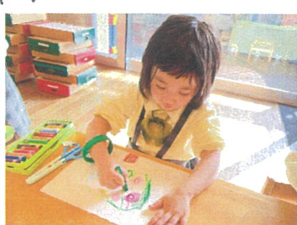
/ぞきたよ! トロス! 描きたいものを上手に表現してくれています♡