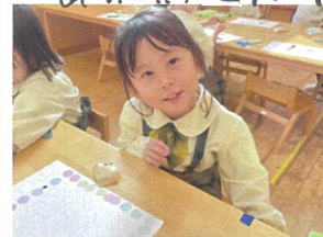
11月ママのお家を作ったよ。たくさん目を作ったよ。