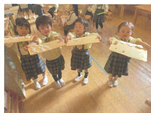
みんな粘土のお菓子作。たよ！いたできます！