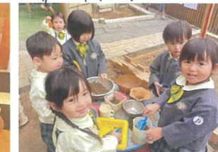
気付くとサンゴグラス 大集合していました!!