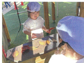
葉っぱのケタイ屋さんです♪ 「今ならおまけシールつきです♡」