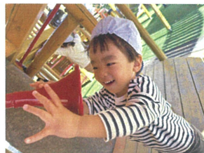
「お〜い」ボクの声 届いてますか〜？