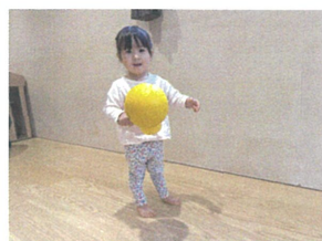
「おっとと...」あれ? よく見ると... 身体で支えている!? 笑