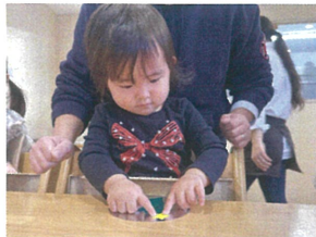
ツリーの一番上にペタッ☆ 上手に貼れたかな〜？