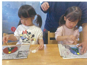
綿棒にボンドをつけてチョン☆ どこにしようかな〜♪