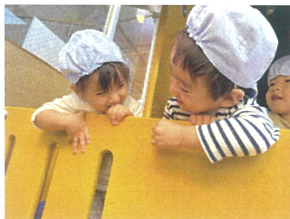
「ばあ♪」顔を見合わせて にっこり笑顔♡