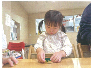
とても集中して貼っています♪ 頑張ってる〜♡