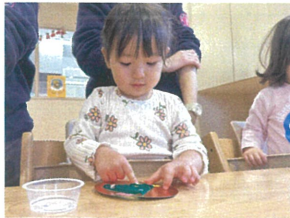
ボンドの上にスパicolを 貼っていきます☆キラキラ〜♡