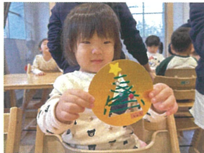
クリスマスツリーの完成♡ とても素敵にできました ☆