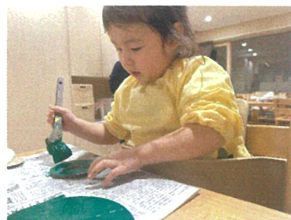
こちらもクリスマスの製作で 絵の具を塗っています♪ モミの木をイメージして内側から外側へ 上手に塗れたね♡