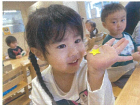
両面テープの紙をはがしたら 「あれ!?手についちゃった〜」