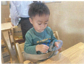
クリスマス製作で『縫い取り』に初めてチャレンジ☆ とても真剣に穴に針を通してあります♪ドキドキ