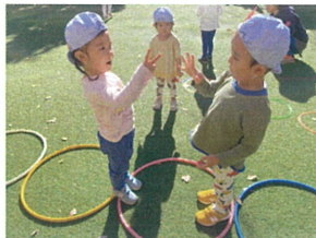
ドーンジャンケンポン♪ どっちが勝ったかな!?