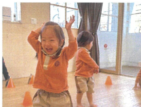
ピョンピョンにっこり笑顔で うさぎさんに変身☆