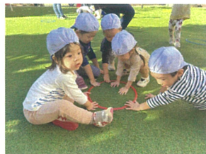
「あが〜」の声でスタート♡ 赤いフラフープ見つけた♡