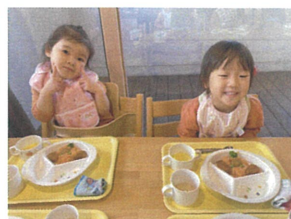
今日はスペシャルメニュー♡ 動物の顔のご飯に大喜び☆