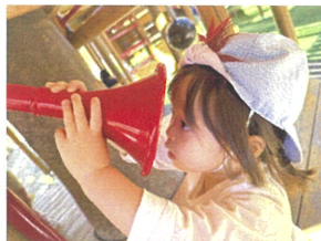
真剣にのぞいています♪ 何が見えたかな??