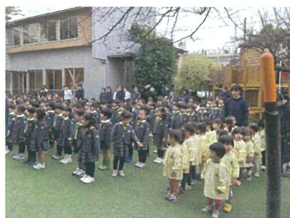
幼稚園の終業式と一緒に 参加♪ 上手に並んでいます☆