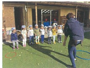
初めての色おににワクワク♪ 「いろいろいろいろ何のいろ？」