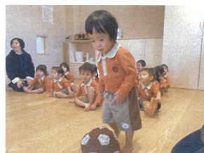
サッカーボールを蹴って 止まった所の動物に変身♪