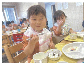
デザートはクリームが乗った 焼きドーナツ♡おいしい〜♡