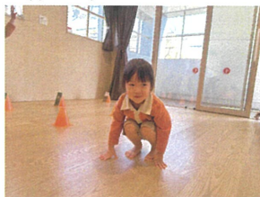
「グログログロ〜」こちらは カエルさんです♪頑張ってる♡