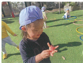
もみじの葉を手の平に乗せて 「おててみた〜い♡」