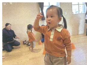
「ぱお〜ん♪」 どうさんになりかけています☆