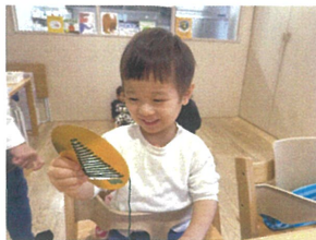
全て通し終わるとツリーに♡ にっこり 素敵な笑顔 ☆