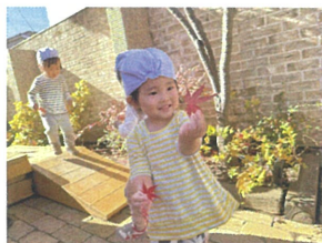
真赤なキレイなもみじ探し 「先生あったよ〜☆」