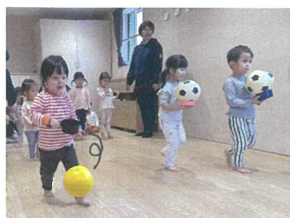
フライングを使ってボール運び♪ 落とさないようにそ〜と