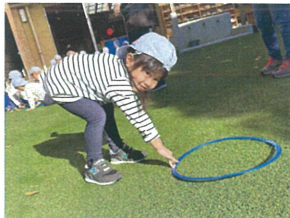
今度のお題は「あお〜」 これで合ってるかな〜？