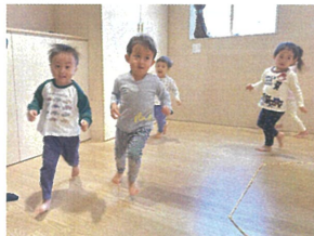
かけこヨ〜イスタート☆ いちにいち頑張ってる〜♡