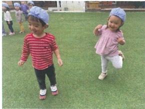
片足あげてケンケン練習？ 「あってきた〜♡」嬉しくて♡