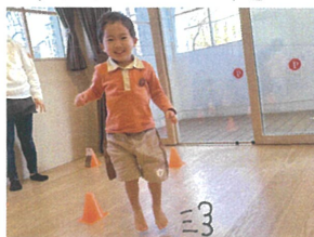
何に変身しているでしょう?? 答えはうさぎさんです♡