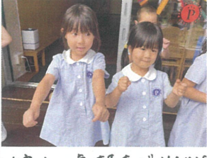
仲直りの気持ちMAXに! メロルも一着に着ている気分