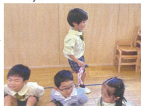
「どこに置くかな?」 「ハカチ落としと行いまよ」