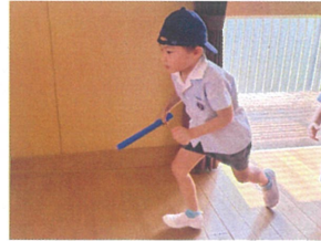
「バトンとアーカーまで 撃つために全カタンシュ=3」