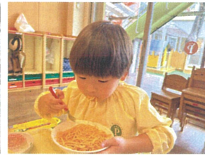
モリモリ食べると → こんなお口に っ