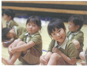
FESTA ありがとう ございました!