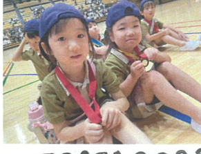
FESTA 2023 よく元氣張りました♡ 園長先生からメダルを頂きました♡