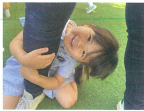
先生にくっついて... ニッコ 😊