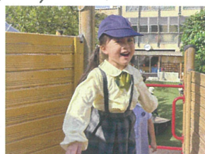
「葉っぱを持って」 「帰ってね」