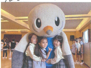
「ゆーとくと一緒に」 「嬉しそうて可♡」