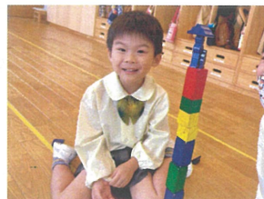
「見てー高く」 積んだよ♡