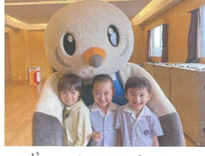
ギョーとしてもらい この笑顔です♡