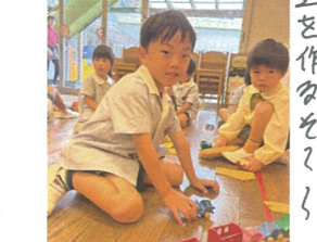
道を作るぞ〜 電車を並べて!