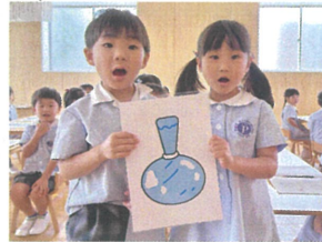
「ヒエヒエのツボゲット」 次は何のツボかな?