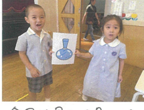
今回は早めに見つける ことができた♡