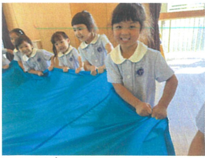
パラバルーンの練習が 色々な技を行いました