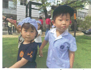
カワイイ妹とハピヤリ! "またあそびね〜"