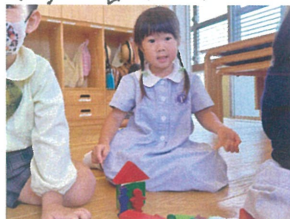
「おじいちゃん おばあちゃんの家だよ」