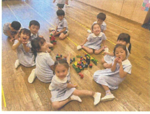
みんなで話し合いながら お城を作っていました♡