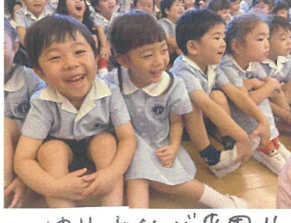
ゆりーくんが来園!! 大盛り上がりです♡