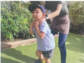
先生と一緒に 電車ごっこ楽しい♡