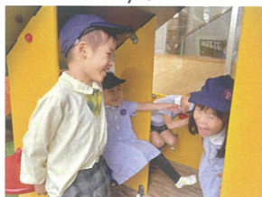
「四人家族は」 「全員赤ちゃんて可(笑)」