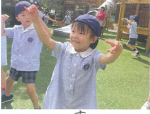
年長さんの真似っこ。 ソーラン節の様子がすく