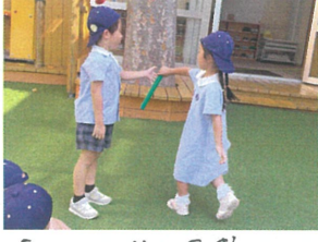
「はいっ!!」戸惑い たがうちも成功しました!