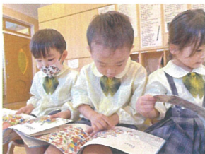
10月の月の絵本を読めば 一生懸命数えていまよ♡