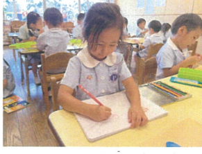
ににににしよから描いて いるのはアフリカです♡