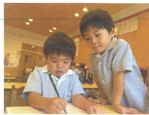
お友だちの絵に 興味津々です!