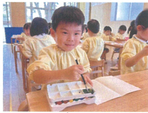
「青と黄色を混ぜたら 緑になっよ」