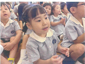
興味津々で話を 聞いていまよ♡