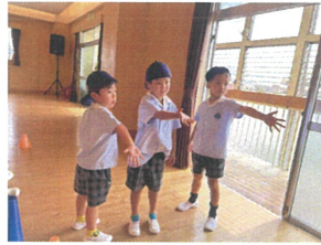
3クラス合同で リレーの練習もほめた!