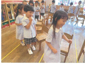
椅子取りゲーム♪ とても白熱しています!!