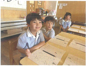
お話がとっても面白く、 夢中になっていました