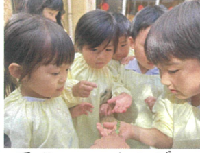
園庭にカマキリが 遊びにきてくれました