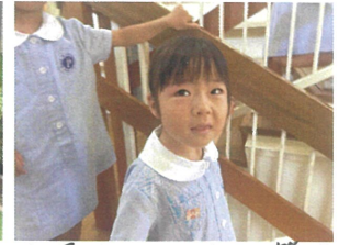
年長クラスのソーラン節を 見に行ってきました