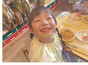
お口におひげが できちゃった♡