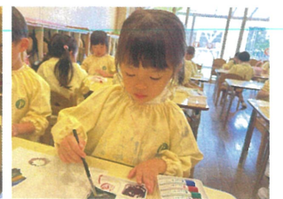
造形あそびで、 デカルコマニーをしました