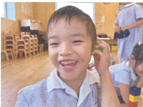
「もしもーし」 聞こえますか?