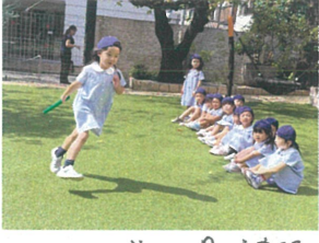
リレーのバトンパス練習。 お友だちにパスできるかな!?