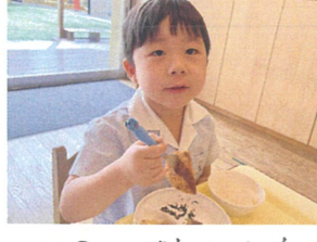
メシヤカツおいしいっ! おかわりしようかな〜♡