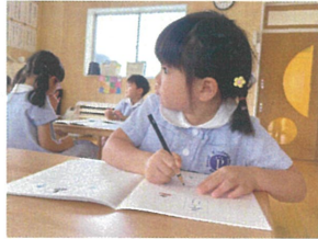
映像を見ながら 丁寧に書きまよ♡