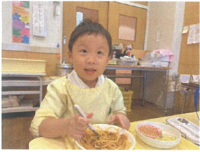
ナーナーにクルクルと 巻いて多オシヤレ!