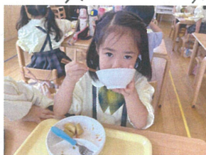
「お茶碗をしっかりと」 「キレイに食べまよ♡」