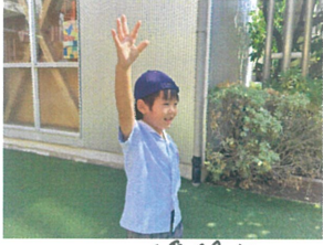
リレーの練習中!! "OOちゃん!こっちよー"