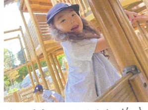
12階97までくるね!! おかわりしようかな〜♡