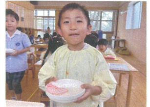
「ピョカピョカ 食べたいよー」