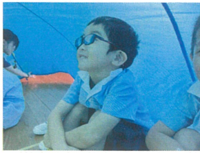
パラバルーンの中に 入って楽しそう♡