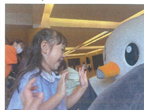
タッチをしてゲームを しもらいました!