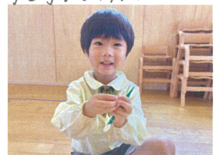
「へびを作っている」 途中でそくまよ♡