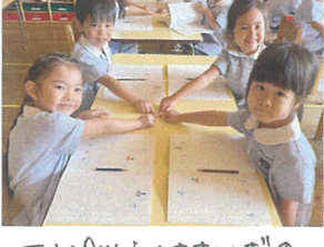
エシロツくささいす♡ いっしょにパワーを身に着けて!!