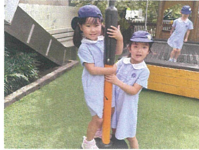
順番に回して 楽しんでいまよ♡