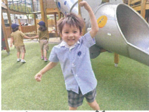
園庭遊びの際に 「ジャンボリミッキー」のダンス