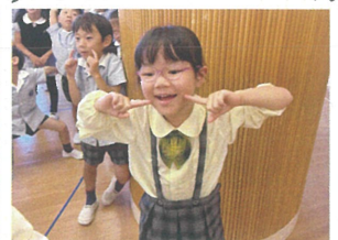
「ゆーとくと一緒にダンス」