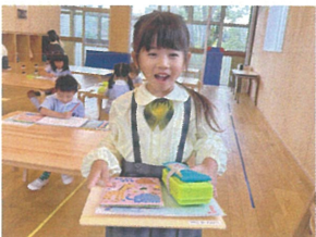
「全部まとめて」 持って来たよ♡