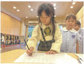
久しぶりの席替えは あやたかじで行いました