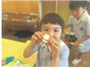
/何を作りました? 丸が変身するよ〜