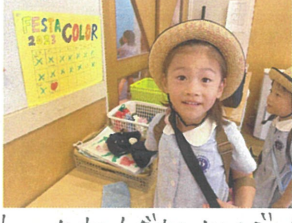
カウントダウンレジャー! FESTA2023...お一日♡