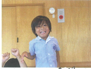
玉入れの練習では4回中4回1位!! 練習ばかりを使いすぎたかもしれませんね... (笑)