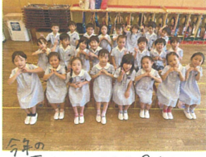
今年の 夏服はそろそろ見納め。 ちおっぴり寂しいなあ...