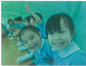
パラバルーンの中に入るときの二の呼吸の練習♪ 一瞬で緑の世界に変わった!!と大喜び♡