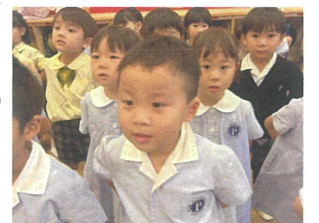
メダルをパクリ(笑) 歌える曲が増えてきました