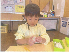
こねこね... てんてん、 小さなピザ作り中でした!