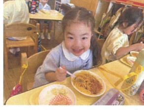
スロウゲテをフォークで くるくる巻いて食べてみる?