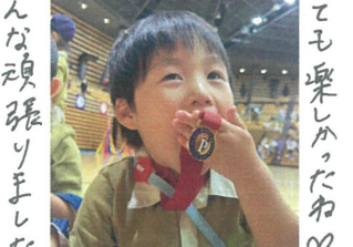
みんな頑張りました!