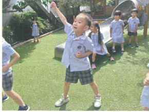
年長クラスのソーラン節を 後ろで一緒に真似、子供