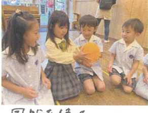
風船を使って 火暴引ゲームをしました!!