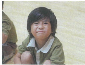
少し緊張しているぞ...