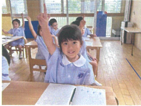
魔法をかける準備は いつでもバッチリ♡