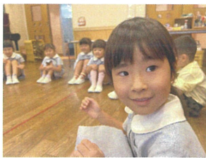
真似っこゲームを して遊びました