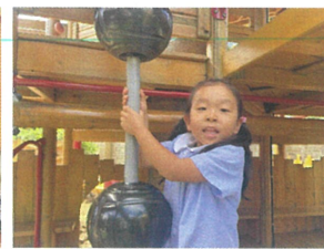
/ここから登れるように なったよ〜\