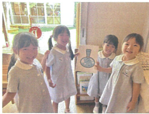
またまたツボを ゲットです!