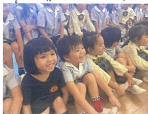
ゆりーとくんが 遊びに来てくれました