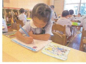
ハンカチの糸金木を 描いてみよう♪