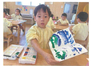
「開いたら同じ柄!? 不思議だね♡」