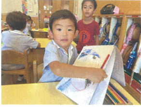
FESTAの絵を 挿絵にしました