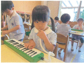
丁寧に息を入れると 大きい音が出るんだよ♪