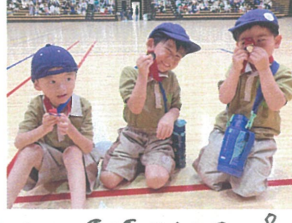
「わたはなせんせい だいすきだよ」 嬉しいメッセージありがとう♡