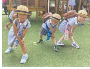
降園前にソーラン節が 始まり、しっかり構えています!