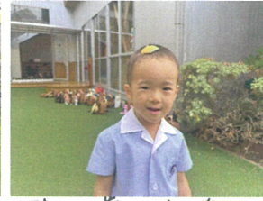
頭に葉っぱを乗せて、 ドロンと変身!?