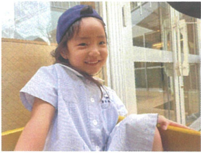
お家の中でつろぎ中〜 お邪魔しました♡