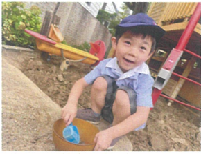
「お料理をしてくるよ」 楽しみにしててね♡