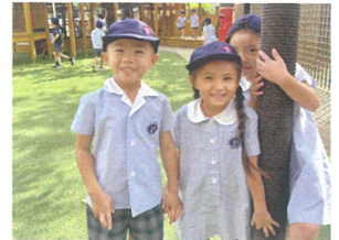
「一緒に遊ぼう」 手を撃って仲良し♡