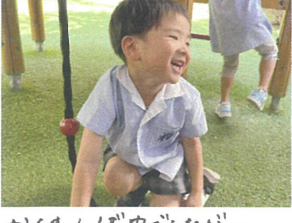
かくれんぼ中でしたが... すぐに見つかった♡