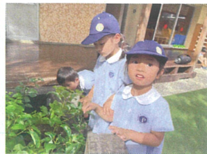
とっても大きな イモムシを発見!!