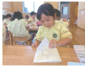
「どんな柄になるのか ワクワクしながら開きまよ」