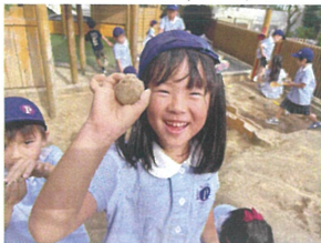
「お団子だよ」 キレイにできたでしょ?