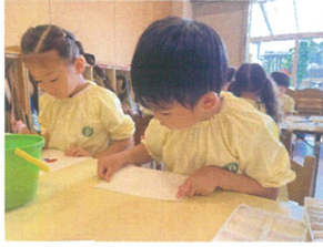
造形 あそび♡ 今回は、デカルコマニー★