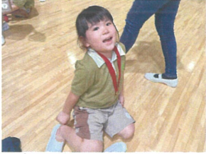
「またらいわんも くるからね♡」