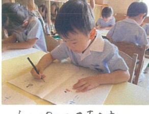
えんわつの手持ち方 はなまる♡です!!