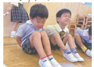
「どこに落ちるのか」 「ドキドキしながら待つまよ」