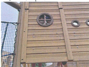
「私たちはどこに」 「居るでしゅか?」