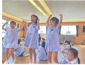
年長クラスのカッコイイ姿に目がキラキラ 一緒になってソーラン節を踊っていました