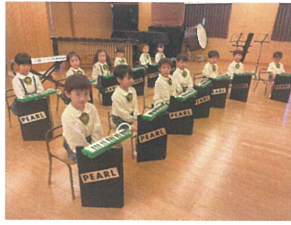
年中は金鍵盤1-2エカの向かい角度まで手前えま!!