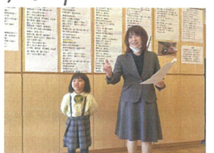
お手本に選ばれる ました☺