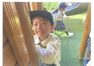
2階に行くと遊ぶ ところですよ! いっぱい楽しめ〜