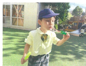
しゃべん玉、うまく吹けるかな? 太陽の光でキラキラしてきれいだね♡