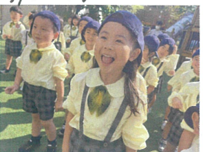
集団あそびで、 猛獣の習い事やりました