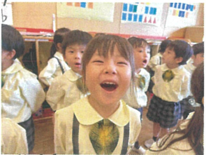
笑音声がとても素敵 良い声でした☺