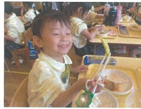
青のリポソトが長くてびっくり!!