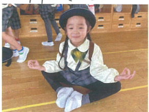
／ヨカのポーズだよ～