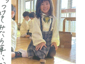
／勢いをつけて、また車になりま