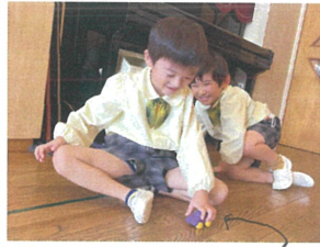
おざいストロドで車を走らせていました♡