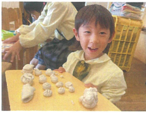
パンはしかがでずん? \ 色々な種類のパンがあふよ