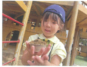
ごはん山盛りです! どうぞ召し上がれ〜