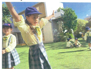
側転の練習です! できるかな??