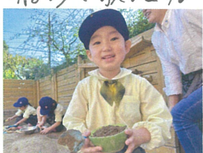
／ス～フと作ったから、食べてね