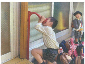
／もしもし聞こえま