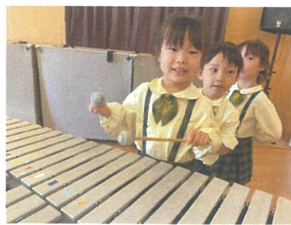
すべての楽器の中から自分が演奏したいものを選びたいよ!