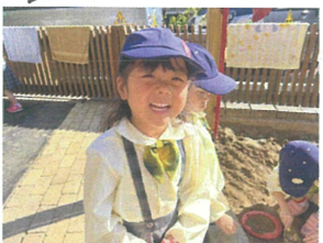
砂場遊びも 楽しそうだよ!!