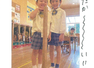
積み木タワーですよ♡