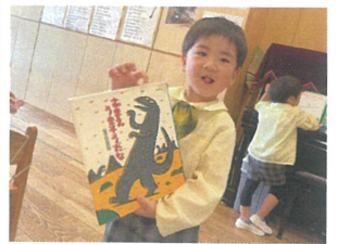
最近お気に入りのシリーズです♡