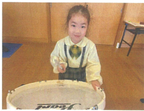
初めての3階系練習。楽器がたたくとわくわく♡