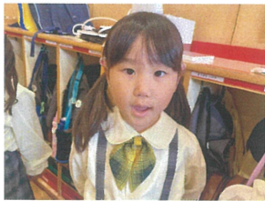
／目と口をしっかり開けて表情までバッチリ