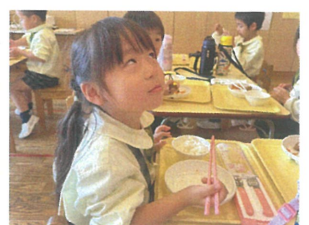
変顔中ですが とてもカワイイ〜♡