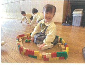
ブロックでお家を作ってくろぎ中です♡