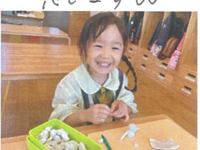
／雪だるまだよ、もぐもぐで