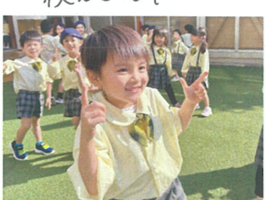
／集団あそびで、もぐもぐ狩りを行いました