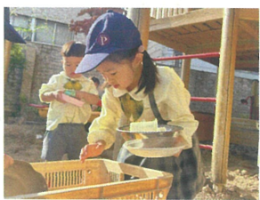
／道具とたくさん持ってお料理の準備