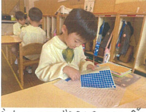
たいんよくできましたスラングを目標して、日々丁寧にシリーズを見つけています!