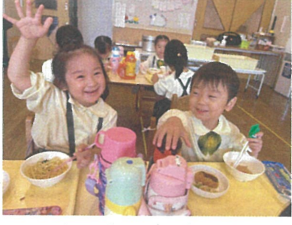
水筒を飲んだり話し合っている中良い2人系♡