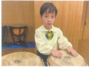
／コンカはふうとにたくと良い音が出ます