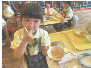
ハンバーグをごはん にかけて丼がツクぞ