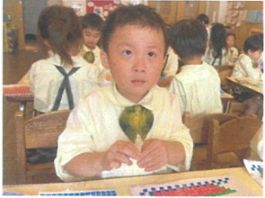
シール遊びをしている ところですよ。キレイに...