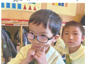
／口角を上げて明るい声で歌います