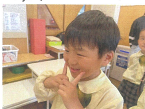
ニコニコのお顔で 歌えたらgood!!