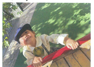
こんなところに先生を 発見!! 嬉しい〜