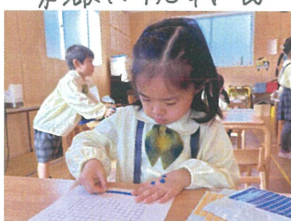
／シールあそびが新しくなりました