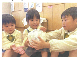
好きな爆弾ゲーム! 気に入って...