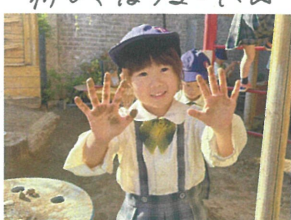
／見て、手がこんなに汚れた