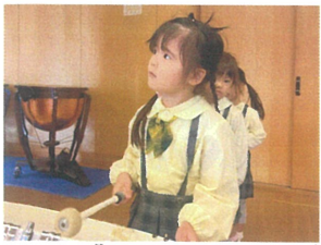
大木 鼓にケレレンジの 目線のバツケリです