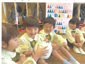
めんぼがトゴ一い 爆発したよ! 爆発したよ!