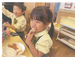
大きい口でパワッ としても美味しいね