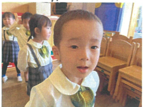
一生懸命声を出して くれていましたぞ