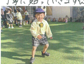
／鬼にタッチされないように逃げま