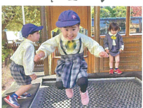
／全力でジャンプして楽しそ