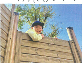
／上からの熱い視線を感じます