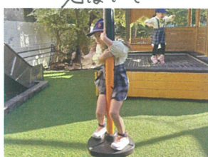
／勢いをつけて回ります