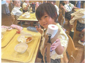
水筒が新しく なっています♪