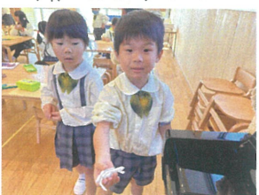
／粘土でクラリネットを作ったそで