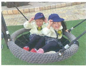
／風でクラスキャップが飛んじゅよ～