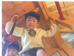
“こっちにおいで” 待っているよ〜