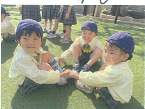
ろ人グループでした お話を聞いてバツケリ