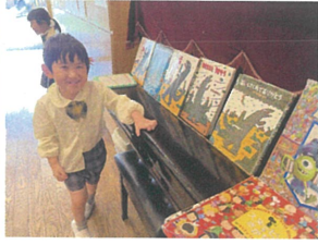
おまうまそくだはシリーズが大好きで、5冊も並べました(笑)