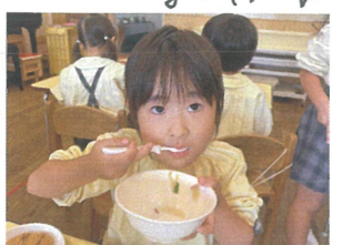
うどんを沢山食べた よ