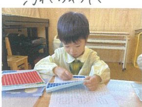
／姿勢を整えて丁寧に貼っています