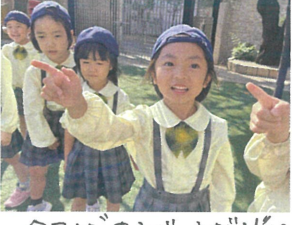
今回はもうじゃりかりに挑戦しました! \ すぐにルールを覚え、楽しみましたよ「ボンゴ」の3人組♡