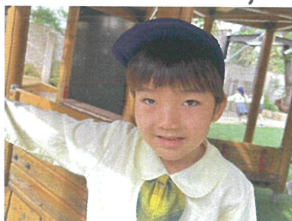
何して遊ぶほうが 考え中だよ...