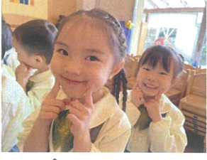
まのこを上げると明るい声が出るんだよ♡