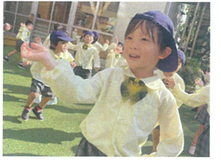
年中全員で集めたあそび♡