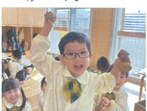
／必殺技を使えるんだ