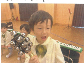
色んな楽器を めんぼでケレレンジ