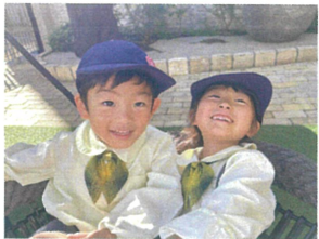
仲良しの2人♡ とても楽しそうに遊ぶ