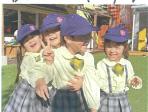
めんぼがトゴ一い カワイイですよ