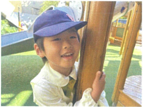
鬼ごっこをしつと 声をかけてくれましたに☺