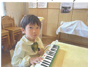
鍵盤ハーモニカの 自主練習中だよ