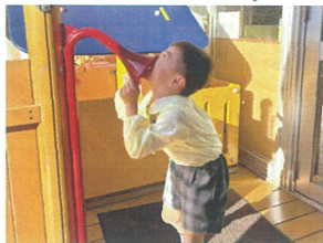
／聞こえますよ、それはどうですか？