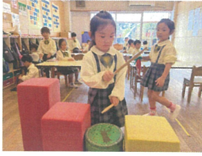
Vacationではドラムを使用します♪ クラスでもやっていますよ