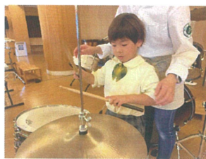
考えながら叩いて いるようです!