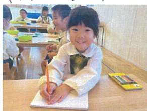
／まだアイシヨたから見ないで