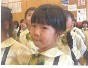
合同歌集練習♪ この日は子どもたちの声がいっしょに出ていて上手に歌っていました♡