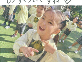
／もぐもぐがバりにい