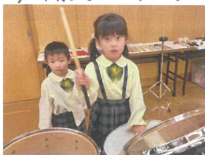
／自分のやってみたい楽器に挑戦