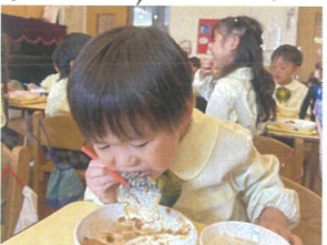
豪快にバクバク 沢山食べてね