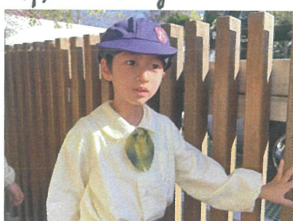
トンボがどこかに いったよ...