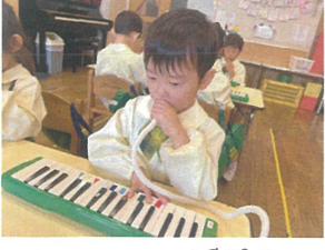
Vacationの練習を少しずつ進めています♪