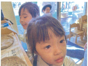
黒火薬の色が、 白くなっている〜☺