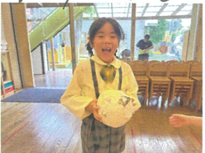
優勝はOOちゃん おめでとうございます