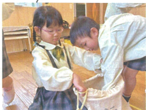
／みんなで協力して最後までお片付け