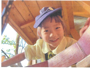
わ〜! ここだよ!! \ とてもびっくり!! (笑)