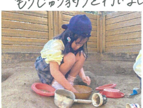
／ピクニックに行くためにお弁当作り