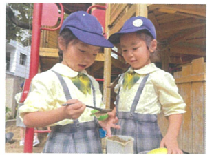
2人で話し合っているから一緒に料理中ですよ!