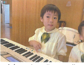
Vacationではキーボードを2台使用するので触ってみれば、ボタンを押すと音色が変わることにびっくり♡