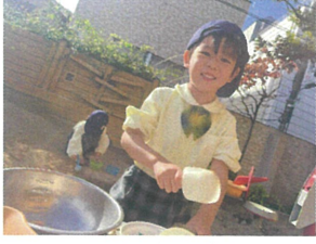
ケーキ作り中ですよ。チョコレートケーキください!!