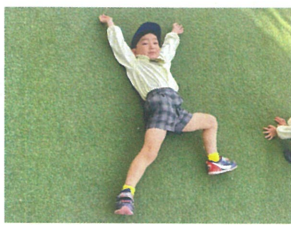
／柔かい芝生の上でゴローン