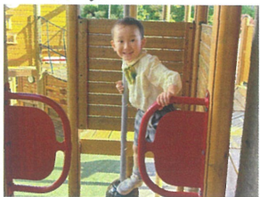
／先に下に降りているよ～