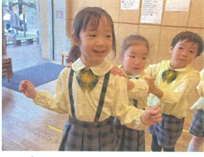
全てのじゃんけんには勝利しました! おめでとう♡