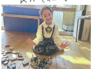
／たくさん動物を並べてみた