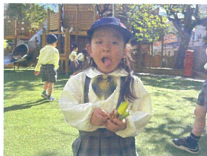
葉っぱを集めて いろいろ遊ぶぞ