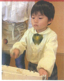
真実な姿が素敵です