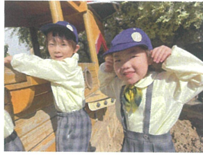
シラ邊先生! 一緒に虫探しに行こう!!