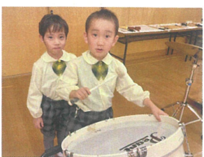
／しっかりと先生の目を見て叩きま