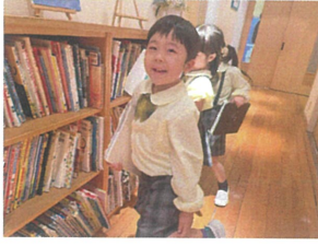
糸本がたたくとわくわく♡ 迷っちゃったよあ...♡