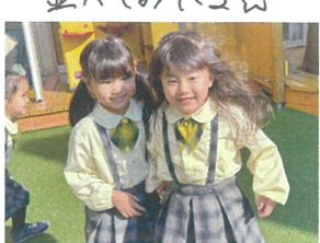
／あと2人入れるところありますか？