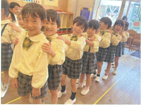
ひさびさりのじゃんけん列車のルールは覚えているかな?