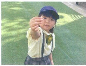
／こんなにちっちゃいのと見つけたよ