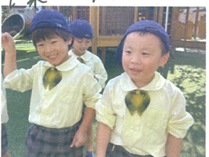
次は何人グルー プのかき〜??