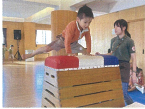
しっかりと手をついて バッチリで☆