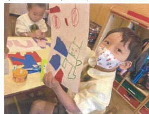
これはおばけだよ! 夜におどろかす動かしちゃう♡