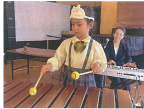
マリンバでひげじいさん。 良い音が出ました♡