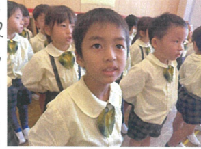
歌の姿勢もカッコイイ お腹から声を出して