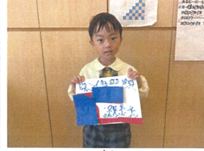
クレヨンを使って 描きました