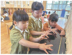
ピアノの上で ピアノの練習中☆