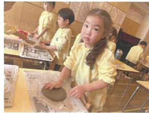
窯焼きの季節♪ トントロキます!!