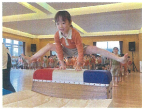
サーキット★ 今回は 学年全員で行いました!