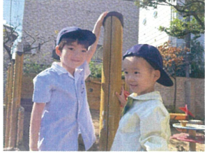
1便のお友だちに 手を振っていました