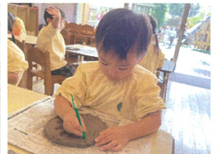
模様を付けて完成!! 昨年より上手にできたね♡