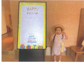
Happy Birthday!! すてきな1年にしてね♡