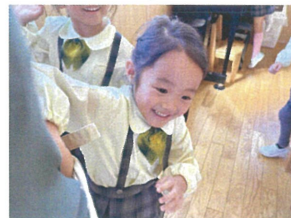
先生のポケットに 入ってるかな？