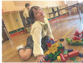
シムレラ城の完成!! ここに住むのよあ〜