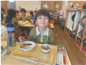
サーキットで頑張れるように たくさん食べるぞ〜