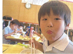
／みんな大好きうどん とても美味しいね