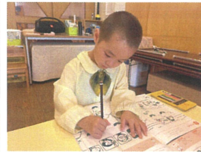
せんどのワーク本のりもの" 真、直ぐの線を描きます!