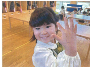
ニコちゃんマーク 可愛いでしょ？