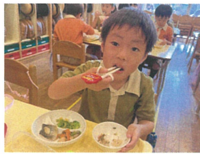
左手できちんとお腕を 押さえていて◎です♡