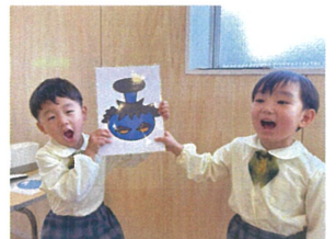
なかなか見つからず 全員で探しました☆