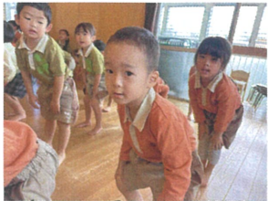
学年合同サーキットを 行いました！1・2・3・4・5 レジャリ仲ははて