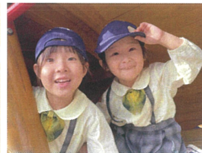
しらいせませ〜!! 火焼きも屋さんだそうなの♡