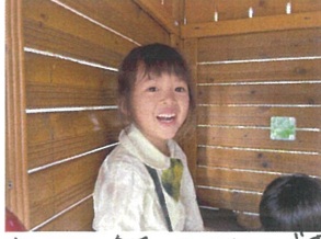
ネコの飼育も楽しんでいます ごっこ遊びゲーム中