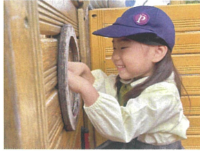
この窓からは 何が見えるかな？