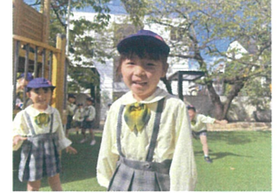
2便のお友だちの お迎えに行くそうです!