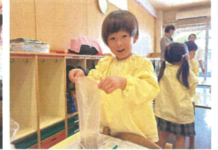
窯焼き Stant ワクワクしていました