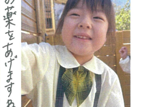
「お菓子をあげますねー」 お友達と楽しんでいます