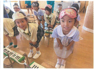
音あそび♪ 手は... 月泰と月泰!!