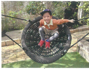
もっと高く してくださーい！