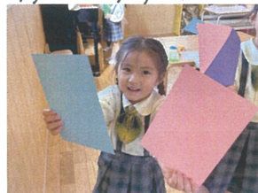
水色とピンクの 2色に☆