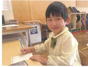
お誕生日会の招待状。 いを込めてかきました♡