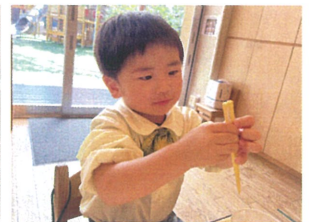
お箸の左右の長さを 比べています(笑)