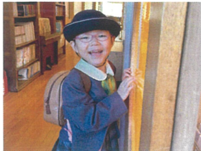
バレちゃった☆ テラッと見てまた☆