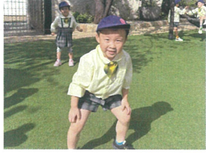
／だるまさんがころんだー