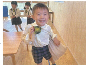
おもちゃの袋で サンタマンみている☆