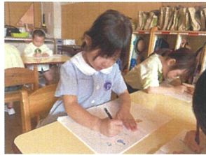
エンソツえくささいが" ら"が難しかったにね♡