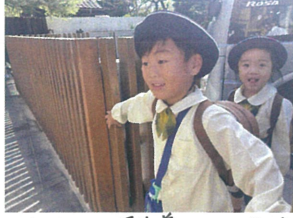
バスが到着しました☆ 今日も元気いっぱい