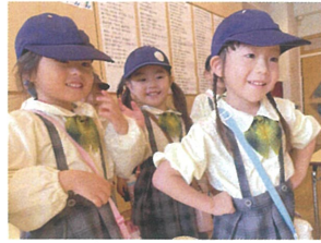
音楽に合わせて... Let's dance♪