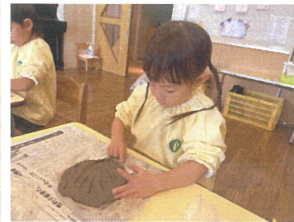
手形を取ったらお皿の ひらを作った...