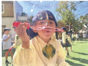
フー 大きなしゃぼん玉☆