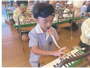
高速スピードの ひげじいさん♪