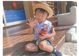
お誕生日当日の朝☆ 5歳になりましたよ★