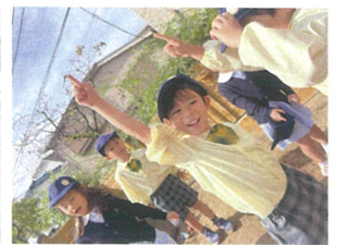
指にとんぼが 止まりました〜★