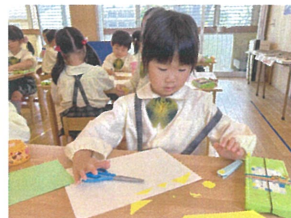
画用紙を切って さて何になるかな？