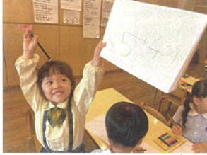
／5+431 はなんだ? 数字も上手です