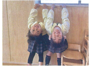
世界がさかさまに なってる☆