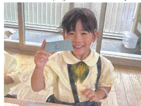
三角を描いたら ヨットみたくに☆