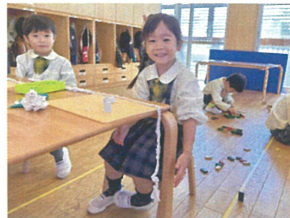
床につくぐらい長く のはりました☆