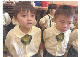
真剣な表情で 合同歌練習☆