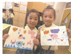
2人で おそろい!! の 作品にできました♡