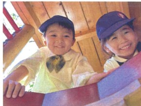
上から可愛く のぞいてました☆