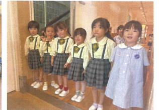
給食の後はみんなでお れを伝えます!