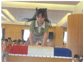
全力でダッシュを 踏べるかな!?