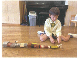
どうぶりの積り木を 種類ごとに整列♡