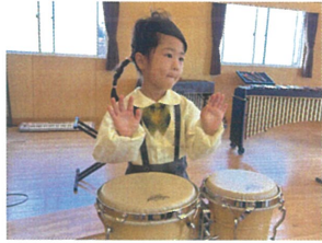
ボンゴにチャレンジ!! とんぼ音がすまかたよ〜?