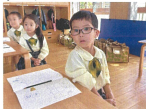
E=ピツえくさかいすの 映像に夢中☆