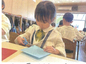
2枚の画用紙が何に 変身あるかな〜