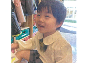
／サーキット終わるぞ〜