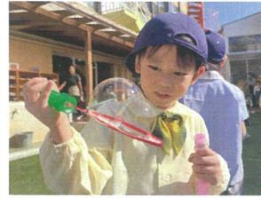
しゃべん玉がくっついて 雪だま汁みたいになりました!