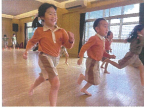
今回は学年でサーキットを 行いました☆