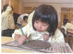
点でデザインを入れて いきます。丁寧に...