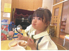
“早くリンゴを食べたいなあ” 口の中にいっぱい入れておね ね