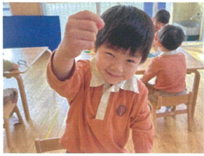
この小さいの 見える？