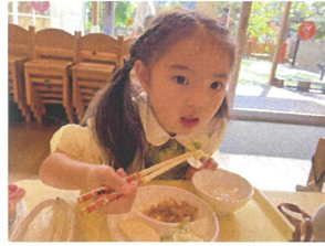
お姉さんのお箸よ♡ 元貝紙に使っています!!