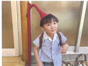
ステキな 帽子でしょ☆