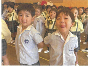
合同歌練習♪ 良い声と言われこの笑顔◎