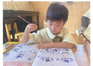
スタートの丸と 探しています☆