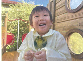
病院ごっこ中です