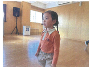
一生懸命に取り組んで / おはよりのゲーム♡ くれたので挨拶をお願いした☆ 朝からうれしいね