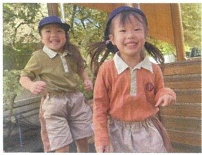
お友だちとタイミングを 合わせて JUMP!!