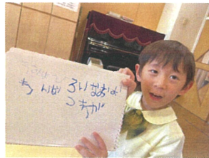
うけ"の歌の歌詞を 書いてました!