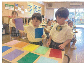
画用紙屋さんでーす! 何色にしようかな〜?