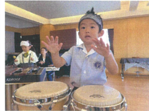
ボンゴにチャレンジ☆ 先生を見る姿がgood