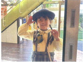
／おはようございます☆ 笑顔で挨拶、素直です