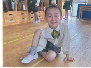
帰る前にホッと 一息...