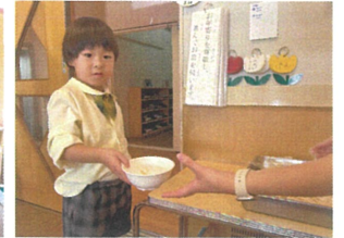
うどんのおかわりも たくさん貰っていました