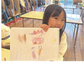
ケーキの絵をかいても 上手で美味しそうです