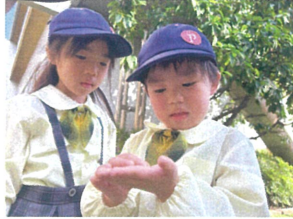
小さいダンゴムシを 発見したようです