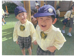
これから鬼ごっこです!! / 見〜つけた!! / / 中良しの輪がなっています♡ / 3人も見つかりました♡