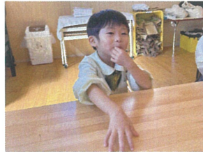
音舞台の曲を発表したら 自分のやりたい 楽器を演奏するフリを していました☆