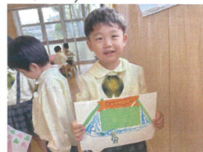
ネットを作って みたく☆