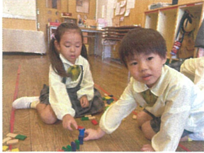
お友だちと一緒に(3人) ゆっくり... 気をつけて...