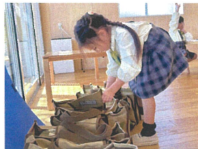
全部のサブバックを見て ツボを探しました☆