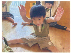
サーキットの前には しっかり柔軟体操☆