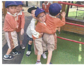
グーッ みんなで連船☆