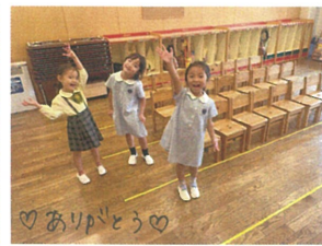
3人で全員分の椅子を 並べてくれてました!