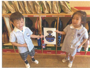
ちのてけ布めの!? ツボをゲット〜!!