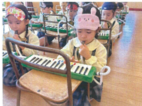
姿勢を整えて ピアノを弾きまわす☆