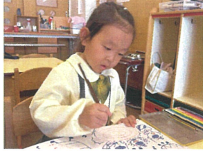
せんわーく! 太鼓を 描きました。クルクル