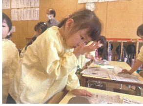
ん!?! 117もの粘土と 匂いが違うぞ〜