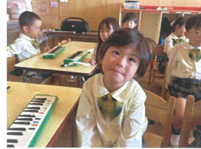
ピアノの鍵盤も お友達と楽しんでいます