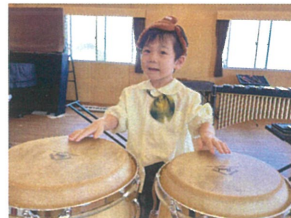
音あそびで様々な楽器に 触れてみました☆ ちよび緊張している表情も 見られました☆