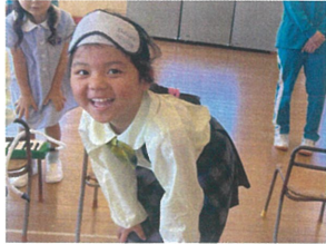
楽しみにしていた 音もびよ、リリリです〜