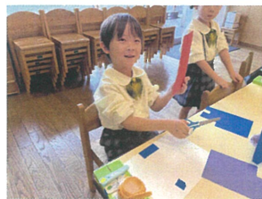
赤を先に切るよ〜! 何を作るか迷っちゃう♡