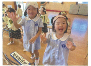
お尻ツツツッ ダンスタイム♡