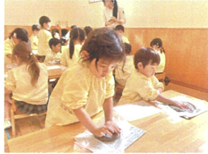
お皿の形になる ように広げていきます