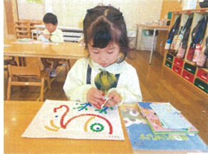
シールあそびでも机の上が整って素敵☆