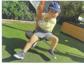
はくは外向きでも 乗れちゃうよ。🍌