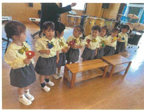
初めてハンドベルに 挑戦しました。🎵