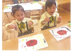
クレヨンで絵を描いて もっと可愛いにしちゃおう