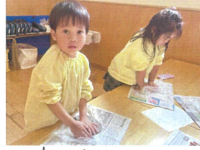
窯火焼きチャレンジ 土米占土いももの米占土違う!?