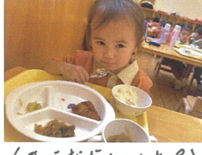
大きな口でパクッ!! ご飯粒を食べています。🍌