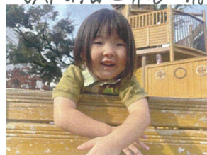
先生見つけた! ヤッホー!