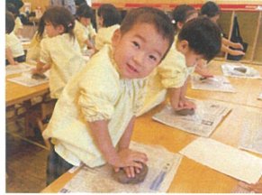
手に付いたら! なんか泥みたいだね