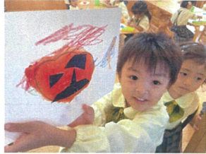
ハロウィンの製作で かぼちゃのおぼけを作った!