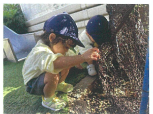
ダンゴムシさんよ どこにいるかな?!