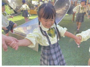
か〜ごめかごめ! 後ろの正面は誰かな〜?