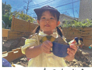
コーヒー淹れたから 飲んでくださーい。🍌