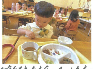
リレーのバスでは ぐっすりです。🍌