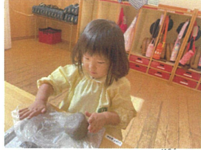
窯焼き土粘土は 柔らかくて冷た