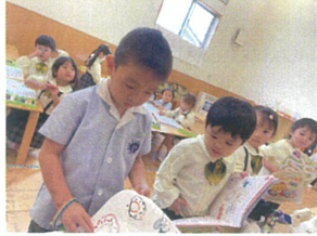
せんわくで插いた ドーナツを見せ合っています