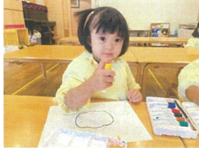
かぼちゃのオレンジ色を自分で作ってもいいよ!