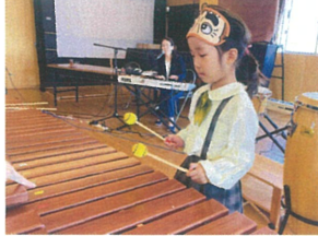
鍵盤の音に合わせて『マリンバ』に挑戦