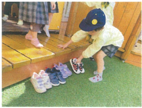
お友だちの分の履き物も揃えてお手伝い