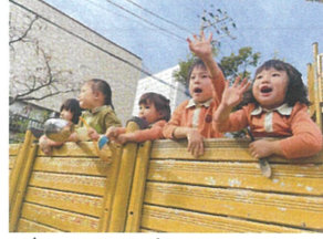
バスのお友だちをお見送り。また明日ね!