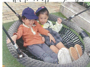
友だちと一緒に 楽しさ2倍♡