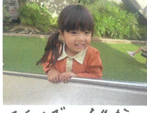
スライダー、言えか 滑ってくるかな?!