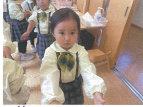
整列するのが上手に なりました