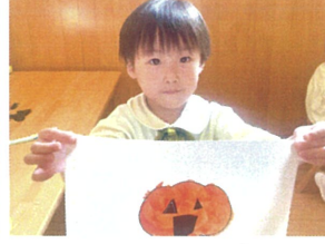
造形あそび「ハロウィン」 可愛いお顔の完成!