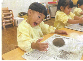
土粘土って冷たい! こんど色なんでも