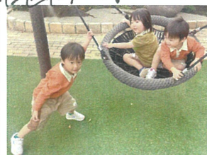
ボウがやてあげろ! そん〜!!