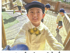
砂場でくじら を見つけたよ。🍌