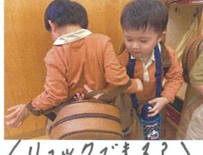
リレーできる? \n 友だちのお手伝い。🍌