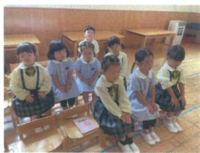
朝の会を始める 準備万端