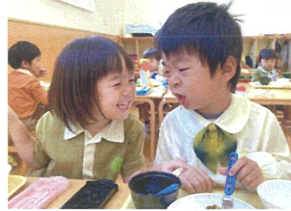
一緒にお糸画 元気が長そ〜!!