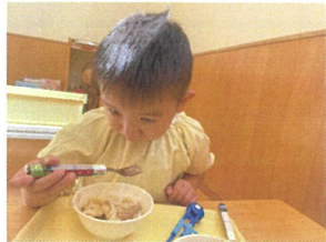
うどんを吸うのは真剣...