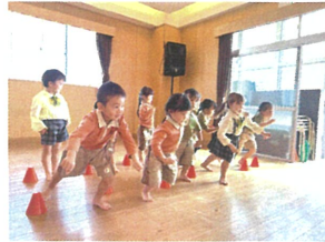
1位になると! とい 気持ちが姿勢から伝わる