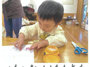
のりの使い方はバッチリ。🍌