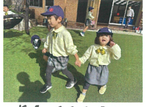
年長クラスのお兄さん、 お姉さん、大好き♡