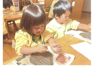
午休みの周りに オリジナルデザイン♡