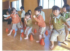
クラスよりサーキット 位置についてよー!!