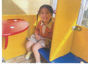
みつけた! 小さな家で発見!!