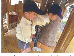
園庭でもお姉ちゃんを 一緒♡愛です。🍌