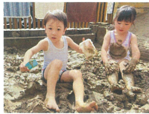
もう座ちゃんー。 なんか変な感じ...