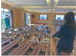
川崎先生の話を しっかり聞いてから...