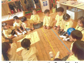
集団遊び「爆弾ゲーム」 ミュージックスタート!