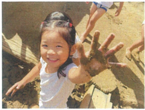
見てみて～!! 手がドロドロだよ～