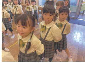
歌の姿勢がバッチリ