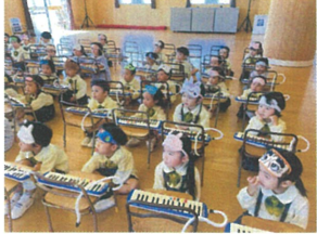
初めての見る楽器に興味律々