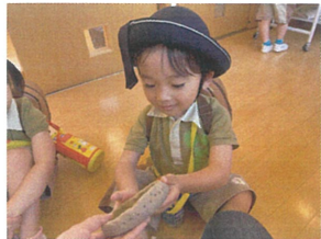
お皿が固まってきた 色もよんがかわ