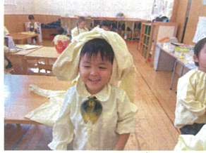
スモックが帽子に はってしまいました