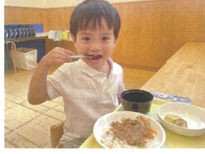
「美味し〜!!」 何度も言っていました!