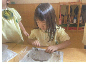
フチも自分たちで 作りま