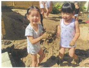
大きな泥だんご 作れるかな?