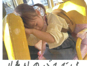
リレーのバスでは ぐっすりです。🍌