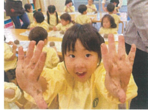
大好きなトランポリンで高くジャンプ!!!