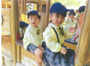
大きなハンドルを持って出発進行