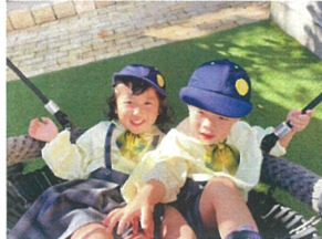
今日も高くしてー! くりがゴスイングも大人気