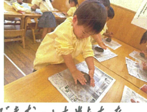
月におかしいよ、 照れていました。🍌