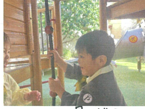
く〜く〜混ぜて こぼんを作っている