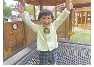
高く高く もっと高く♡