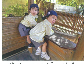
かわいいおしりを 発見しました。🍌