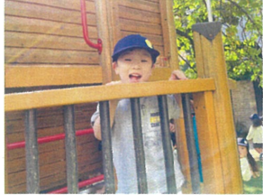
やっほー!!! 元気いっぱいの声