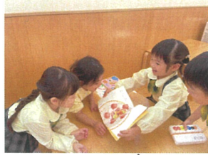
1ヶキとウと!! いたはきまーす