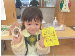
スナックが貯まると 頑張りました