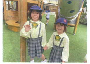
お母さん発見!! うわらうわら2ショット♡