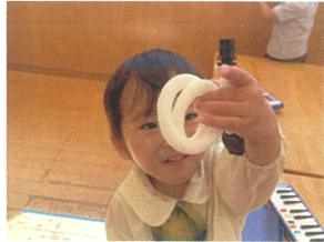
録盤のホースを ドーナツみたいにして