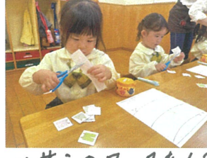
ハサミのワークを行いました! 持ち方を丁寧に教えています。🍌