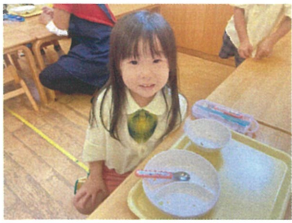
なんど!! 完食出来たよ! 先生の一緒に頑張ったね!