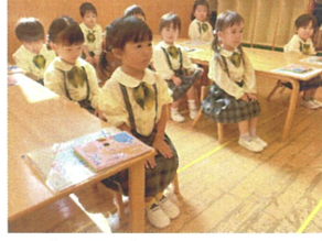
朝の会が始まります。 足を揃え目線も揃えよう