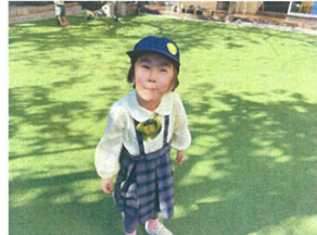
「このまえね...」とおしゃべりタイム