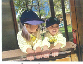
仲良しな2人お いっしょに遊ぶよ。🍌