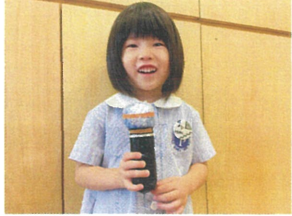
お誕生日インタビュー 好きな食べ物は...