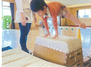
足を広げて大ジャンプ! もう少しで踏べそう