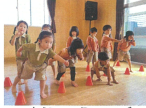
本気の姿勢です! 快生も本気で応援します!