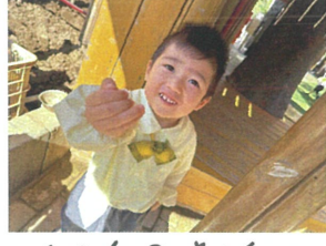
この手の中に 何が隠れているかな?!