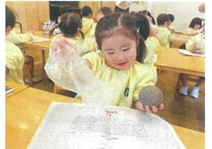
〈窯焼き〉土粘土も出して始めるよ