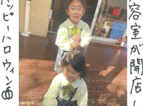
美容室が開店して ハッピーロウエン