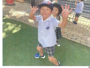
ガオ〜! 食べちゃうぞ? 足がととも速いのですね