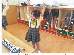
剣道盤ハモニカ楽しい! 先生と真似のタイム