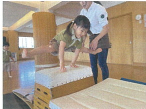
跳び箱に挑戦! 片足の開き方が Good