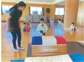
特別に挑戦 とても楽しかったです