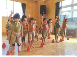
一番を目指して名乗って水玉。頑張り口