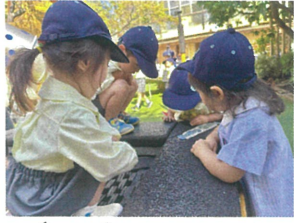
トランポリンの上にも ダンゴムシ...発見中!