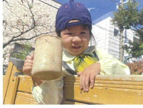
コーヒーはいかが? 夢中で作っていました