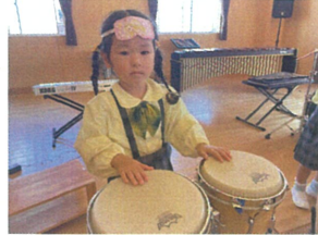
コンガは端、こも叩くといい音が出るよ