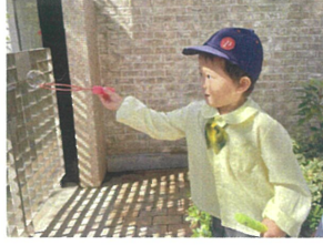
しやぼん玉チャレンジ キレイだな♡