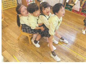
最近のブームとにかく仲良しです♡