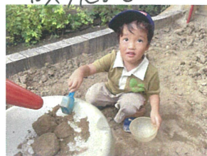
大きな団まり おつけた!