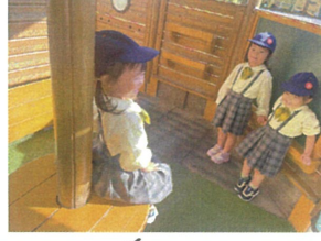
3人集まって... 朝の会ごっこ中