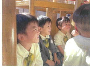
朝の会ころこ中... 良い表情です