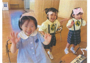
音に合わせて手とお尻もフリフリ♡