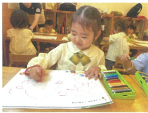
たくさんシャボン玉を 描いちゃおう。🍌