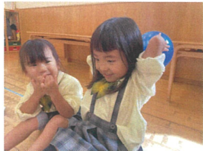
みんなで爆弾ゲーム ボールを素早く回して