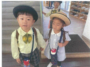
仲良しな2人で 手を繋いでさめはら