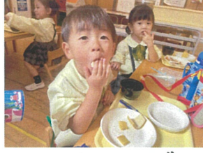
バナナをひとりで... 100%♡