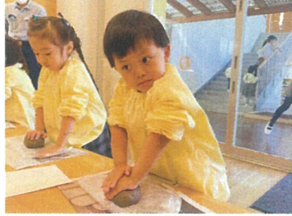
パワーがまだ足りないので、全体重をかけて丸く広げてもらいました