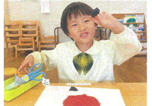
僕はこんな型だよ! 好きなように作ってみよう!