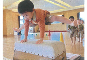
跳び箱に初チャレンジ