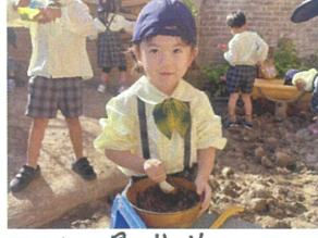
ごぼろ混ぜて美味に炒め 園庭遊び