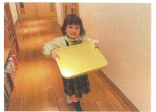
素敵だったので、お手伝いをお願いしました☆