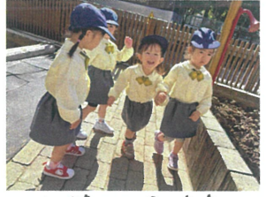
手を繋いで仲良く お散歩。🍌