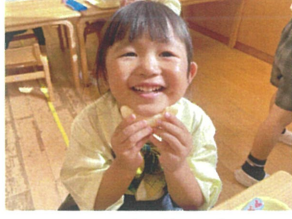
りんごをあごヒビタコ! とてもキュートです♡