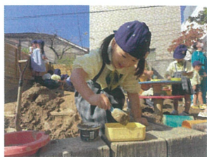
チョコアイスクリームの 専門店です