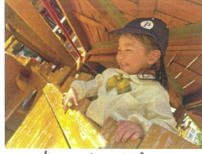
高い所から お友だちを見よう。🍌