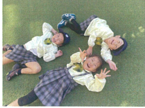
ゴローンとしながら おしゃべりしていました