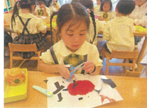
目と口をハサミで切って... どうしようかな?