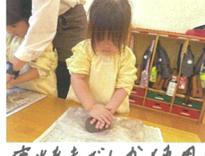
窯焼きでしか使用できない土 を使って、世界に1つのお皿を作りました。🍌