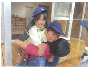
倒れちゃうも 定員オーバーです