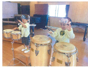
ボンゴとコンガ 何だか良い音がするよ