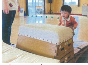
踏むの気持ちかとても伝わってくる!!