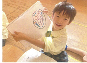
お顔画いたんだよ お糸画楽しかったね