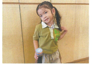
今日お誕生日なんだ!