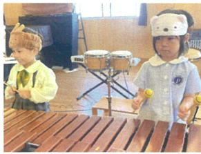
みんなの前に出して緊張 したけど... 楽しかったよ!!