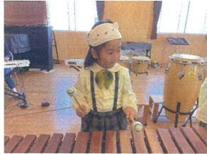
マリニバに桃草や 2人で演奏しました