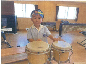
次はボンゴ!! フチの部分を叩くよ!