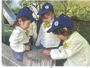
こっちでもダンゴムシ(笑) ゲーム到来しています!!