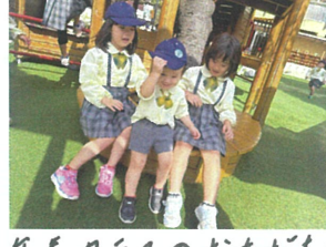
年長クラスのお友だちに 囲まれています!!