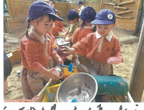
砂場は使ったら 必ずお片付け。🍌