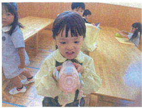
新しい水筒には ユニコーンがいのの〜!!