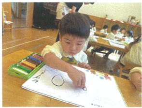
糸糸のワークで "まる"を描きました。🍌