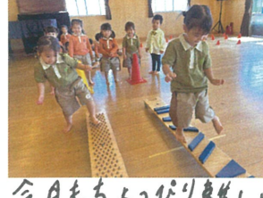
今月もちよびり楽しい 平均台に挑戦。🍌