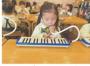
どんどん上手に音が揃くとキレイだね