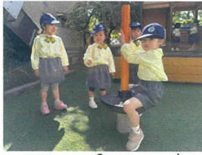
ローリングボールは 1人ずつ見番だよ。🍌