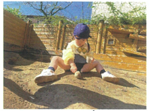
お料理に夢中... 真剣デスネ。🍌