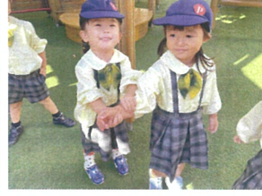
一緒にあそび 楽しいなあ