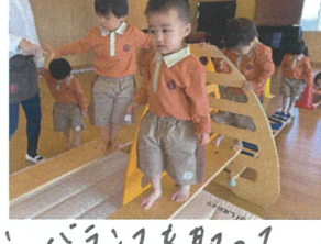
バランスを取って 渡ります。🍌