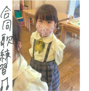
合同歌練習 素敵な歌の姿勢