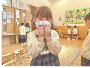
粘土でおひげを作 サタサンの完成