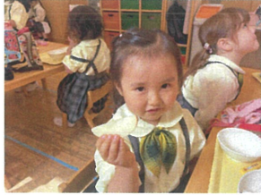
今日の果物はりんご でして秋だね