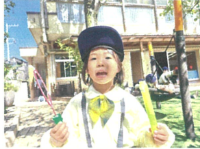
しゃぼん玉は上手く 飛ばせたかたは??