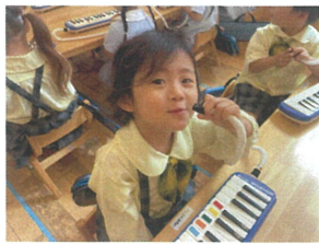
ホースは左手で持て 高さしめたためよ