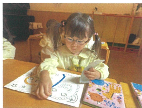
シル遊ばはゆっくり 丁寧にしています!!