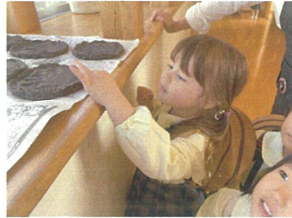
固まっているかな...? あ...! まだ柔らかい