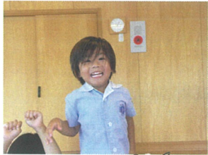
玉入れの実習では4回中4回1位に 練習いれを使いすぎたかもしれませんね... (笑)