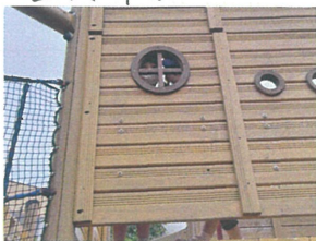
「私たちはどこに」 居るでしゅか?