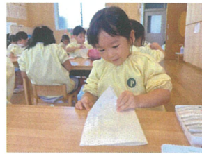
「どんな柄になるのか」 ワクワクしながら開きまよ