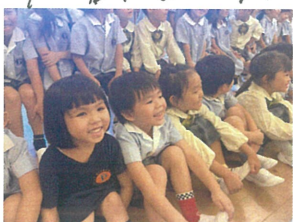
ゆりーとくんが 遊びに来てくれました