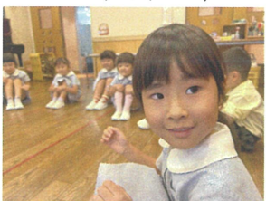
真似っこゲームを して遊びました