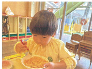
モリモリ食べると → こんなお口に