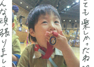
みんな頑張りました とても楽しかったね