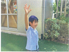
リレーの実習中!! "00ちゃん!こちらよー"