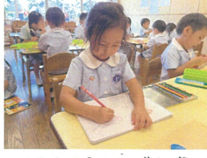
ににににしよから描いて いるのはフウリ地です♡