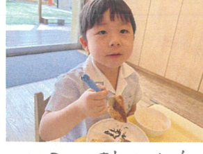
メシがカツおいっ!! おかわりしようかな♡