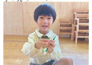
へびと作っている 途中でそくまよ