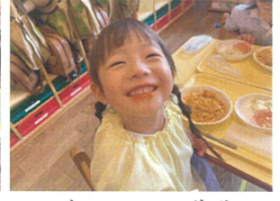
お口におひげが できちゃった♡