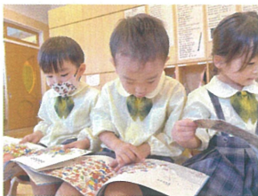
10月の月の絵本をみんなで 一生懸命数えていますよ