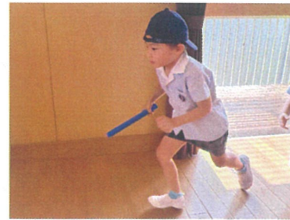
ボタンをアーカーまで 繋ぐために全カダッシュ3