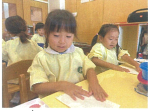
ノギューとして... キレイにできかたキキウ