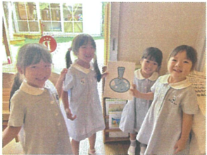
またまたツボを ゲットです