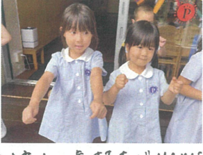
仲直りの気持ちMAXに! マイカールも一緒に抱えている気分よ FESTA2023... あひ日♡