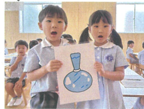
「ヒエヒエのツボゲット」 次は何のツボかな?