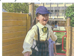
「葉っぱ」を持ってくから 待ってね