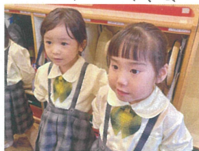
合同歌練習も集中して 行いますよ