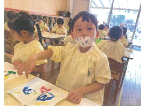
片方にだけ絵を描いて折り、また開くと...?? お顔みだいに変わった! 丸が増えたよ!!