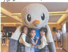
「カーとくん」にキューとして 嬉しそう♡