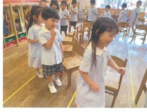
椅子取りゲーム♪ とても白熱しています!!