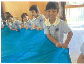
パラバルーンの実習が 色々な技を行いました