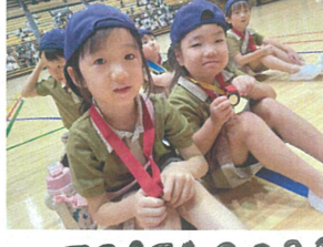
FESTA 2023 よく元氣張りました♡ 園長先生からメダルを頂きました♡★