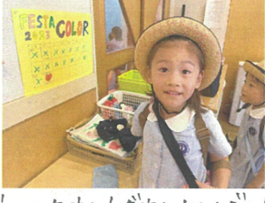
カウントダウンカレンダー! FESTA2023... あひ日♡