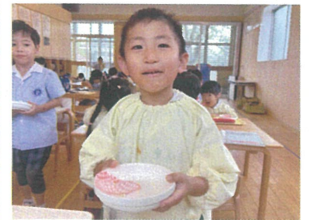
「ピョカピョカ」 食べたいよー