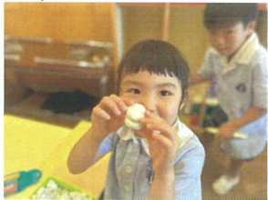
何を作かして?!\n丸が受身するよ〜