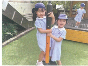
順番に回して 楽しんでますよ