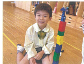
「見てー高く」 積みだよ☆