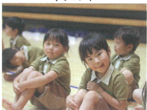
FESTA ありがとう ございました