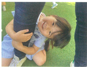
先生にくっついて... ニッコ 😊