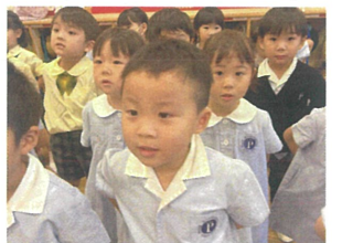
道を作ると 歌える曲がエが増えてきました