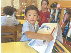
FESTAの絵を 挿しこみました