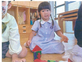
「おじいちゃん」 おばあちゃんの家だよ