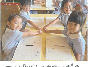
エシロツくささいす♡ いっぱいパワーを身めて!!