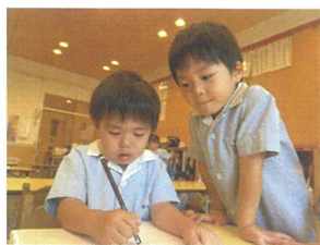
お友だちの絵に 興味津々です!