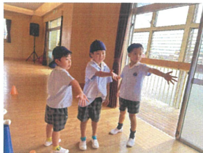
3クラス合同で リレーの実習もほめた!