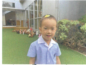
頭に葉っぱを乗せて、 ドロンと変身!?