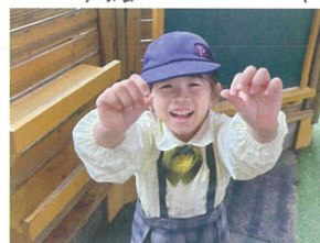
「小さいタレゴムシ」 見つけだよ