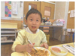
フーフーにクルクルと 巻いておしゃべり