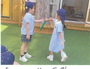
「はいっ!!」戸惑い ながらも成功しました!