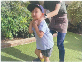
先生と一緒に 電車ごっこ楽しい♡