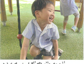
かくれんぼ中でしたが... すぐに見つかりました♡