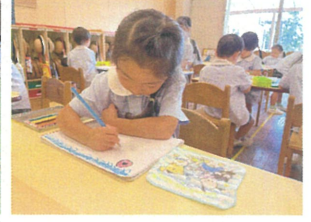
ハンカチの糸金柄を 描いてみようよ