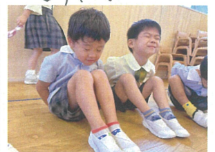
どこに落ちるのか ドキドキしながら待ちまよ