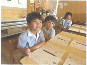
お話をとても面白く、 夢中になっています