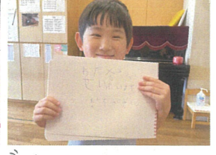
「わたはばせんせい だいすきだよ」 嬉しいメッセージありがとう♡