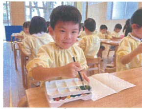
「青と黄色を混ぜたら」 緑になっだよ