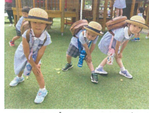
降園前にソーラン節が 始まり、しっかり構えています!