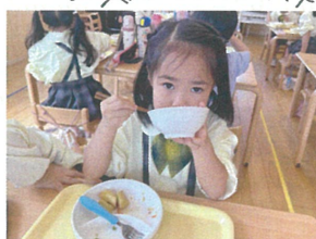
「お茶碗をしっかりと」 キレイに食べまよ♡