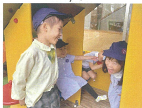
「四人家族は」 全員赤ちゃんです(笑)