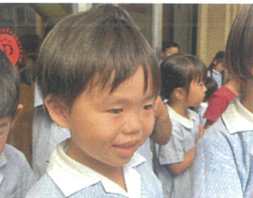
年長クラスのカッコイイ姿に目がキラキラ 一緒にソラン節を踊っていました