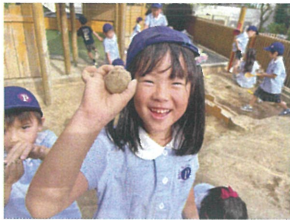
「お団子だよ」 キレイにできたでしょ?