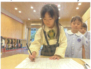
久しぶりの席替えは あやたくじで行いました