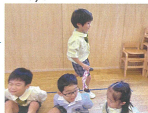
「どこに置くのかな?」 ハシカチ落としも行いますよ