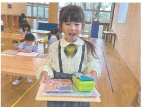
「全部まとめて」 持って来だよ♡