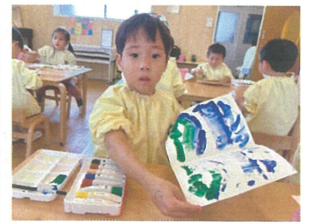
開いたら同じ柄!? 不思議だね♡