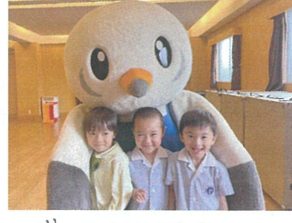
ぎゅーとしてもらい この笑顔です♡♡