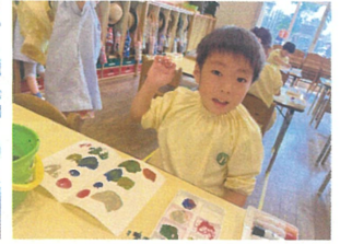
片方にだけ絵を描いて折り、また開くと...?? お顔みだいに変わった! 丸が増えたよ!!