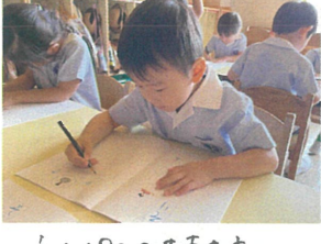
えんわつの手持ち方 はなまる♡です!!