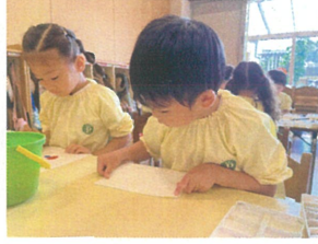
造形 あそび♡ 今回は、デカルコマニー★