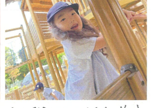
1/2階9階までくまね!! おかわりしようかな♡