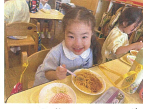
スポンジケーキをフックで くるくる巻いて食べてみる?