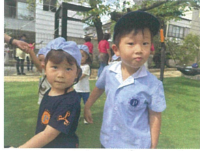
カワイイ妹とパシャリ! "またあそびね〜"