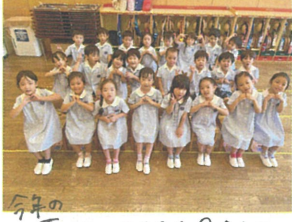
今年の 夏服はそろそろ見納め。 ちかひり寂しいなあ...