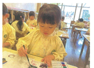
造形あそびで、 デカルコマニーをしました