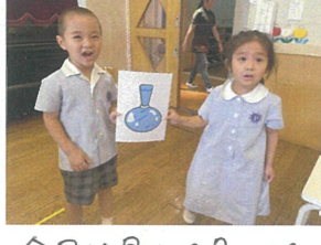
今回は早めに見つける ことができました♡