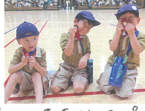
「わたはばせんせい だいすきだよ」 嬉しいメッセージありがとう♡