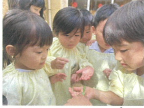
園庭にカマキリが 遊びにきてくれました