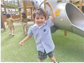
園庭遊びの際に 「ジャンボリミッキー」のダンス