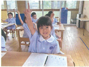
魔法をかける準備は いつでもバッチリ