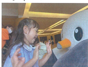
タッチをしてゲームを しもらいました