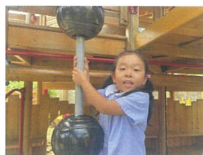
ここから登れるように なったよ〜