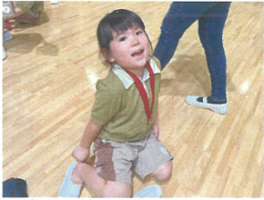
「またらいわんも」 くるからね♪