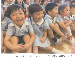
ゆりーとくんが来園!! 大盛り上がりです♡