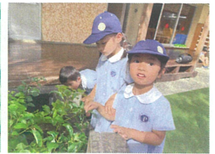
とっても大きき イモシを球見ゆ