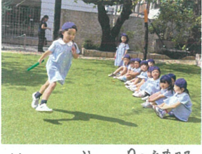
リレーのバトンパス練習。 お友だちにバトンできるかな!?