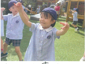
年長さんの真似っこ ソーラン節の様子がすく