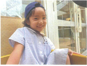
お家の中でつうぎ中へ お邪魔しました♡