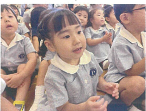
興味津々で話を 聞いていますよ