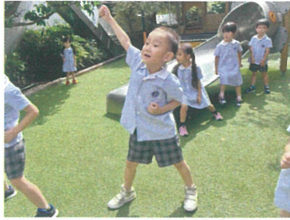
年長クラスのソーラン節を 後ろで一緒に真似、子☆