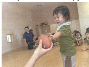
「ぼくは女の人に物を投げない」 紳士のたしなみ? 笑 ボールは投げてもいいよ!