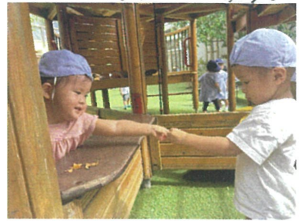
「いらっしゃいませ〜」 「これください」お屋さんごっこ