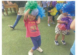
「ミッキーポーズ!?!」 とってもかわいいミッキー