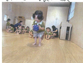
「ゴロゴロキャッチ」 しっかり脚に引き寄せてキャッチ!!