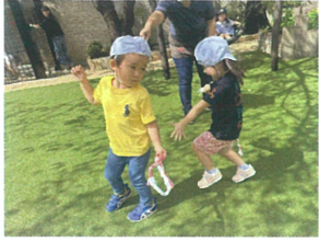
「とらないで〜る」 必死で逃げています!!