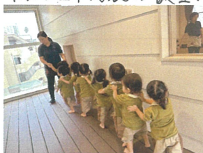
1歳児クラスの電車移動 こんなに上手になりました♡