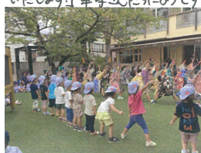
ついに一緒に踊り出す! なりきって楽しんでます♡