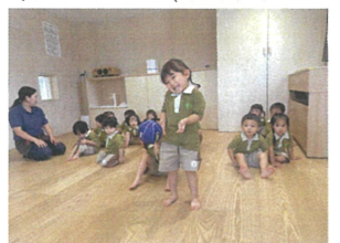
「あ! ボール来てるよ〜!」 「えへへへっ」