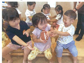
「はやく はやく〜!!!」 「まて〜」とても良い笑顔♡