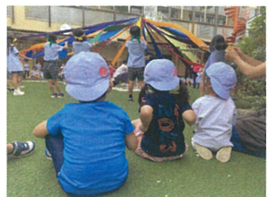
キレイな色のメイボール 見つめる瞳もキラキラ☆