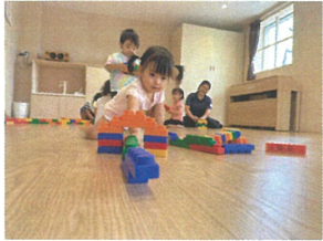
「でんしゃが通りま〜す」 トンネルをぐらてどっこいの?