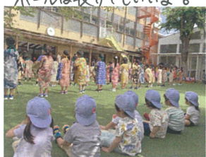
お兄さんお姉さんの真似に 1歳児クラスのお友だちも夢中☆