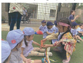
「さわってみる?」 こんな素敵なお交流も♡