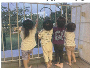
「中秋の名月2023」 きれいなお月様に大興奮!