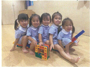
ガールズ♡♡ かわいい♡ カラフルブロックの電車でおでかけ♡