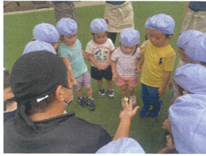
「あおむし」を見せてもらっています。 「ちよちよになるのいつかな?」 みんな興味津々♪