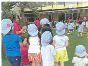
「きれいだね!」「すてきだね」 憧れのキモチが芽生えてきました♡