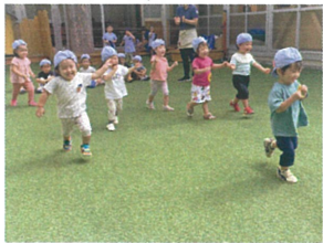
大好きな先生のところまで 「ヨ〜イ ドン!!!」