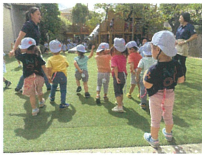
次は2歳児クラスの番!! 気合い十分☆背中から漂っています。逃げる事に夢中でとりの忘れている?