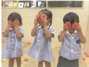
♪ とんぼのめがねは あかいろめがね〜♪ とんぼさんにへ〜んしん