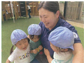
先生にゴキュッとされて とてもうれしそう♡