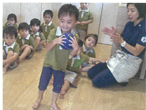
「ワンバウンドキャッチ」 上手にとれてこの笑顔♡