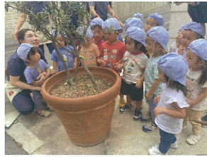
オリブの木にも「あおむし」 みんな興味津々♪