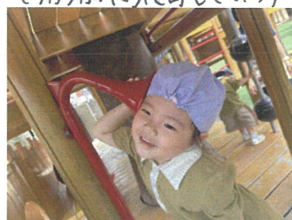
誰かと通信中!? 「アパロン2号まもなく出発 いたします!」車掌さんだよです。