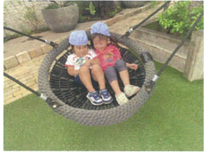
2人仲良く「ゆりかごスイング」 お話しに、花がさいます♡