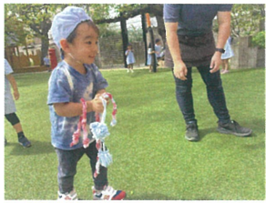
「なんなにたくさんとれたよ〜!」 1歳児クラスの優勝者!