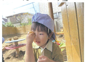
葉っぱの中身が気になる〜!!