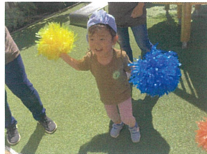
「ジャンポリミッキー」 ポポンを持ってリノリです♪