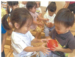
「ボール送り競争」 「はいピーぞ!」ニ④ニ