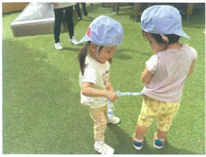
初めて園庭での「しほとどり」 「とっていい〜?」「いいよ」可愛い♡