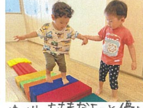
お水あそび後、 手のひらを太陽に～ 園庭に到着!と思ったら 『アイスできましたよ。』 ゆっくり、大丈夫だよと優しく お着替えて サッパリしたね😊 元気いっぱい歌っています♪ いまなりの号雨!! ツリハウスで酒宿り♪ ボールがコーンに当たったり 手を引くお尻さん☆