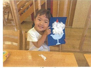
アヒレとお水を入れて 大きな虹がでてるよ！ テッシュをビリビリ～ 器の上にぶぶぶの さくらんぼを乗せたら 振ったり転がしてみたり♡ と教えてもらい、みんなで「テラバ」 柔らかいから優しくね♪ 水をたくさん乗せて... かき氷(=☆何味(=)しようかなあ)