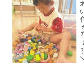
今度はお水を入れてみたよ！ 「ネバネバになった～」 ココから見てるぞ～ 「先生あそび」一つ、満面の さあどうなったかな？ 不思議な感角虫(=大盛り上がり)☆ 視線を感じて上を見上げると... 笑顔ど来てくれますよ たくさんの中から 品定め中 60