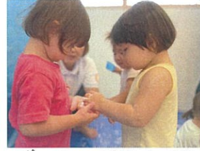
今日の感角虫あそびは サラサラど気持ちいい～ 両手にスコップ!! /カップに入れて、 一緒にギュッ 固まったかな?? 「片栗粉」を使いました！ 頭の上にもパラパラ～ すくって落とすのが楽しい♪ デザートを作るの