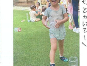
かき氷には(=やっほり)シロップが 大事☆ キラキラを並べているよ☆ ポリもこんなに集めた☆ イチゴ、メロン、レモン... ハイチョッルにある!と好きな味選んでいました! 水に反射してとってもキレイなキラキラにみんな夢中ですよ♡