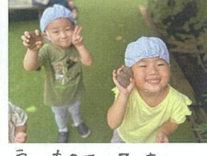
次はどこを狙って 幼稚園のクラスを借りました☆ 先生のしっしょたくさん! /ホーいつかまえた、\ 当てるかな😊 具合は充分のヨーイドンッ⇒ 何本取れるかな😊 一気=2本GET☆ 良いものフーッニ☆