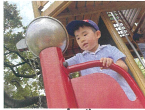
よし! 1階に 石を届けるぞ!!