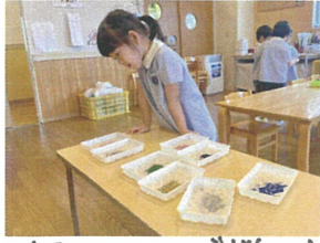
何色にしようか悩み中 どれもキレイだな〜♡