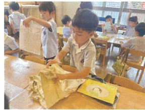
袖をばして量っています