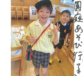
園庭あそび行きます!!