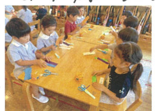
七つの輪倉庫作り!! 「ぼくはこの色あま からこっもどうぞ!