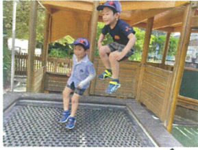
ナイスジャンプか↑ どんまで跳べるかな!?