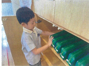
揃えてくれてありがとう