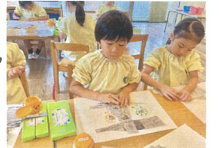
丸めて立体にくっつけて おたまりと倉庫の量か