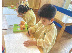
鉛筆で自分の 名前を記入します