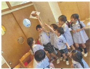
あっ! 空気清浄機が 後ろにあつたよ!