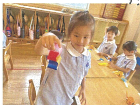
4つの輪っかが 繋がったよ