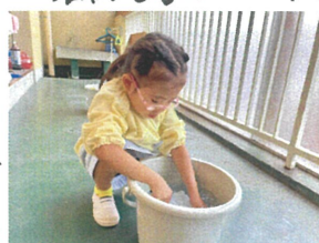
ハレットも最後まで 自分でキレイに洗います