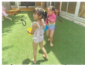
「キーン!! 水が」 おんりから飛んできた♪