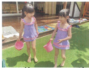
水着がオソロイで かわいいね♡