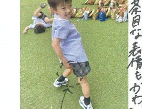
お茶臼な表情もかわいいね!! 夕又の尻尾ぞう!! 笑