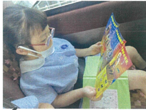
あ〜! ライオンが楽しかった!