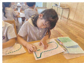
三角の向きもよく 見てもらっています