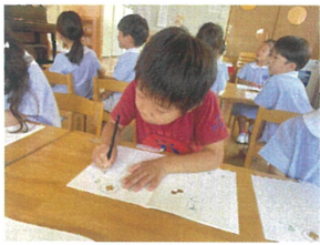
見本の字を見て 丁寧に書いています!