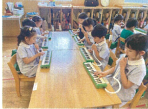
グループごとに 演奏し、最後に皆で♪