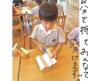
自分で折ってみるぞ!!