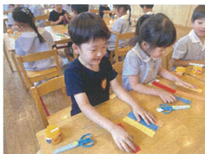
わあ〜いよ、色々な 色が集まったよ