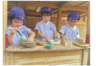
こちらは手分けして、 混ぜています!!