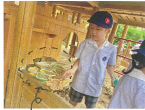
火をつけて焼いています!!