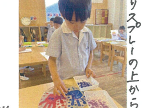
のリスアプリーの上から ラメパウダーをパラパラ