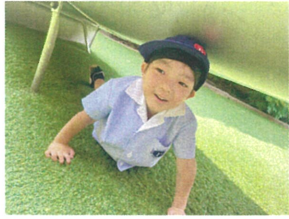
スライダーの下から とーと現れちゃった!! 笑