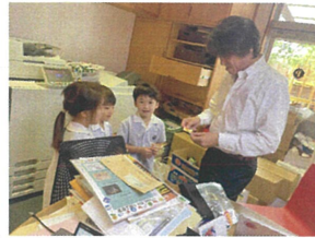
初めて8段も跳んだので、 園長先生からステッカー頂きました!