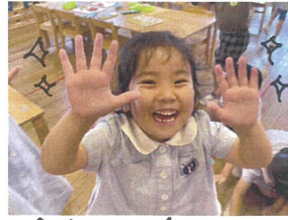
わたしの手 キラキラになっちゃった!