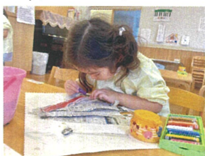
こちらは、Xホルモを 作って布を塗っています