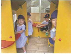
みんなでお家から 少し顔を出してはいちご