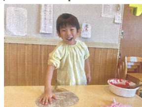
どうだ! と言われはうに 手形をギョム!!