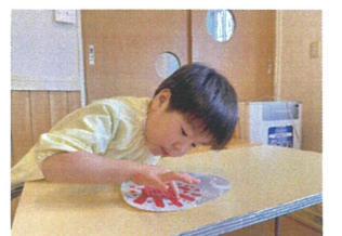
同じに指スタンプで 花火を表現