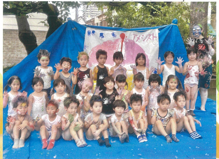
女子には 帆の音分を お願いしました☆