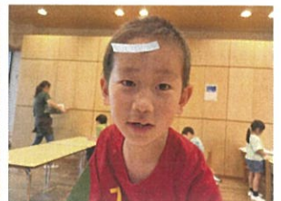
頭に貼ってせんか? 付いてるよ!!