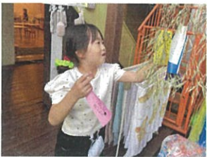
ママと弟が見つけやすいように下の方に付けました☆☆