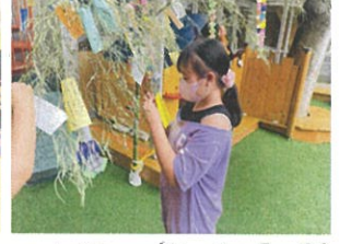
大世に飾りまじにお願い事叶いますように