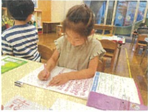
腰骨を立て丁寧に漢字を書いていますね