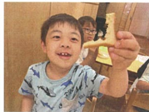
見て!! 書いてあった!! 見事だよ!!