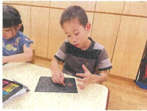
クレヨンで絵を描いて、クレパスで色をぬって(おはじ)