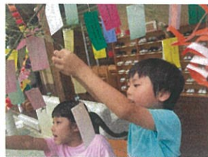
高いところに付けると叶いやすいとうです(笑)