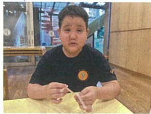
ストローをたくさん回して勢い良く動くかな？