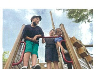
今、3人でポ〇も〇ごっこしてるんだ!!