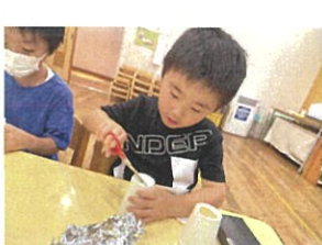
今日は変声機を作りました