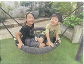
ゆりかごスイングに乗って仲良くお話し中