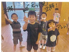
先生とジャンケンで負けてください!!