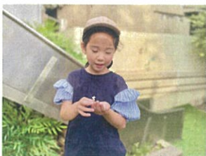
キレイな白いお花が沢山あったよ