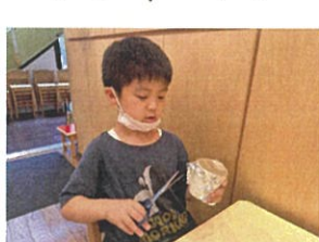
声が変わるポイントはアルミホイルだよ