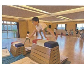
高くジャンプ!! 跳び方もバッチリ