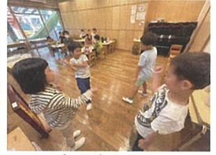
おにぎりジャンケン! ジャンケンポン!!