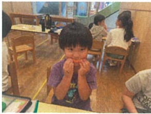
オレンジの皮もロロはめていましたよ