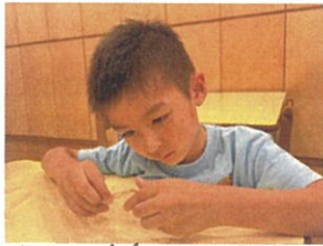
真剣な表情でストローに輪ゴムを通しています☆