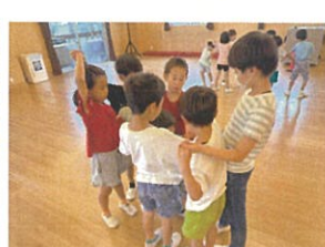
人間知恵の輪を行きました