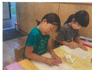
マス計算、とんどんスピードが上がっています