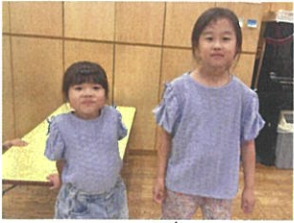
にまたまお揃いの洋服でした