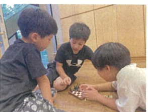
チェスで勝負!! のはずがお互い譲らず長期戦に!