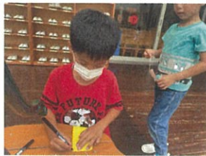
短冊にお願い事何と書こうかな～