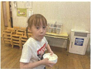
片付けまでしてくれます。いつもありがとう