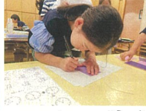
七夕に向けてお願い事書いています☆☆