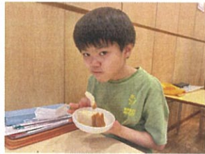
みんな大好き、シュガーケーキ♡