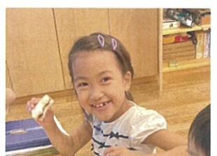
おぐらトーストおいしい♡