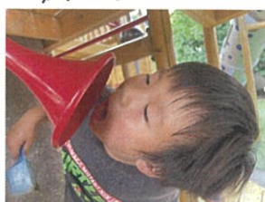
わあ〜!!! 僕の声届いたかな??