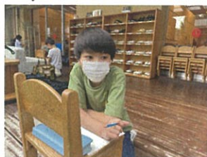
小さな家を描いています