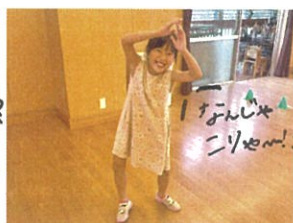
手と足の動きが分からなくなった