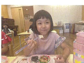
ママのお弁当美味いんだよ