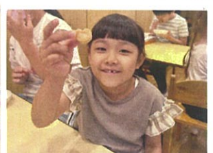
ハート型のラスクが、あったよ！ラッキー☆