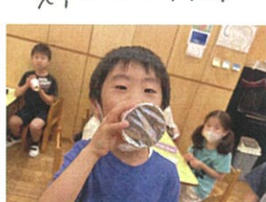
あ〜!!!! 声が変わってる!!!