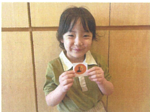
オセロダッシュ、クラス1位!! ステッカーをプレゼント