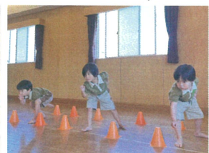
クラス別サーキットでは、オセロラッシュを行いました