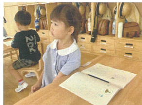
真剣な表情で 見ています