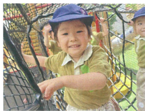
ツリーハウス 楽しいね