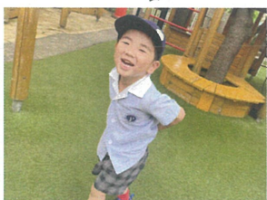
今日は暑すぎよ〜日 と暑いのがり全力疾走!!