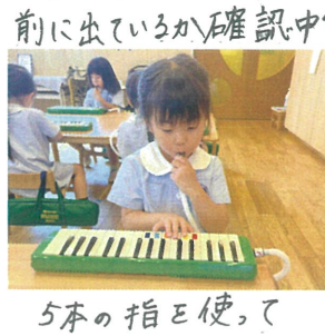
5本の指を使って 弾いています