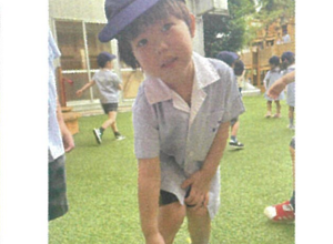
素直な靴をさせてくれました! タニゴムミかな?