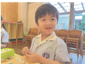
粘土で大きな舟を 作っています。