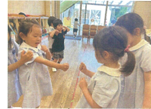
ジャン列車、流行中楽しく何度もやっています