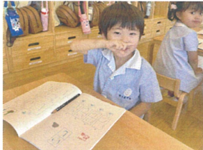
今日のツボは こんな顔だよ