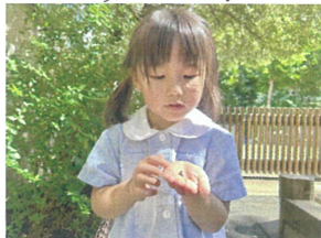
このタシゴムシ 黄色の点々があるよ