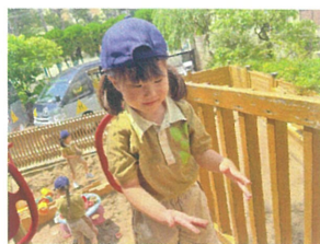
手に砂がいっぱい ついたら