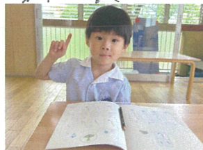
いつでも準備オッケー