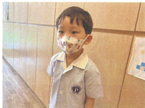
からこよく日直ができました!