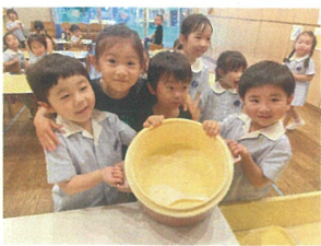
初めておひつが 空っぽになりました♡