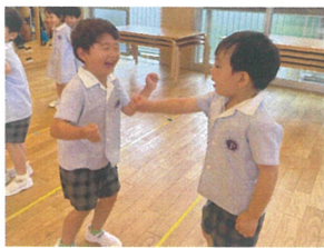
全力でジャンケン しています