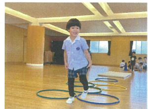
男の子VS女の子でリレーを行いました