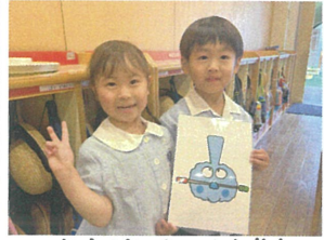
ツボ発見です! 次回はモクモクのツボ