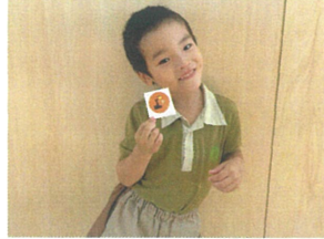
オセロダッシュで クラス1位になりました