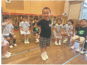
「初めてゼン」という子も 楽しんでいました😊