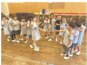
ルールをしっかり覚え、 大盛り上がりでしたよ