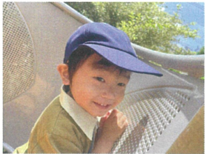
この灰色の壁が あつたかいんだよ!