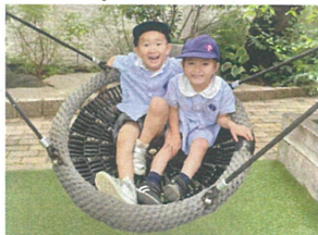
2人で乗ると 楽しいね