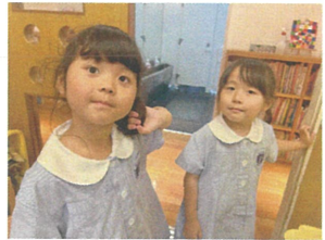
早く給食食べたいな〜という顔サたいです