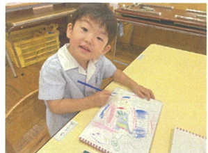
僕は建物の中を歩いているよ〜