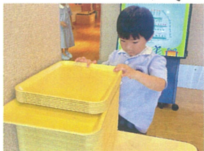
丁學におぼんと 戻してくれました