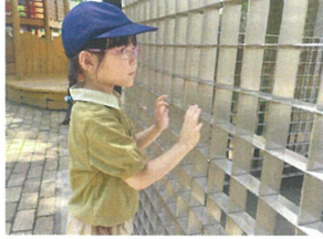
外の様子を観察中... 何が見えるかな?