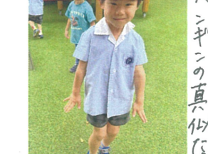
ペンギンの真似だよ 可愛い