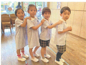
じゃんけん列車 誰かが月着かたよ♪