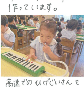
高速でのひげいせんも 弾けちゃいます♪