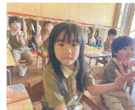
言葉のチカラにある“漢字の誕生”を見ているところ