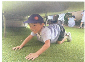
こんなところにサ〜つけぬ / こっちに来てよ〜 お誘いしてもらいました