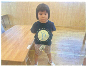
真剣な表情で 歌あそびに取り組みます!