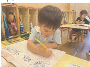
ギザギザの糸を 描きました