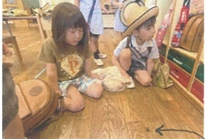
クラスには小さなお客さんが!! みんなが観察しました(笑)