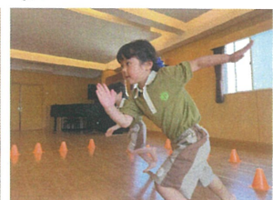
オセロラッシュを行いました