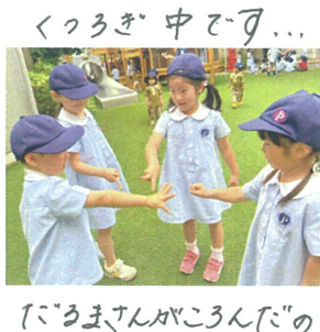
ごんさまがころんだの オニ決めをしています