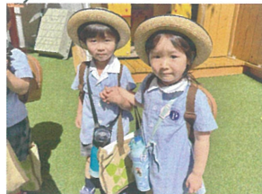
2人で手を繋いで 仲良くできる