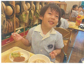
みんな大好きな うどんの日♡