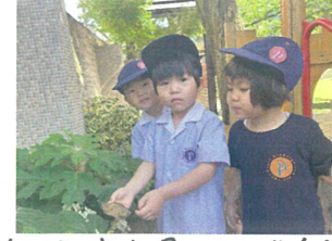
いも虫を見つけたよ! カワイイね〜♡♡