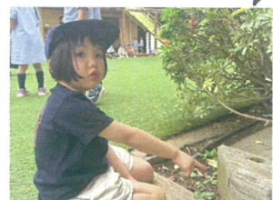
ココになにかいる!!