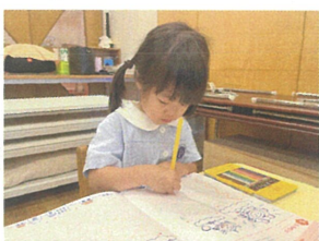
みんなのワークはかみやり。 黄色を使っています...