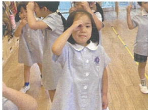
双眼鏡も 持っているよ