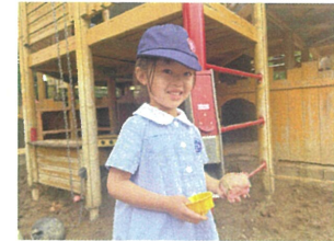
石の上場が大女子き♡今日は何を作ろうかな