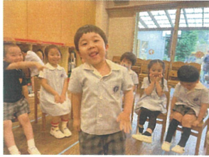
フルーツバスケット でもバスケットをしました!