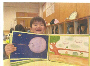
面白い絵本を紹介してくれました!