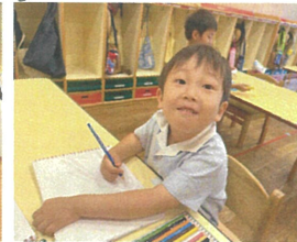
建物を描いているところ