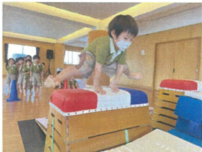
初めて跳べたり、「あとちょっと...」と 全員が全力で行いました。引続き元気張ろう!