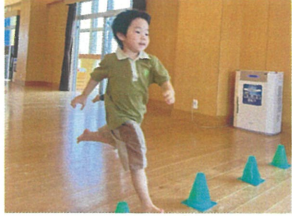
ゴールまで全力で かいていきます