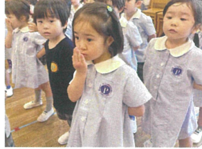
裏声を出す時に息が 前に出ているか確認中