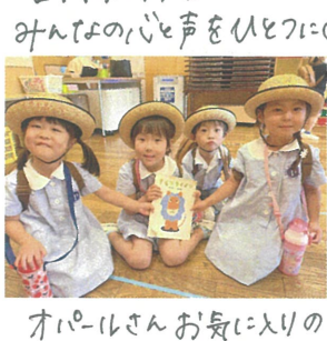
オパールさんお気に入りの 『きせつライオン』という本です♡