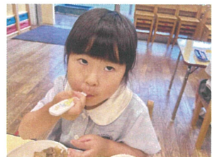
大きな口でパクリ88 / たくさん食べてね