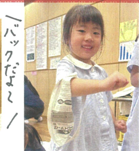
バックだよ! どこにお出かけかな?