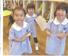
何をして遊ぼうか相談しています