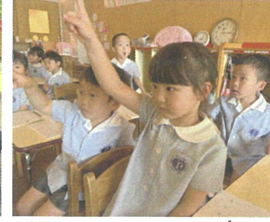
「いし」という字を書きました