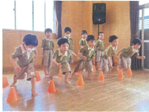
クラス別サーキット★ オセロダッシュを行いました!