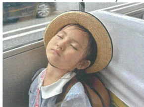
1日を ぐっすりおやすみ