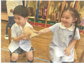
続いては...爆弾ゲーム! 早く隣の人に渡してね!!