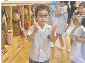
もじゅくカブリに いこうよ