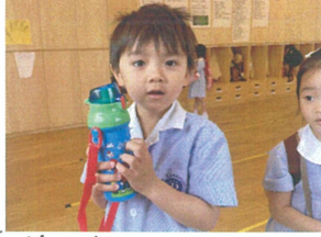
水筒が新しくなったよ!