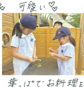
葉っぱで料理を しています