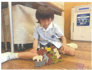
どうしようかしよ たくさん練習だね!!