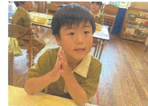
いただきますと言わずに食卓までバッチリです