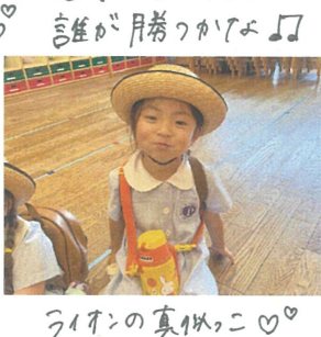
ライオンの真似っこ♡ どのシーンでしょう?