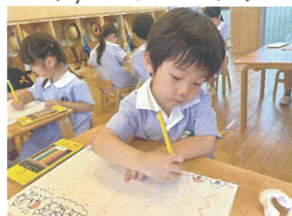
上から下に向かって ギザギザになぞります