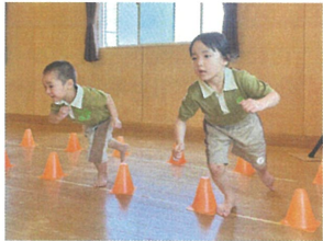
決勝単体の様子 走りフォームが◎です