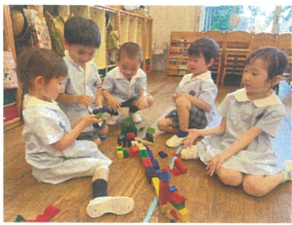
友だちと協力して 「街」を作っていました