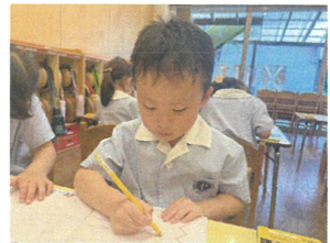
さんのワークではカミナツを描きました