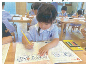
左手で押さえて 集中して描きます