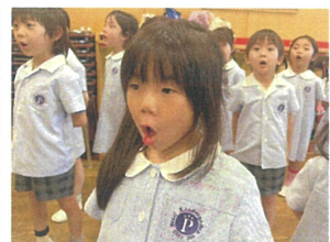
口の開け方がスムーズ! 真実さが伝わってきます