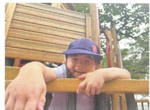
口の開け方がスムーズ! 真実さが伝わってきます