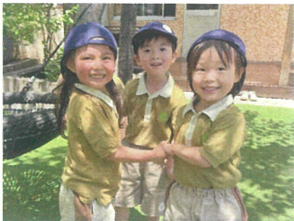
3人で手を繋いだまま 色々は戸へ移動しています