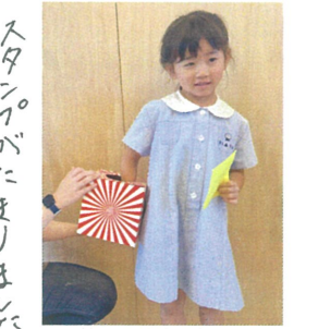
スタンプが たまりました! !!何が 出るかな?