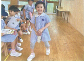
見てー水筒に 乗って飛ぶよ