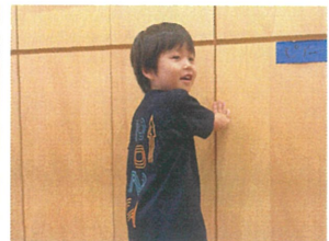
今年のパジャマ、カッコイイですね!