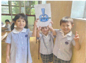
次のツボゲット☆ ヤッター!