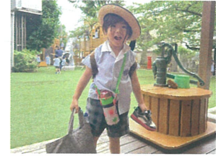
おはよりごあいさつが、元気な挨拶が乗取河