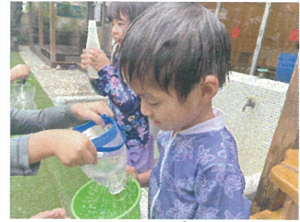
お友だちと協力して水を溜めています