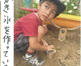
かき氷を作っているところ カップに石を入れて...