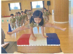
キレイな姿勢で 跳びてます!バッチリ