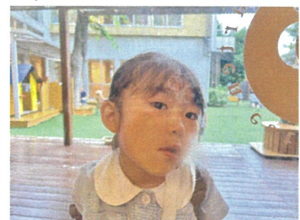
誰が来ているか顔を近づけて確認中