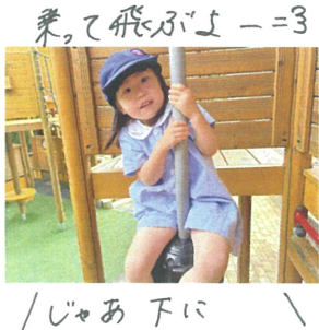
じゃあ下に 行ってきます