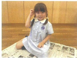
新聞紙あそびが始まります!