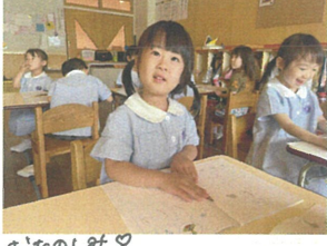
おたのしみ♡ インタビューしてください!!