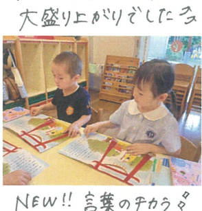
NEW!! 言葉のチカラを 聞き耳ずきんに使いました。