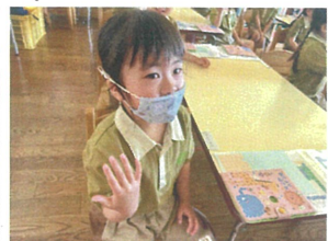
この給食美味しいよ! ニッコニコです