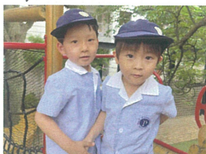
1組2人組😊 今日は何して遊ぼう?