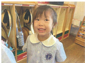
合同歌練習では みんなの心と声をひとつに♡