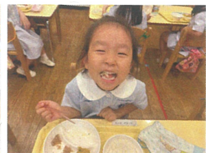
この給食美味しいよ! ニッコニコです