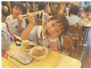
「見て〜長〜い!!」 大きなお口でパクッ!