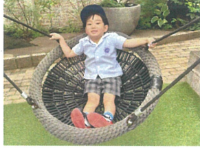
ゆりかごスウィングで くっつき中ですよ...