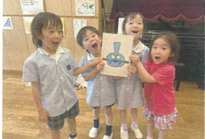
次のリポのお話も 楽しめたね😊