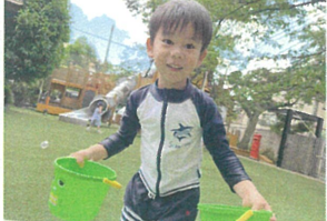
「今日は水遊びにぴったりの天気だね!」と車庫から ワクワクしていた子どもたち。涼しくなれたね♡