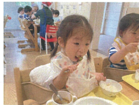
グロッキーをパクッ☆ 上手に食べられました♡