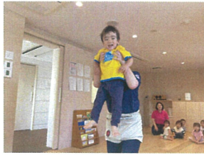
先生とカエルジャンプ♪ ピョンピョン☆