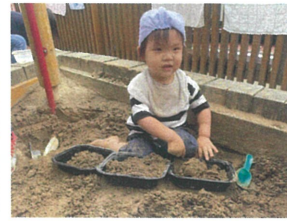
お弁当を3個並べて 「ママの」「パパの」「ボクの♡」