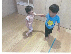
しゅぽみ～つけた♪ にげてにげて～♡