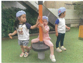
1歳児クラスのおともだちが乗ると 2歳児クラスのおともだちが目 くれました♡