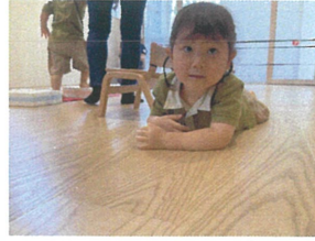
帰りはゴムに当たらないようにゴム紐の下を匍匐前進ですすみます☆ 手と足の力を使って「ヨイショヨイショ」頑張る～♡