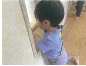
窓の反対側のアヒルを発見☆ あれ!? とれないぞ～♡