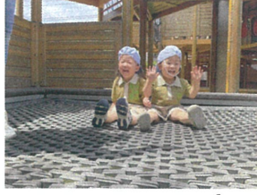
先生がジャンプする様 を楽しんでいます♪