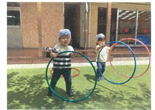
フラフープで何しようかな～??