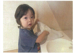
「あれ!?!」アヒルをとったつもりが この後ちゃんと見つけました☆