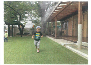
暑くはってきたのでミストを 浴びて「きもちいい♡」