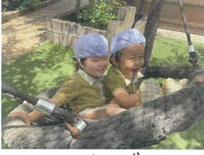
ゆりがごスウィング☆ 「たのしい♡」