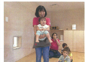
こちらもカンガルー♪ ピョンピョン楽しいね～☆