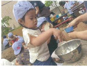
お砂を混ぜて 何をついているのかな??