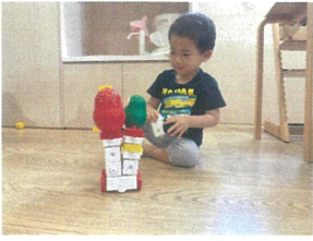
「みてみて～」高く重ねて パレードのフロートみたい☆