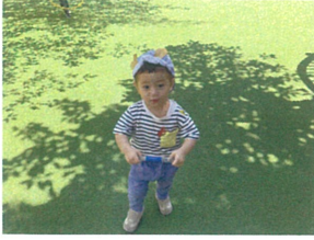
葉っぱをつけてウサギさん 変身☆