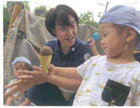
「アイスクリーム♡」とても 美味しそうにできたね♪