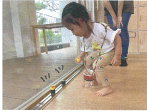
アヒルさんみ～つけた♡ 2羽一緒にGetです☆