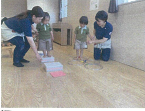
「ジャンプ」1歳児クラスのお友だちは踏み台ジャンプ♪ 2歳児クラスのお友だちはフラフープをゲージ-ページ-でジャンプ♪