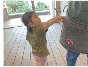
先生のエプロンにも… 「見～つけた♡」