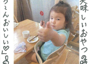
美味しいおやつ時間♪ うんこおいしい♡(o_o)