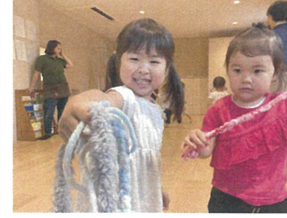
「みてみて～しゅぽとれたよ♡」 またやろうね☆