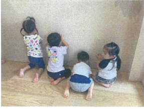
アヒルを隠し中☆ こっそり見ているのは誰かな??