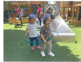
しゅぽ～つ☆フラフープ電車 楽しいね♡