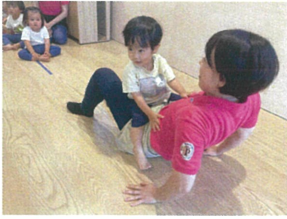
ワニに変身☆「1.2.1.2」 頑張る～P