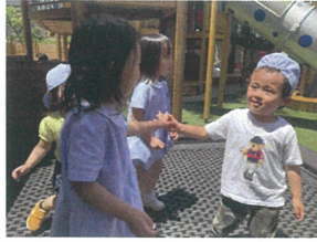
Pearl Nursery Schoolに昨日まで いたお友だちと会ってニコリ♡