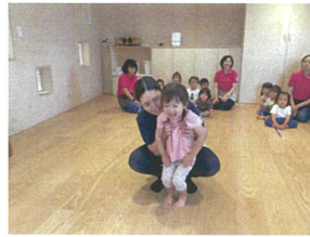
「グログロ～」足も曲げて 上手にジャンプ♪