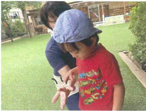
大きなダンゴムシを発見!! 興味津々です☆