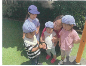
手に乗せたダンゴムシを 見せてくれました☆