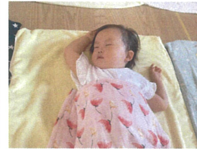
たくさん遊んだあとは ズズズ…☆