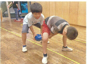
チームに分かれて ボール送りを行いましたの