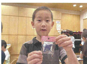
／エイの消しゴム ゲット!