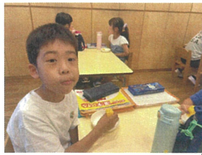
今日のおやつ、フワフワ 美味しいなあ～