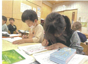
ゆっくり丁寧に... 集中していますね