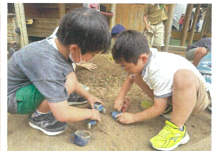
お石を集めて 電車の出発です!!