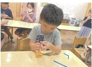
車輪ゴムに紐を通して... 組み立てます