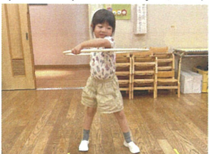
／フワフワの練習中 ／爪とぎをする 猫の真似です