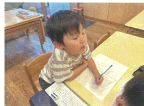
うん... 見て見て!! ねりけし作ったよ