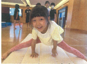
上手に開脚前転が できるようになりました！