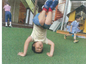
三点、倒立をした から数を数えていすの