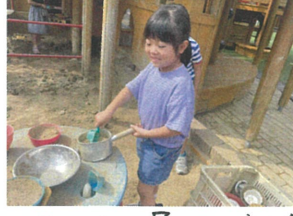
ラ-X=屋さんごっこ 仕込み中です。