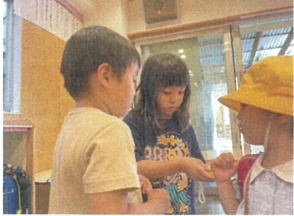
防犯ブザーについて 教えてくれましたの