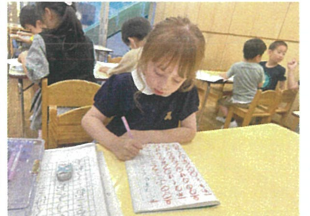
全マルが欲しいの!!!