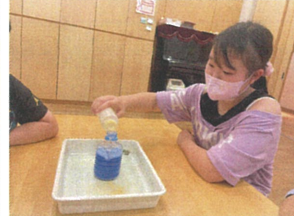
今回のサイエンスは... 泡が飛び出す実験の