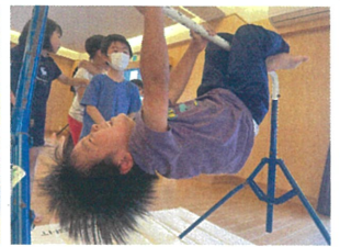
月夜の丸焼きといり枝 たじろりです(笑)の