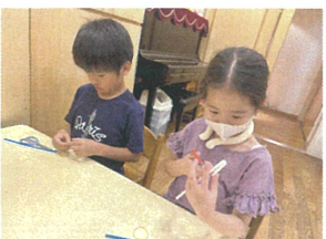
今日の工作は、 「バタバタストロー」作り☆