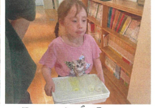
沢山、お手伝いを してくれましたよありがとうの