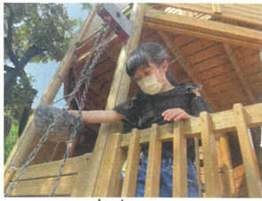
2人で協力して 遊んでいました！