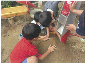
お山をつかっていきます!! ドンドン大きくなるねクク