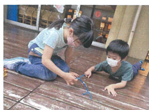
園庭あそびの日時間を ストローに夢中でした♡