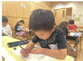
今日は作文の テーマは「夏休みに楽しみなこと」何と書く...