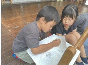
マ○クラの絵を 描いています