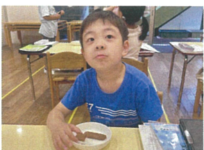
／ココアの味がする 今日のおやつはちんすこうです