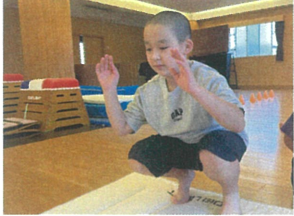
鉄棒の後には マット運動をしましたの