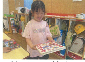
折り紙、絵本を get! 何作ろうかな