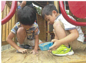
床の溝も、しかり お掃除中