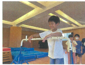
体操では鉄棒を 行いまして、やる気満々