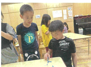
どっちが長くバタバタ 出来るか、競争ね!!