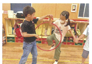
手を使わずに フワフワをくぐりますの