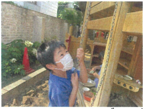
／今から石ツを上げるよ～ ゆっくりゆっくりに慎重に...