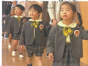
本日の主役の入場です 堂々と歩いていきます。