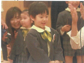
「おめでとう!」の拍手をもらい、 照れています♡