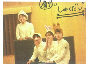
しゃべりたいは… だっこしてもらおうこと!?