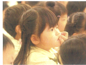
手遊びと先生たちの 劇に夢中です♡