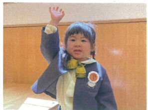
はいっ!と元気な声でお返事してくれました!!