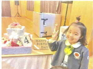
おいしそうなケーキと一緒にハイ！チーズ♡