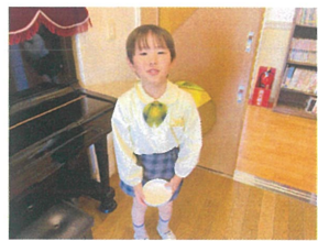
オレンジのおかわりって まじります!! うれしそだね