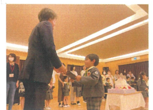
園長先生からの プレゼントうれしいね。