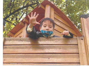
おーいこちだよ ツリーハウスから叫ばれています📣