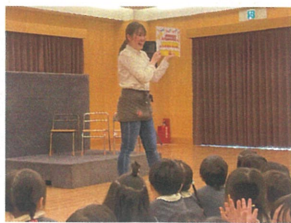
先生たちからのプレゼントタイム 美味しそうなケーキが完成