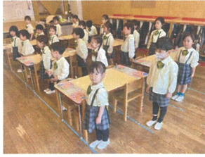
オールクラス 朝の会...集中しています!!