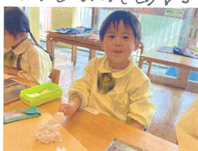
ジュ-ジュ-♪ 焼きマシュマロです(笑)