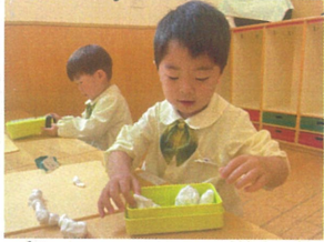
繫げて... 銀河鉄道を作ったよ!!