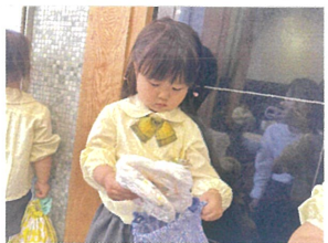
替えるオムツは自分で出すよ♡