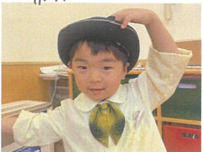
お友だちのために お手伝い屋さんに変身