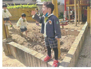
オーライ オーライ 一緒にバスを出しています!