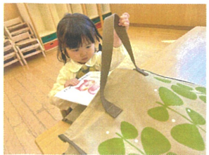
大好きなパッツの絵本を持って帰れる♡