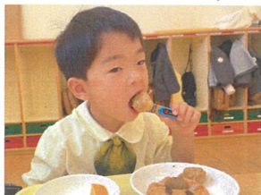
ボクはからあげが 大好きなんだ♡♡