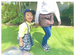
先生と手を繋いで"お散歩"してきました!!