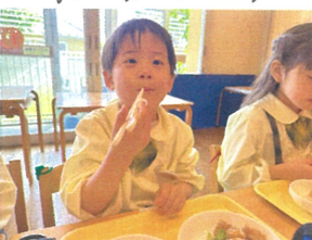
僕の大好きな グロッキーがあるよ!!