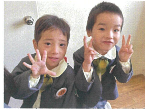
入場前のしゅくだい 楽しみだね!!