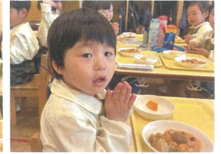
「自分に似ている顔」を 選びました😊いたゞきまー!