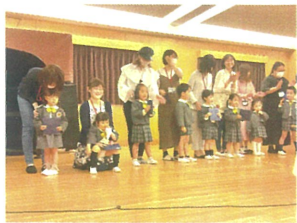
お母さんと一糸者でみんなが嬉しそう♡