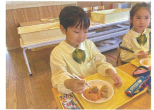
次は、目にしようかな? それとも鼻にしようかな…