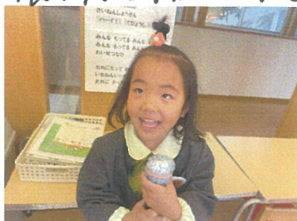
クラスでも沢山のインタビューをしました♡