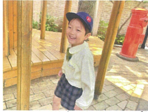
友だちと違いかけ、二つ三 のが大好きです