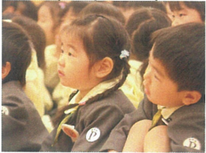
真実な表情... 釘付けな様子