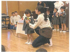
ドキドキしながらも上手にお名前が言えました♡