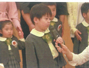
インタビューがドキドキの中 堂々へ行えました!!