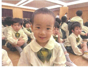
年中クラスになって初の お誕生日でした🎂