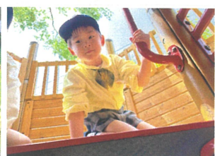
ツリーハウス3階に 登りました♪