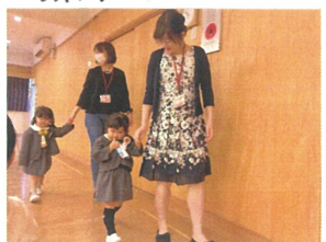
ママと一緒に手を繋いで入場♡