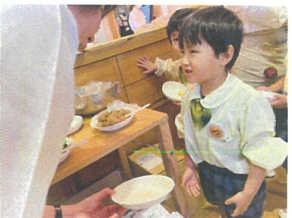
/おかわりください!! 今日もたくさん食べてね