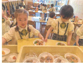
今日は、お楽しみメニュー! 取りに来るだけでも楽しい♪