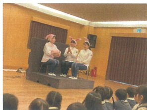
今回のお楽しみは「しゃくだい」楽しかったね♡