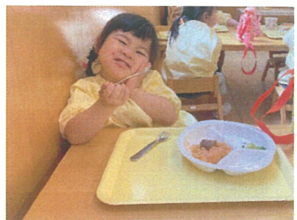
今日の給食もおいしいね~♡