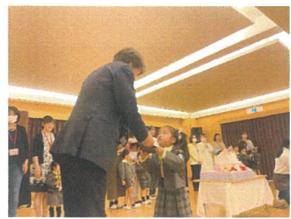
ちゃんと目を見てお話を 伝えているのかよ