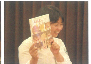
幼稚園の本棚で 探してみよう📖