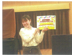
先生と一緒に ケーキを作りました