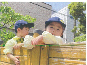
最近お気に入りの 場所です今日モニココ♡