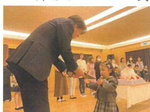
園長先生からプレゼント