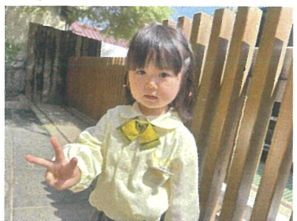
3歳になったの♡教えてくれました!!