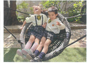
ゆりかごスイング楽しいよ!