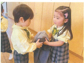
もう支度が終わったよ! 今日おなにをしようかな?