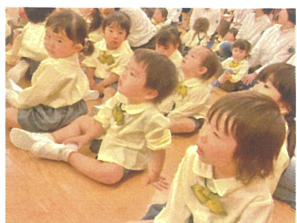
口を開けてまます、見子こころに夢中ですよ♡