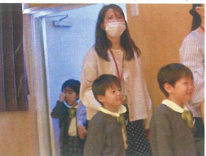
楽しみにしていた お誕生日会♡