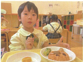
お昼食の時間 なんとスノーボールメニュー!