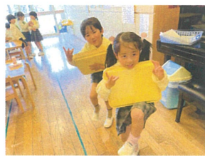
カメラを向けるとどうしても ピースをしたくなるよ(笑)