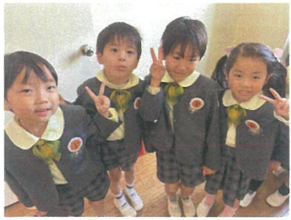
4月生まれは4名です!!