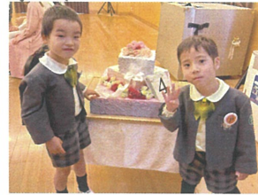
ケーキの前でパシャリ📷 Happy Birthday🎂