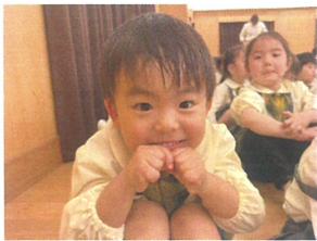
もうすぐ始まるかな？ ワクワクするね😊