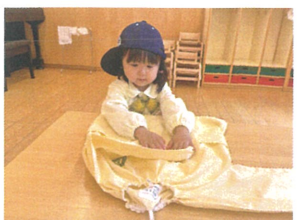
袖から量むんだよね!!