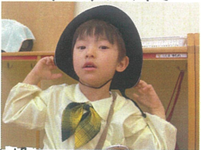
★帽子コレで合ってるかな? ★カッコイイポーズ ★決めていました★