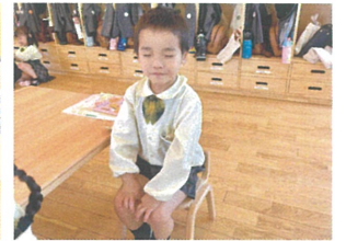
腰骨を立ててステキな 姿勢で朝の会を行います🎶