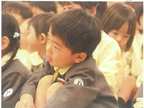
お面白いなあ! 緊張もほぐれていました。