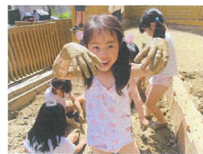
泥遊び最高だね♪ 両手真黒、ダー