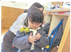
ボタンも自分で!!とやる気満々です♡