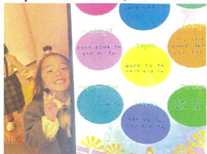
サインージに自分の名前みつけた♡