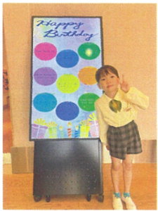
6歳のお誕生日おめでとう