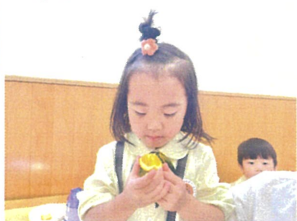
初!?のオレンジのおかわりしました♡