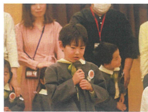
年長クラスに1人、クラス名前・お誕生日 6歳に1人お誕生日のことをみんなの前で言います!