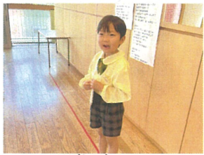
クラスの友だちからの 質問タイム♪