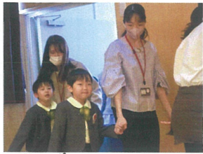
保護者の方と 手を繋いで入場♪