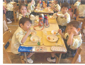
お友達と一緒に 食べるとおいしいね♡