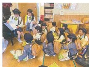
今日は月末なので4月の絵本を持ち帰ります😊 その前に2人に絵本を読んでもらいました!上手だったよ