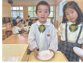
おかわりください! たくさん食べます🍴