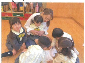
お誕生日会の前にお友だちとトクタイム♡