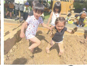
泥あそび日和😊 思いっきりあそぼう!!