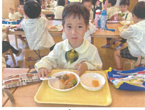
今日はお楽しみメニュー! よく噛んで食べます!