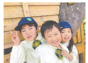
カメラ向けたらいい笑顔 見せられました😊