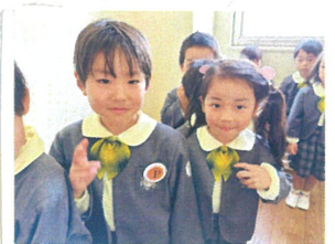
エメラルドクラス😊 4月生まれのお友達♡