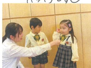
園長先生からプレゼント