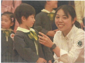
好きな食べ物... 「りんごです!」