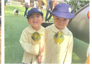
大好きなお友達と お散歩してました!!