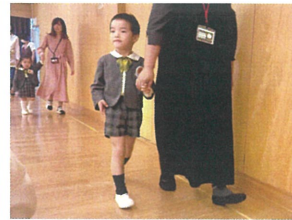
お母様と一緒に 手を繋いで入場☆