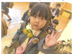
さようなら!! また来迎待ってるね♡