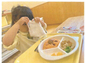
見えないよー!と、かくれんぼ中(笑)