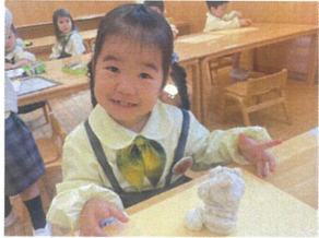
大きなお団子を作って いらねえりませ〜!