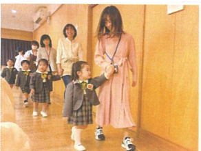
大好きなお母さんと 一緒に喜びます