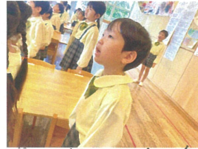
真正見つめる視線が とてもステキです