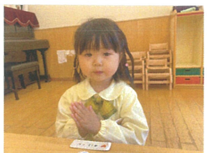
食後の挨拶が、とても上手です♡