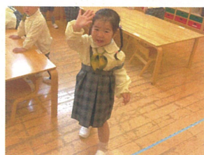
おはようございます ニコニコ登園です