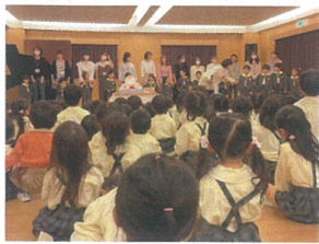
4月生のお友だち全員集合! みんなの前に立ち、ドキドキ♡