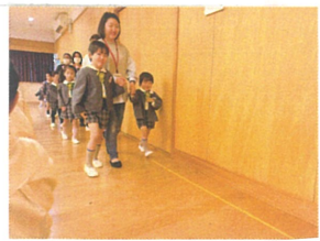
4年ぶりに保護者の方にもお誕生日会に参加し ていただきました。一緒に入場できうれしそ〜