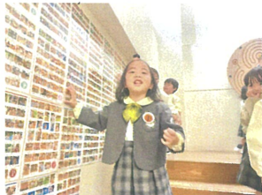
お誕生日会とても楽しかったね!!