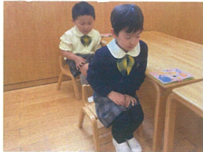
朝の会、脾胃をそと 集中している様子