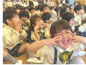
手遊びもソリソリ♪ みんなの笑顔が素敵でした!