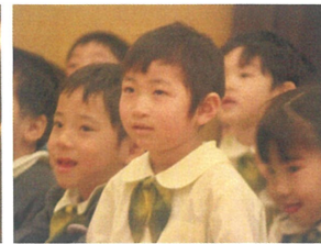
みんなも「しゅくだい」 やってみてね★