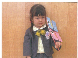
こどもの日の製作で、こいのぼりを作ったよ♡