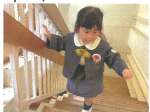
階段はキヌツを掴んで上ります♡