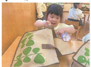
3歳だから、お荷物作りも出来ちゃう♡