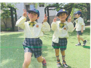
お兄ちゃんと一緒に ハイ・チーズ!!!