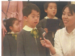
クラスとお名前を カッコよく伝えています