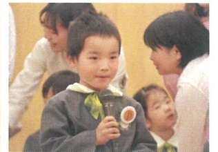
インタビュー本番🎤 ちょっぴり緊張の表情😊