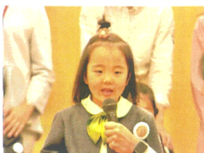
みんなの前で「好きな履き物を発表しました♡」