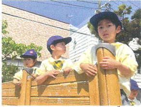
バス来るかな?またかな? あと少しで到着しそうです!