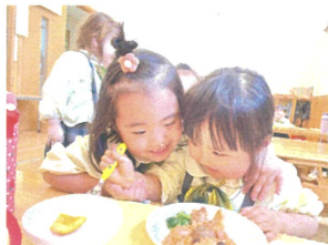
友だちのことを応援してくれています♡