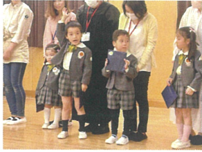
4月生まれの子たちへ 「いーい」