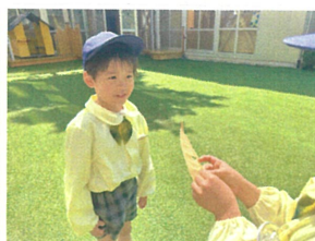
1世のクラスのお友だち からも「おめでとう」