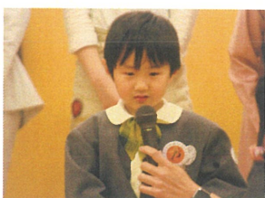
全園児の前でも 堂々と答えることができて