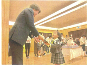
しっかり、目を見てお礼が言えました♡