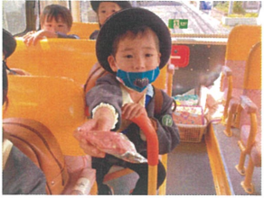
僕のティッシュを 使っていいよ!