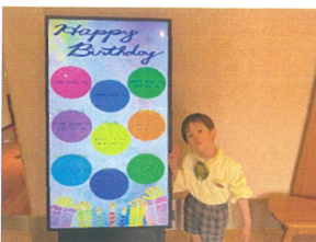
サプライズクラス々々 Happy Birthday!!