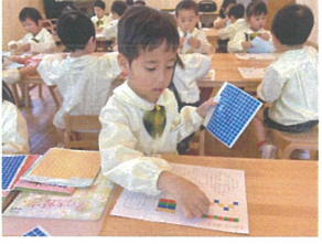
1つ1つ丁寧に シールを貼っています📄