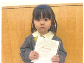
HAPPY BIRTHDAY☆素敵な1年になりますように!