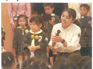
インタビュータイム☆堂々とお名前が言えました♡