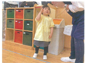
クラスでもインタビュー3歳になったんだ♡