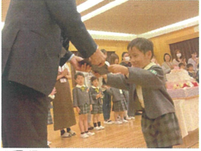
園長先生からプレゼントを いただきました🎁