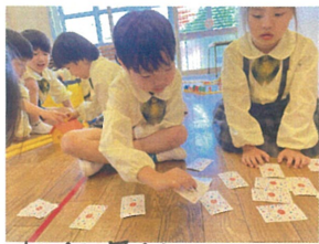
神経衰弱中…。 確かココにあつたはず!