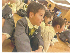
先生たちからのプレゼント 夢中で見ています!