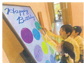
サインシートで自分の名前を 発見★エメラルドから緑だね!