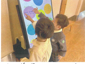
名前見つけてだよ! とても嬉しそう🎉