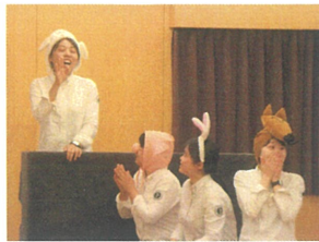
先生たちからのプレゼントは 「しゅくだい」のお話でした！