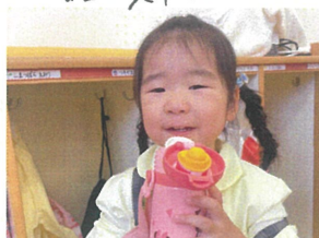
ふうん水分補給も バッチリです