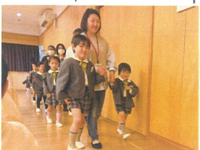
いつも以上に素敵なお顔 突顔が見られました