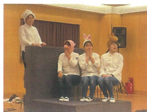
絵本「ゆきだるま」の幕 色々な動物さんが登場!!