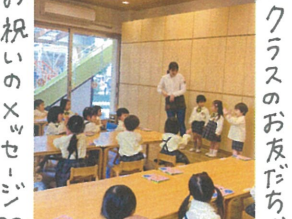
お祝いのメッセージ♡ /お誕生日おめでとう!!