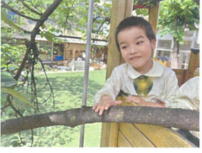
大きい木だね~ 木をなでておしゃべり...