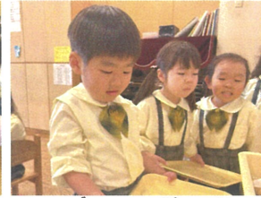
ケチャップライスが顔になって います😊どれにしようかな...