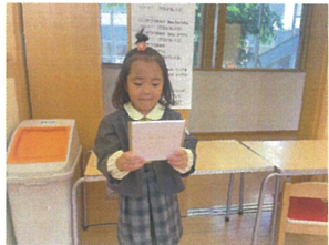
お誕生日カードを嬉しそうに見つめていた♡