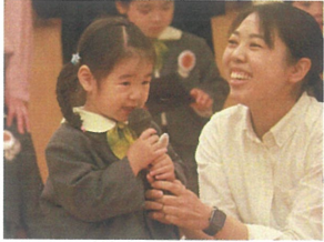
インタビュータイム 大きな声で発表出来ました!