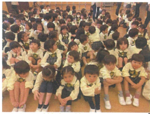
いよいよ4月生のお誕生日会 スタートですお山座り待機中