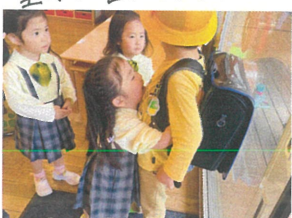
お兄ちゃんに会って おもしろ"ギュー"♡