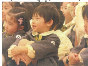
先生による優りを 鑑賞中!!