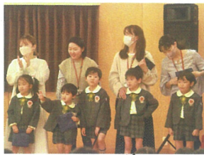
お友だちの前で インタビューがドキドキ