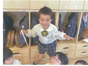
園長先生からのプレゼントを もらって喜びの舞🎶