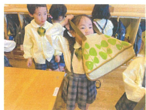
お荷物づくり中♪ なぜかふる?(笑)