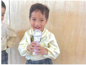
クラスでインタビューの 練習です🎤