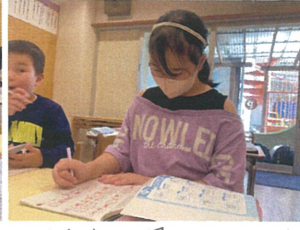
お手本を見て、ゆくり丁寧に書きます♡