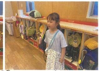
ドドモしながらも堂々と進行してくれました！