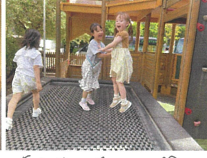
"先生、見て～♡" 楽しそうな2人です♡