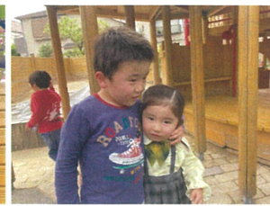
きゅん♡"アバター"に妹を見つけたよ♡