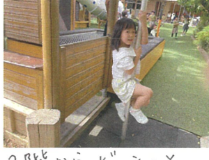
2階からビュンッと下りてきてくれました！