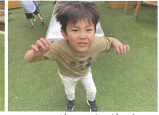
スライダーをおババァジャーニフッ♡