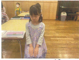
腰骨を歪めて、静かな者をききます。