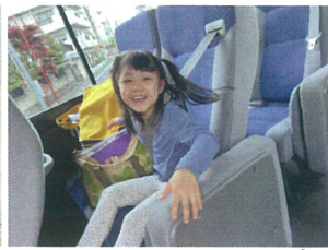
早く幼稚園に到着しないかなぁ♡