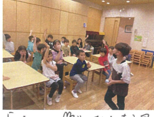
"は～い♡" みんな早く自己紹介をやりたくて仕方がない様子です(笑)