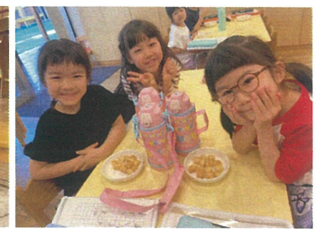
水筒がお揃い♡3人一斉で嬉しいね♡