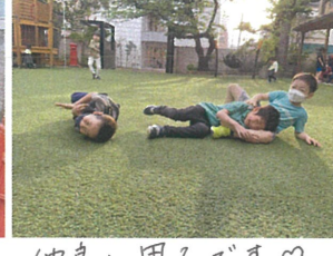
寝てから走りこさないでね～♡ ツツツしている1年生です(笑)