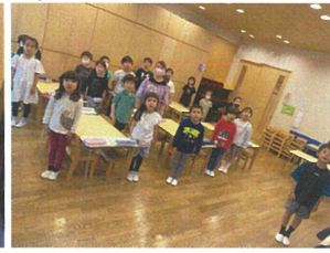
音読をしています。