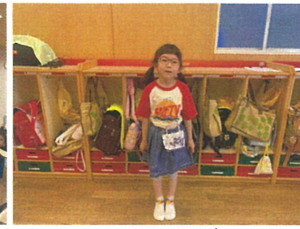
1年生にも日直をお願いしています♡