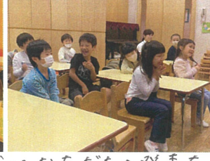
仲良し男子です♡ 笑いにろけています(笑)