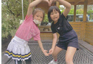
ハート... かわいすぎます。♡ 何の木かな？(笑)