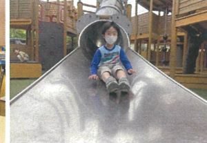
今週も楽しみなにお待ちしております♡