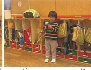
お互いの理解をより深められる時間に