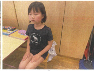
指先まで意識していますね。心を込めて... さすが2年生です♡