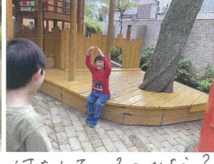
何をしているのかな？ いい笑顔です♡