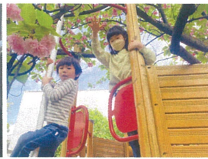
今週は、天気が良く毎日園庭に行けました♡