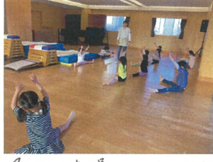
柔軟体操は、しっかり声を出しているね！