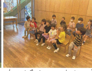
自己紹介 week ということで... 1年生は緊張気味でしたが、前に出てみると... 堂々と発表していました！