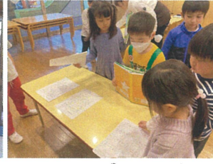
ノートとプリントは揃えて提出します♡