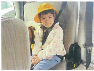
プライマリーバスは、シートベルト必須です！