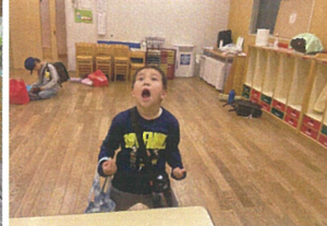
今週も楽しみなにお待ちしております♡