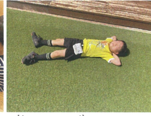
芝生にごろ～ん♡気持ちいいね♡