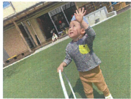
「おーい」と上空のハリコプターに。声届いたかな??