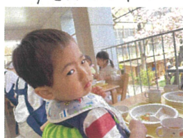
「あつこの野菜が…」目と言葉を交わしています多