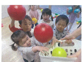
1,2歳児クラスで分かれて玉入れを行いました。1歳さんはゆくりと優しく入れ、2歳さんは...玉入れたてに馴染め(笑)でした😊