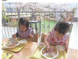
今年度、お給食は桜を見ながらテラスでいただきました♡