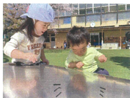
スライダーに自分が写っているのを発見★たくさんの発見があるね♡