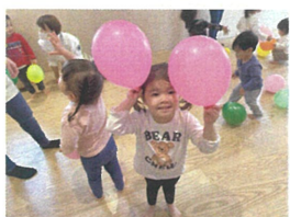
大好きなピンクの風船☆「みてみて、うさぎさん」