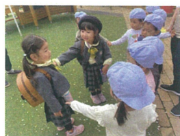
昨年夏3月末まで卒園したお友だちに会うことが出来、とても嬉しそう♡