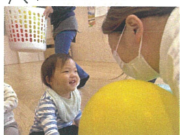
先生とお話し中♡にっこり笑顔😊