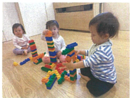
いろんな色のブロックをたくさん積み重ねて😊