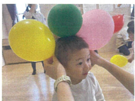
豆粒の上に3つの風船☆大!ぼくの豆粒、どうなる?