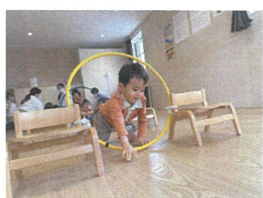
今年度初めての体操はフラフープトンネルを行いました。