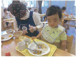
初めての給食♡食べている途中でウトウト...