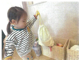
お着替えをした後、この箱に自分で入れることが出来たよ😊