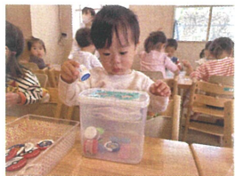
朝の知育あそび【ポットン落とし】中です。これは戻りがバラバラと止まります★