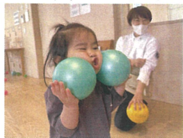
「ぶちゅー!!!」これには先生も大笑い😊