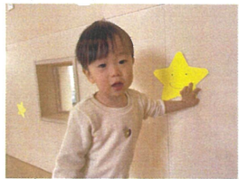
壁に貼った星の白々に「タッチ★」この星、お友だちがあるよ😊