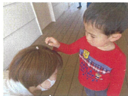
先生の頭に花びらが付いているのを発見。「とってあげるね」