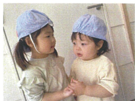
「一緒に園庭に行こうね」1歳さんに声をかけてくれています♡