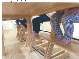
「月輪を立てまはろう」の時の足もチェックしてみると…みんなバッチリそろっています多