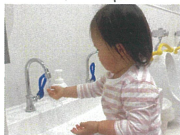
トイレに行った後は必ずせっけんを付けて手を洗います多