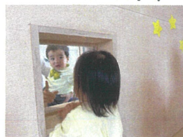
お部屋の小窓からお友だちを発見♡