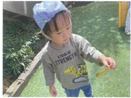
「この葉っぱ、おもしろい形をしているよ」