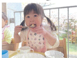
テラスで食べる給食は特別おいしいね♡