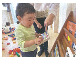
お部屋にある絵本を見て「あ!!」と何かを発見★この発見に涙も止まりました!