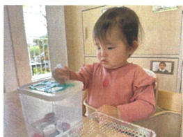
小さな穴にストローを入れることができるかな?