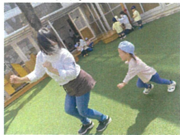
「せんせーまてー♡」おいかけて中😊