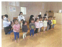
朝の知育あそびが終わったので3階に移動し【朝の会】をします各自分のマークがついている椅子に座って行っています。手のあげ方、ステキ多