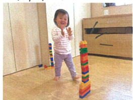
「みてみて」と☆☆☆たくさん積み重ねたね♡