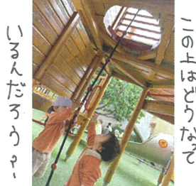
いるんだらう? 指さしています😊