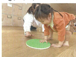
ゴールにあるマットにタッチ☆☆☆