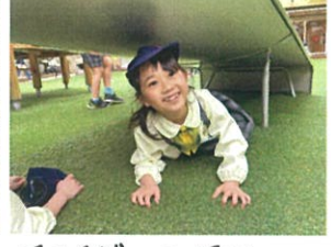
スライダーの下に...ゴロゴロしていたせいです。