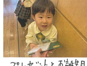
プレゼントとお誕生日カード貰ったよ。