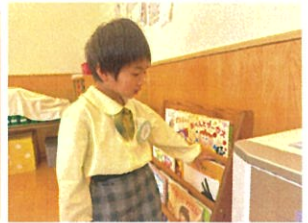
うん...じの絵本も 読もうかな～