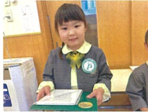
クラスに戻って、サンゴで お祝いしました♪