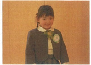
お誕生日会!! ドキドキの入場です!!