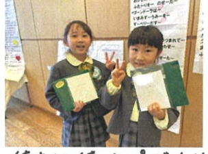
待ちに待ったプレゼント!! ずっと大七のに伊って下さい。