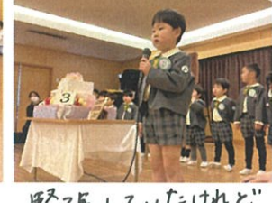
緊張してはいたけれど発表頑張りました。