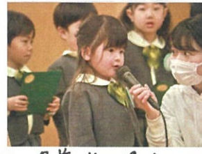
クラスと名前、お名前を 食べ物でインタビュー◎