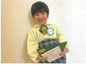
ずっと欲しかったプレゼント!! 嬉しかったよ♪