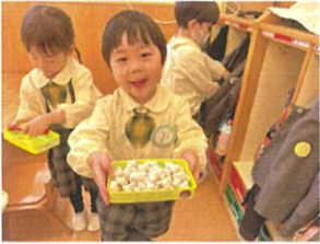
はい!! 先生にあげるの おまんじゅうだよ～