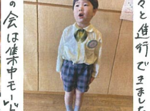
朝の会は集中モード。気付け、姿勢バツナリ。