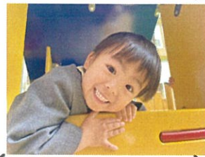
いらっせいませ～!! ピンポンしてくださーい!