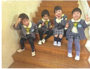
トビーズクラスの3月生まれのお友だち♪