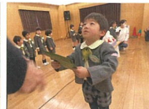
大きなバッジをもらって 嬉しいポーズ☆ 音読にも真剣りに 取り組んでいます☆ お誕生会の前に クラスで練習しました! ドキドキしながら インタビューに答えます☆ しっかりと目を見て 「ありがとうございませう」