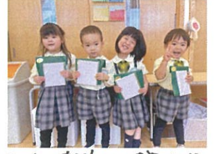
ステキなお姉さん、お兄さん になってね◎