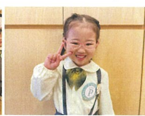
3月生まれのお友達☆ 待ちに待ったお誕生会♪ ケーキの前もうれしいね☆ 頑張りにこは「ママのお手伝い」 頑張りにこは 「とが箱 跳ぶこび側車!!」 3月2日で5才になります!! Happy Birthday♡