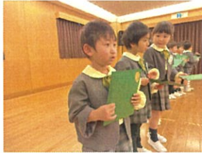
全学年の前で 緊張ぎみ...