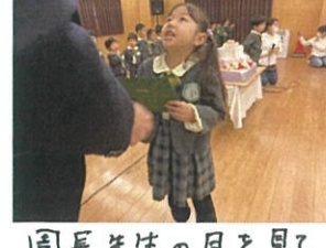
園長先生の目を見てお礼が言えました。