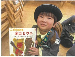
オニとワニはいい!! お誕生日のお友だちプレゼントの 絵本を読ませました◎