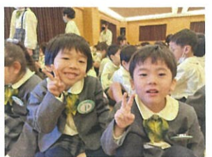
3月生まれの2人で「はい、ホース」