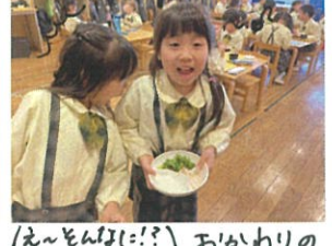
は〜んね!! あかかりのフロックリ-が沢山。