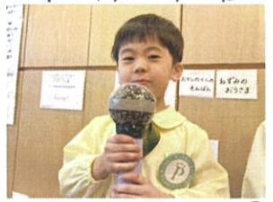
クラスのインディタイム。お話しは7はしんちで。