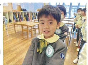
お誕生日会へLet's go!! 先生の前でドキドキ楽しみだね。堂々とお話出来ました♪