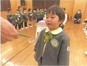
園長先生からプレゼントも 頂きました♡♡♡