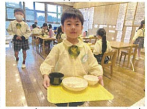
全部食べませす。お皿ヒカヒカ綺麗に食べませす。ニコニコ笑顔