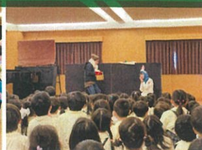
3月生まれの人と2月生まれの人 入場完了!!これから クラスと名前、5才にまつて フォトプレゼントうれしいね☆ 今日の劇は「親切な友達」で、これで全員もらえます!! 年中クラス前の本棚に絵本の