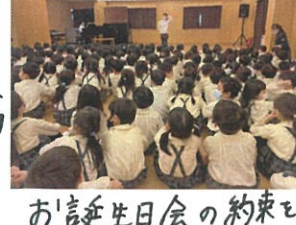
お誕生日会の約束を先生と確認して...