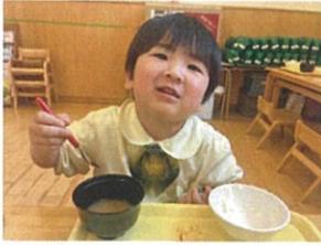
今日の給食は、お汁が 1番おいしいそう♪