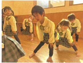
トビーズクラス サーキットに向けて!!