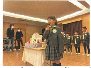
年長見らしい姿を見せてくれた2人。成長を感じて喜ばしい気持ちになりました。