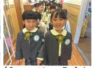
今からお誕生日会だよ！とくべんな日ですな。