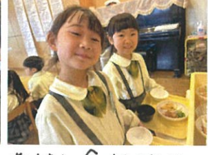
たくさん食べるようになりましたね！！