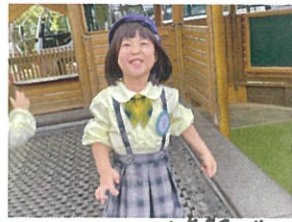
ニコニコの笑顔が とってもキュート♡