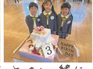
ケーキと一緒にニコニコ笑顔で。