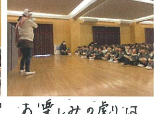
お楽しみのはしんちのはしんち。