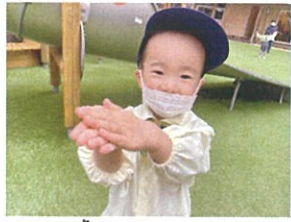
お待たせしました～!! お寿司です◎