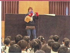
先生からのおプレゼントは "しんせつなともだち"の扉♪