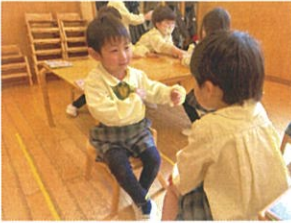
今日はね、僕の誕生日!! お友だちにお話中♪