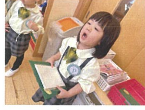
アキラマリンクラスの お友だちと改めましてお祝い◎