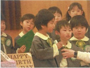
大きな声でインタビュー 行くことができてきました!!