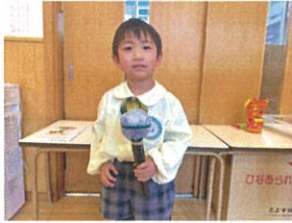
お誕生日会に 向けてクラスでインタビュー