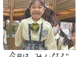
今日はみんなごトランポリン。