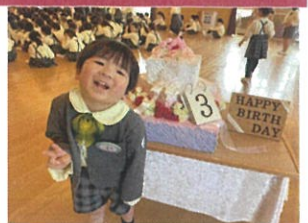
サンゴクラス ケーキをひひひ♡