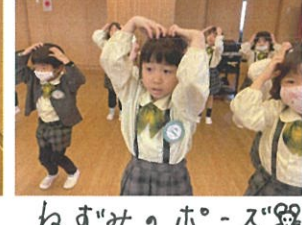
ねずみのホースになりまして踊っています。