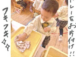
フキフキ ニミまだ付いてる～!!