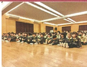
2月の月の会本日がここでも あり、真剣に入っています◎