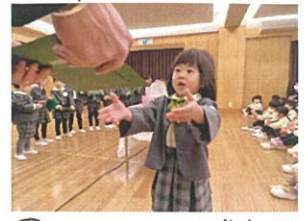
園長先生、ありがとうございます!! 両手でしっかりと受け取ります。