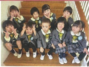
3月生まれのお友だち 全員集合～!! ★