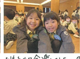
お誕生日会楽しかったです。