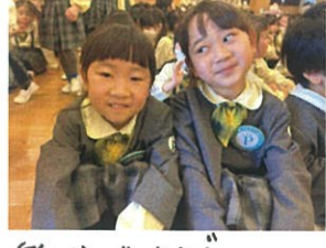
楽しかったよ！よかったね。