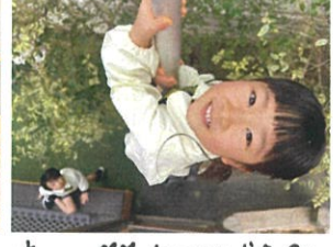
キャー♡カワイイです♡気を付けてね〜