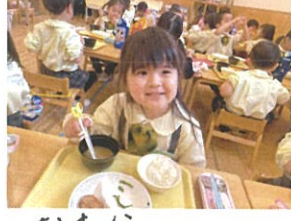
お味噌汁、 温かくておいしい♡