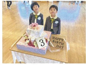
お誕生日おめでとうございませす。6歳の目標達成できませすように美味しく食べませす。