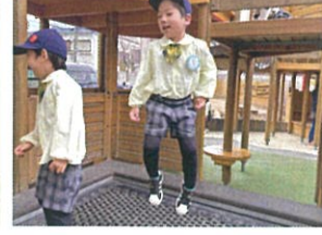
お誕生会があったので 1日ルンルンです☆ /おかわりに行って、 参ります! たわとびを使って 電車ごっこ 大好きなトランポリンで 全カジャン♪