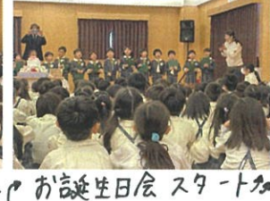
お誕生日会スタート。歌でもお祝いしました。