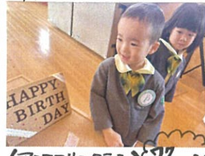
くアアマリンクラス これからお誕生日会が始まります!!