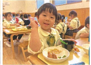
おかわりいっぱい すました～★★