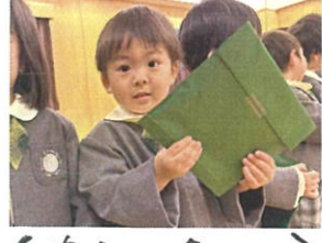
やったー プレゼントもらっただよ!!