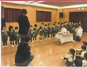
ドキドキのインタビューが きかんと答えられました◎