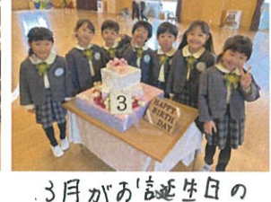
3月のお誕生日のみんなご。