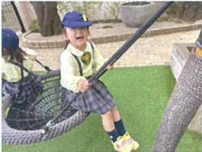
大好きなゆりかご スイングでハッピー♪