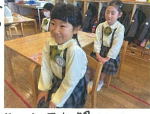
あぁ！目を開けたらカメラがあった(笑)