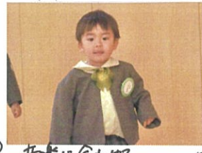
音楽に合わせて 入場です◎