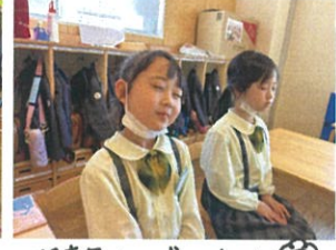
姿勢もバツナリさすがですな〜