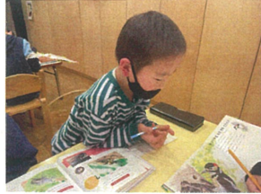
今回の絵画は、自分の 好きな図鑑から描きたいものを