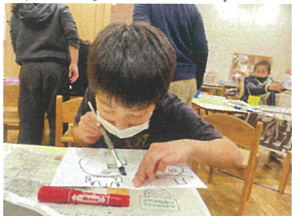
集中して作っています。