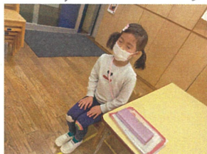
さすかプロライマリーさんの 全員素敵は凄いです!