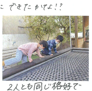
2人とも同じ格好で "よいしょ"