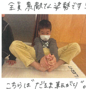
こちらは"ごま車遊び" 意外に難しいです!!