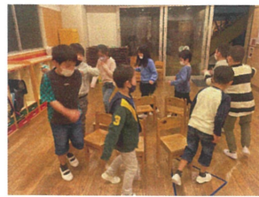
曲に合わせて踊りながら イス取りゲームSTART!!