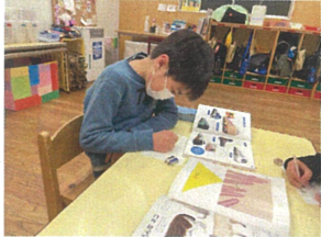
1つ1つよく見て丁寧に描き、色も付けて完成 しました!! リアルです。