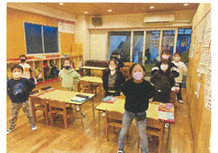
図鑑とにらめっこ... クワガタタイム!!