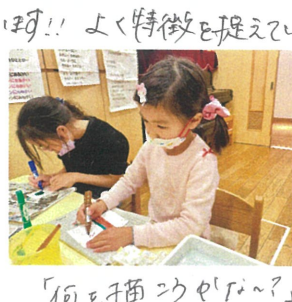
"何を描くのかな?" 考えながら描いています。