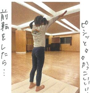
前転をしたら... ボールまできりと★