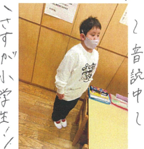
さすか小学生の "気まぐれ"がスタート