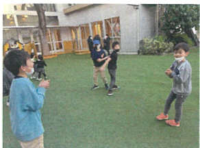
増えオニが始まります!! "今年の目標"をテーマに 作文を書きました。