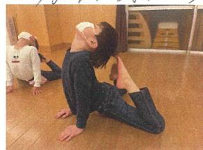
アガらしとブリッジ対決をしました!! 誰が1番綺麗にできたかな?!