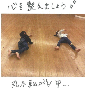
丸太車遊び中... 1本を伸ばして車遊びます。