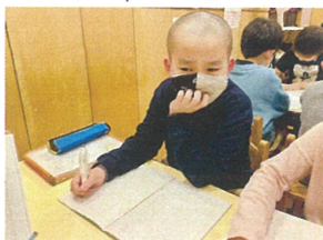
増えオニが始まります!! "今年の目標"をテーマに 作文を書きました。