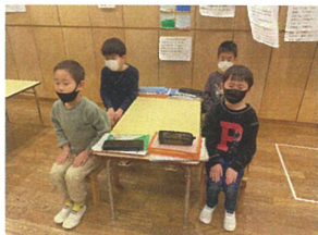
腰骨を立てて... 心を整えましょう。