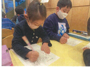
始めの相図で一斉に スタート。「マス計算」