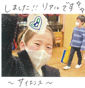
～サイエンス～ 水にワタを破れるか? 紙の実験!