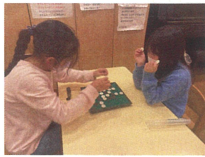
オセロ対決☆さて、 どちらが勝つでしょう。