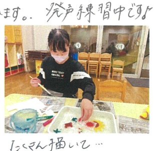
水にワタを破れるか? 紙の実験!