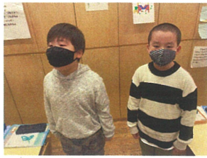
目と鼻をしっかりと向けて 音読に集中です。