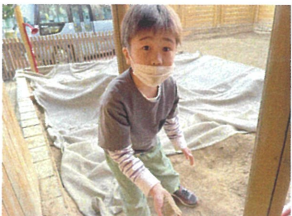
砂をツリーハウスの 2階に運んでいます。