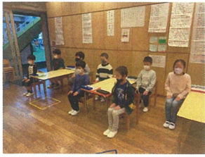
腰骨だけでなく、指先まで... 気持ちが表れています。