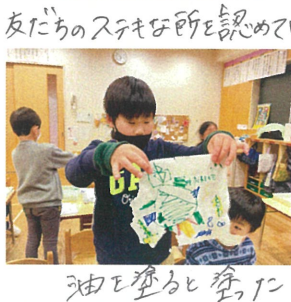
油を塗ると塗りに 水はワタを破れず残ります!!