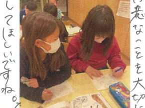
図鑑とにらめっこ... クワガタタイム!!