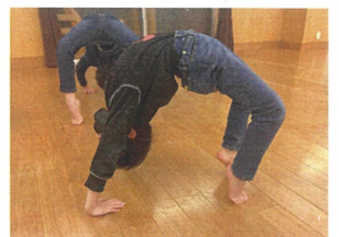
アガらしとブリッジ対決をしました!! 誰が1番綺麗にできたかな?!