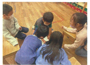
2チームに分かれて "連想ゲーム"