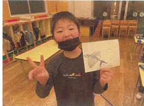
友だちのステキな所を認めています!! よく特徴を捉えています。