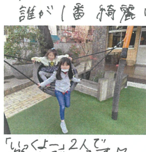
"いっしょに2人で 楽しんでいきます"