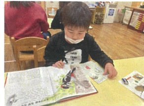
図鑑とにらめっこ... クワガタタイム!!