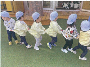
ルクルラス入場です 〈かけこ〉よーいどん!