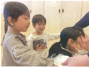
〈かごめかごめ〉=チャレンジ 「だ〜れた!」