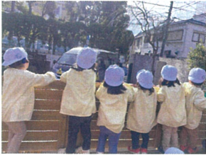
あは? バス行っちゃった? あ! また戻ってきたよ!