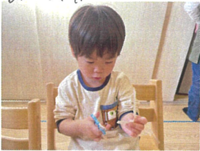
月餅を(開)め 下からまっすぐ千切千切