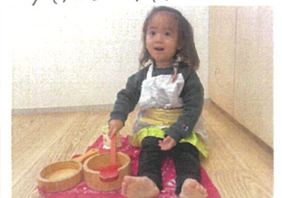
ピクニックから? 自分で用意したの♡