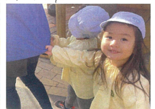
先生電車出発進行!!