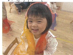
どうぞ召し上がれ おもちゃがよーん