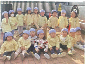
全員で110シャリッ! おもちゃ食べてみたくなった♡