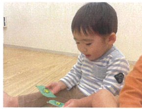
「あつたよ! カムシ!」 同じカードを見つけました