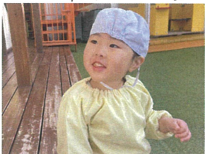
来年はおもち食へて みたいな♡