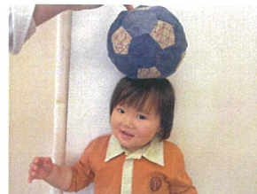
雪だるまになっちゃった とっもキュート♡