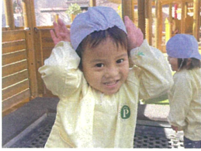
ひんひん トランポリンに うさぎさんがいました♡