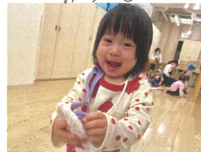
お医者さんです うさぎさん元気ですか?