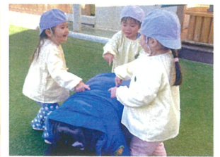
〈ダンゴムシ鬼ごっこ〉 リニーン! 「起きて!」