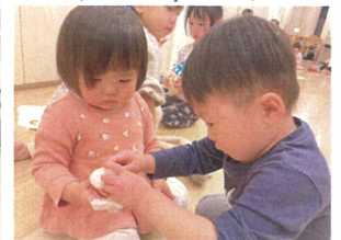
指に包帯を付けて 今やっているから待つてね♡