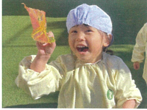
大きくてキレイな葉っぱは おばけさん作ってもらったの♡