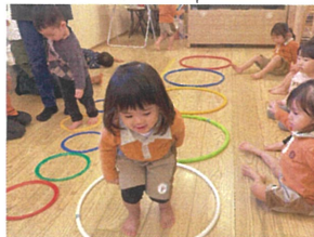
ドレミファソラシドは8個! 音に合わせてせーのジャンプ!