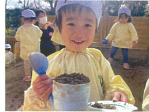
今年も大人気の子感 お砂遊び