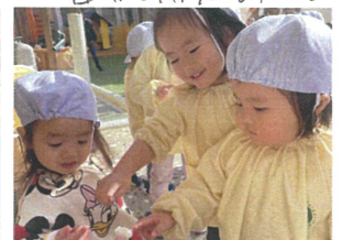
先生電車出発進行!!