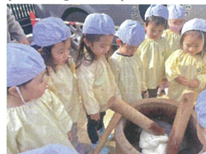
お父さん・お母さんがつきたおもちゃを 近くに行くと見せてもらいました