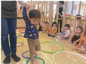
今年最新のリトミック♪ 何か始めるとドキドキ