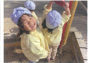
「おーい! たんかん!」 もしもしテレビフォン