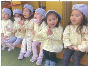
バブルグラスみんな 「がんばれ〜!」