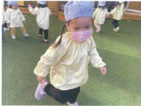
〈オカシム今何時?〉 食べらぬさ〜!!