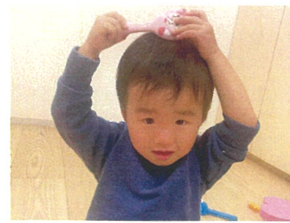
髪を自分でとかしてまた ブラッシングでさらさらにな