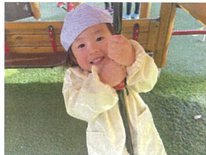
きゅっ! 木に抱きつこ コアラさんみたい♡