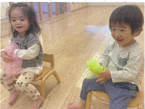
スクーフでリトミック♪ おもちゃコネコネコロコロ