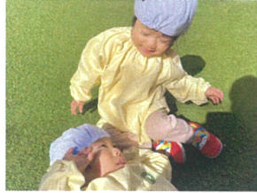
芝生でゴゾリンしているの 「起せ!」と高っています(笑)