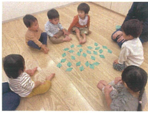
〈神経衰弱〉やっています 自分の番までじっと待ちます