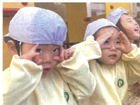
よーい見てみようポーズ 〈おもちゃつき〉