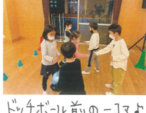
ドッジボール前の-Jマ♪