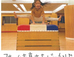
フォームも高さもバッチリ♪ 次の目標は9段