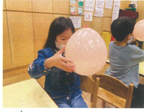
月並みかませた風船を 回転1円玉はどうなるかな?