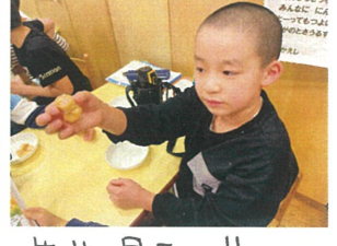
先生、見てー!! 雪だるま発見!!