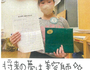
将来の夢は美容師