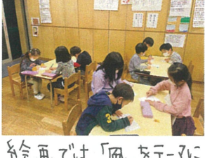
絵画では、「風」をテーマに 絵を描きました