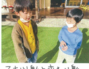
こおり船と変わり船 どっちがいい?!