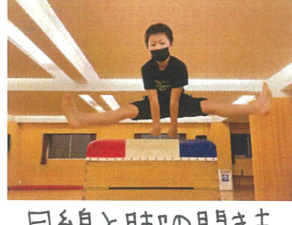
目鼻と脚の開きも とても綺麗