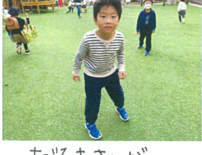
たろまさんが... 車んた!!