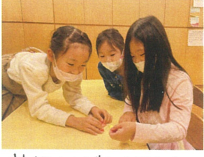
サイエンスでは、1円玉と 風船を使った実験