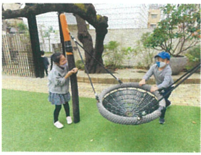
何から2人で 語り合っています