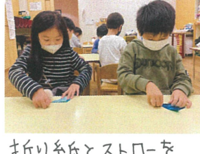
折り紙とストローを 使ってロケット作り