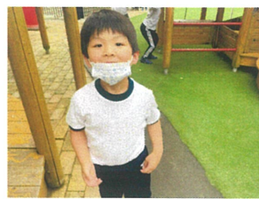
あ〜暑い!!と... 風邪引かないでね