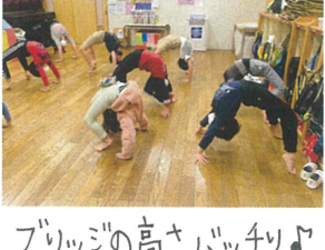
ブリッジの高さバッチリ♪