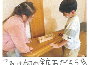
これは何の金店石だろう?