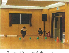
この日の活動は オセロタッシュ=3