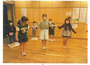
リクエストで楽器関係の 手を繋いでバランスを