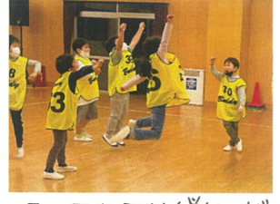
この日もアツイ戦いが 行われました