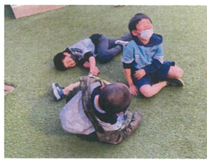
楽しそうなる人組♪ 笑いが止まりません!!