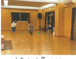
一人ひとり負けない 気持ちが伝わってきます