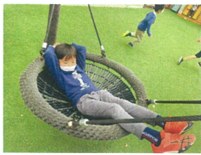
ゆりかごスイングの中で ぐっすり中(笑)