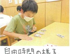
自由時間の様子。 とても真剣!!