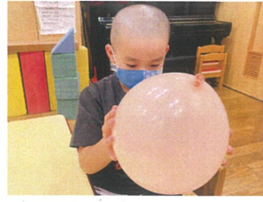
おおど勢いよく回る 1円玉に興味津々