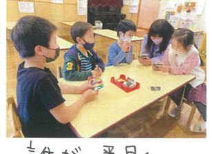
誰が一番早く 上がるかな?