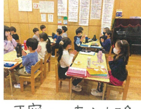
丁寧に心を込めて いただきます