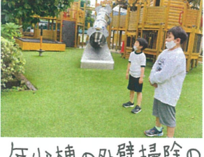
年少棟の外壁掃除の 様子を見学中