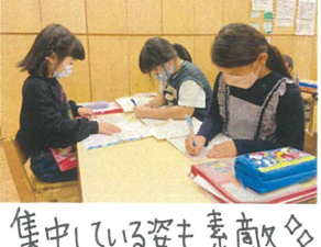
集中している姿も素敵