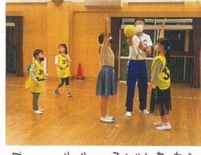
久々にバディの子どもたちと ドッジボール大会!!