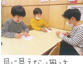
目に見えない風は どんなイメージかな?