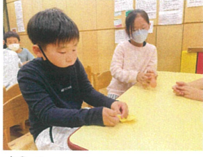
風船の中に1円玉を 入れるの難し