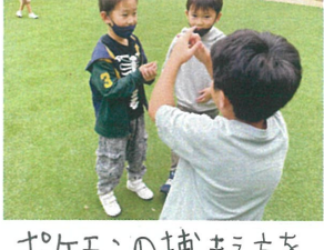
ポケモンの捕まえ方を 伝授しています