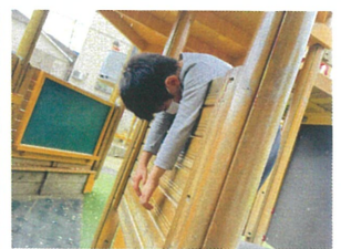
洗濯機物の気持ち イ本馬中(笑)