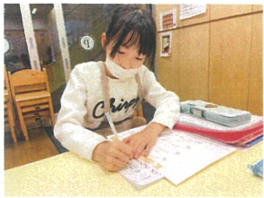
勉強タイム 集中して取り組んでいます!