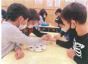
どの調味料が 一番ピカピカになったかな?