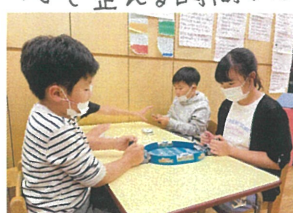
大人気のサッカーゲーム 次にシュートを決めるのは...