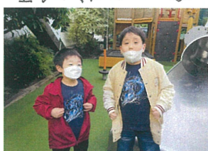
偶然、同じ服を 着ていた2人