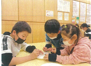
言調味料を使って 10円玉をピカピカに