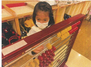
上糸反生に負けない位 真剣です!