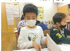
カキカタは見方を 見ながら丁寧に