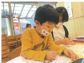
今日の宿題は 大好きな漢字