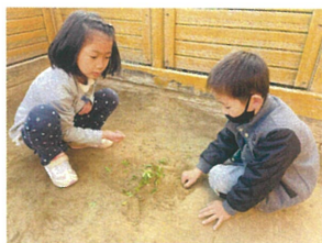
ここはきな粉畑 たそがて