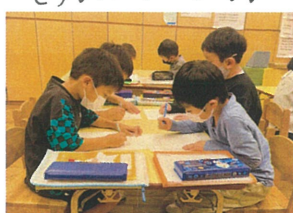
マス計算の時間 タイムは果して...