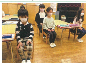
クラブタイム前の様子。 心を整える時間です。