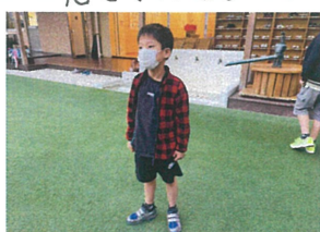
5, 6, 7, 8, 9, 10... もういいかい??