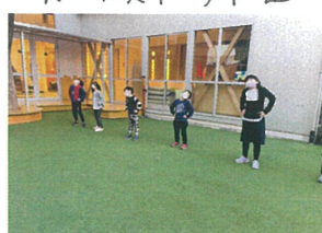
この日は園庭で サーキットを行いました