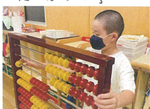
少し緊張しているかな?