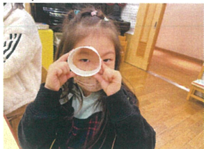
こうすると大きな メガネになるよ