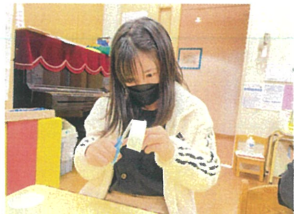
工作では紙飛行機を 利用したロケット作り