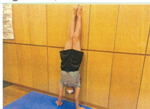
壁逆立ちのお手本を 見せてくれました