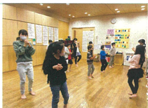
柔軟体操の様子 一つ一つ丁寧に。