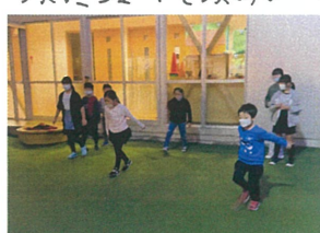
傾り車も元気がいいです!