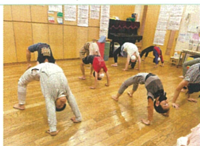
ブリッジ、30秒間 キープ! 頑張れー!!