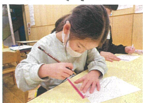
糸画では直糸を使って トリックアートに挑戦!