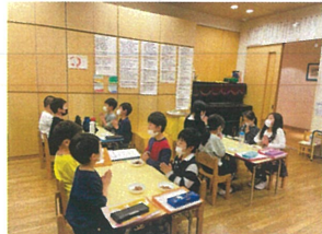
腰骨を立て下さい! 手を合わせて下さい!