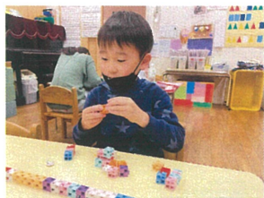
何を作ろうかな♪ 完成が楽しみです