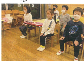
とても素敵な姿勢