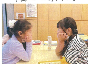
仲よし2人組♪ ガールズトワーク中