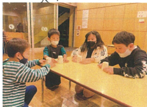
ロケット完成 どんな風に飛ぶかな?