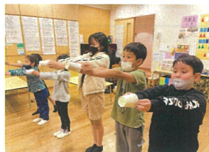
様々な角度から 飛び方を観察