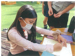
青空の下で 園庭 スケッチ