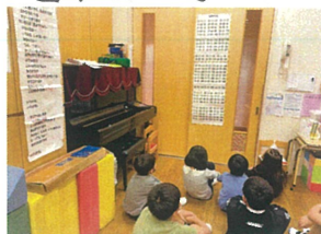
九九の歌々リズムも バッチリです