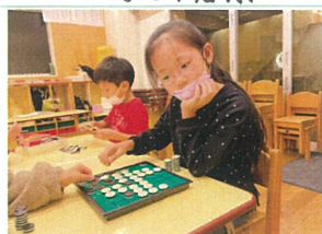
次はどこに置こうかな。 小凶ななあ...