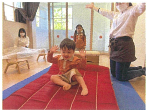
「おあ!!」 おいぞ着地しちゃったおあ」