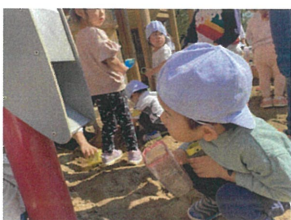
「おすな、みてくるかな?」 のぞいています◎