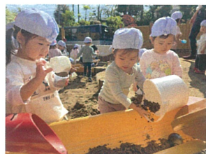
「ここにおすな いれちゃおと☆☆☆」