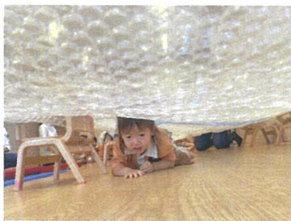
フチフチマットの下をハイハイで進みます♪なんかキラキラしているわ♡ そんな不思議なマットの下を、当たらないように進んでいるみんなでした☆