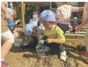
久しぶりにお砂場あそびを行いました♡ 色々な道具を使って、お弁当ごはんを作っていました♡