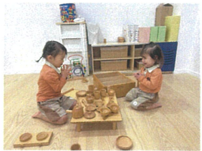
おままごと中...♡ 「ごいしょにいただきます」