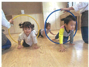
途中でフラーフがあって くぐります~◎