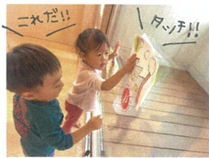
「すうじのうた」のカード お原貝いされた数字を タッチ☆☆☆