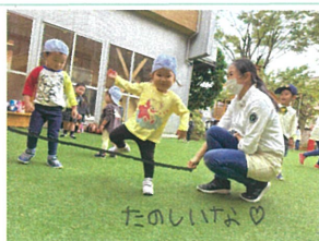
自由遊びのときも、 ゴムヒモのところに 来てくれました♡