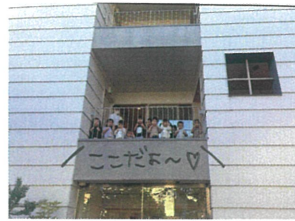
Qみんなは、どこに いるぞいーか?!