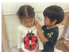
「このボタン、 やってあげるね◎」