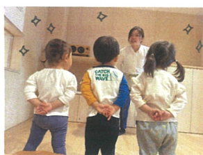
歌の姿勢☆ 後ろの手がステキです♡