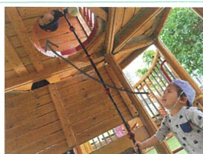
「うえにおにいさんが いるね!!」発見~