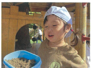
「おばんどうつくったの♡」 いっしょに入っているね◎