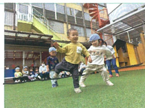
「足あたちやうえ~◎」 よく見てねえ♡