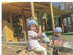
ちおこんと座って います♡