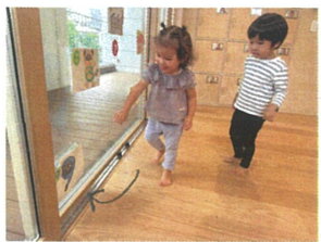
「あつたあつたあつた」 見つけることできた◎