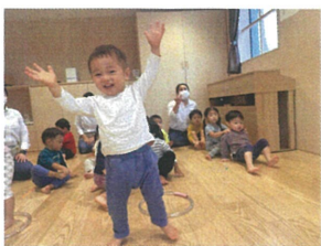
1番に到着して やったあ♡大喜び♪