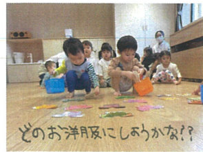
どのお洋服及にしらふかな?!