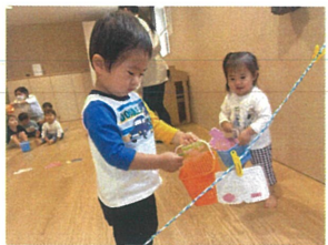
洗濯ばさみを使って洗濯物(お洋服)を干したり取りこんだりしました◎ このお洋服も1ヶ月前フィンガーペインティングの際に色づけしたもので♡とてもカラフル♡