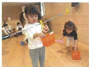
洗濯ばさみも上手に♡ おうちのお馴染いもリッチかな?