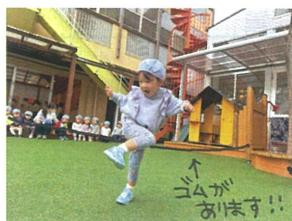
「1つおにこんのいり、ゴムの位置をよーく見て またいだり、くぐったり♪足をめいりおい上げています♪