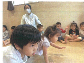
ハイハイ競争中☆ スタートの瞬間です!真剣☆☆