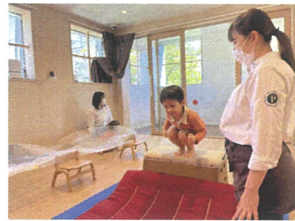
同じ箱からジャンプ☆ 「1くぞー...♡」