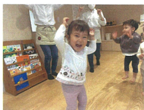
リトミック中◎ うさぎさんに変身中♪