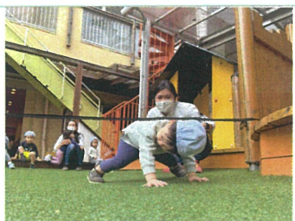
「あ!あ! 背中に ゴムがあ...!!!」 このあ、背中にあたってしまったので くすぐられています~◎