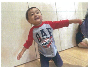
「やったあ♡」喜んで なんと1仕~♪