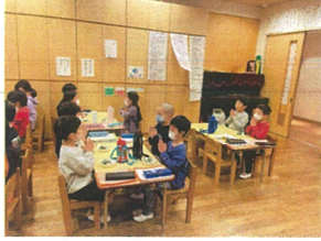
感謝の気持ちを込めて 食前のご挨拶