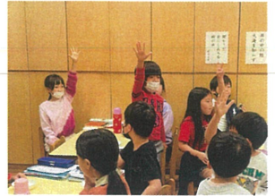
おかわりジャンケンタイムよ 食谷の秋です