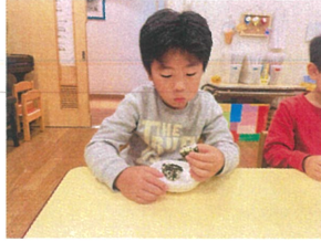
今日のおやつは大気の のりおにぎりです