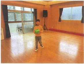
みんなが帰って来るまで キャッチボールしようよ