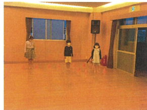
年長さんにも上級生と 一緒にタッシュに排単