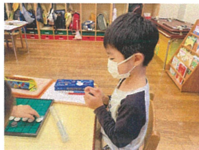
ソアはどこに置こうかな。