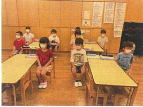
クラブタイム前の様子 指先、足先まで素敵