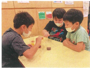
びたごきをタタ含む果物を 言周る実馬食をしました