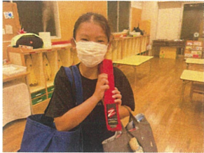
空手の昇級試合で 赤帯になったよ