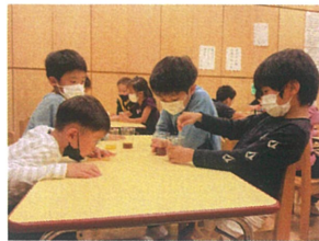
うがい薬とオレジジュースを 混ぜると...どうなるかな?