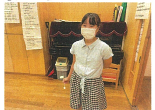
少し照れている姿も 素敵です