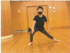
空手の型を孝々えて くれました!! かわいい