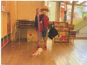
小学校で犬を作ったよ