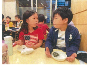
まだおかわりあるかな? ？ もって食べたい!! 笛