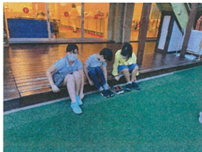
先生~! 一緒に遊ぼうよ