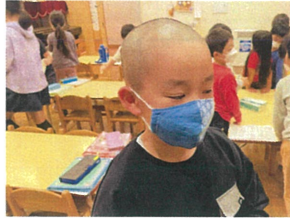
小学校の宿題が タタすぎる