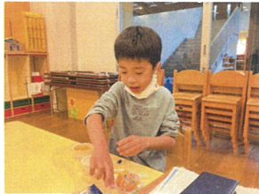
オレジゼリ-美味しい 何個でも食べれちゃうよ