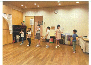
ストロー飛行機完成 誰が一番遠くに飛ばせるかな?