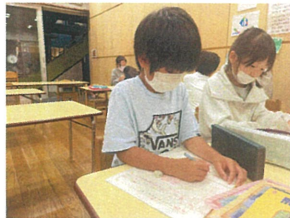
作文では、体験見学会で 見せたい姿について書きました!