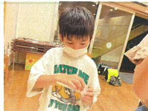
こうやってくっつけてと... とても手先が器用です!!