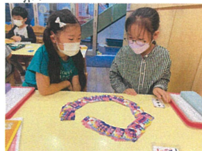
とても真実な表情で トリアプを見つめています。