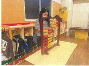
本日の日直さんよ 白玉そろばん姿もさすが!!