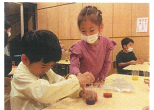
体験見学会に来てくれた 年長さんも興味深々よ