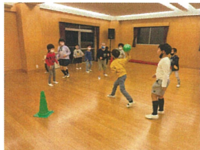
クワのドッジボール!! いつでも全かです