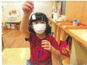
この部分、よく見ると ペン立てみたい