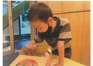
どの消しゴムにしようかな? これもいいなあ