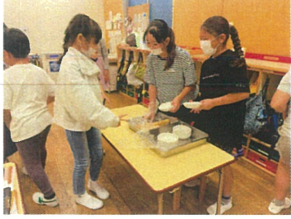
いつもお手伝いを ありがとう