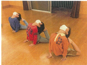
とても綺麗な アサラミポーズ