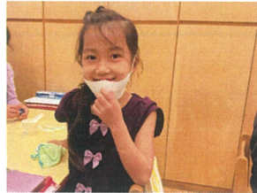
写真撮って~よと 可愛い笑顔