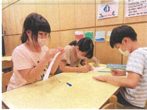
工作では、ストローを使って 飛行機を作りましたよ