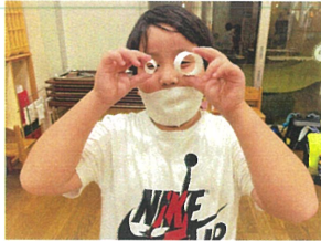
先生~!! 見て見てよ 大きさが違うメがネ(笑)