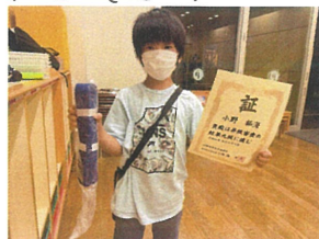
空手九段、おめでとう