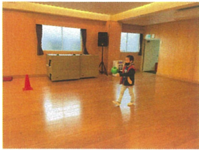
いくよー!! 上手に 投げられるかな? 笛