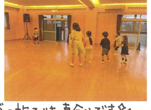
遊びも真食りです♡