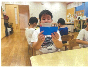
まずは折り紙を半分に分ります!と解説中(笑)