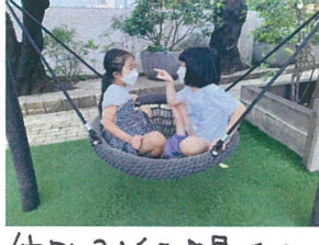
仲よし2人組♪最近のゲームはあ、ち向いてホイ!