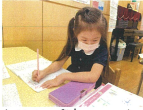
上級生の漢字プリントをチャレンジ♪楽しんでる