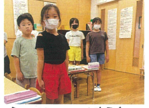
クラブタイムの様子♪集中している姿も素敵♡