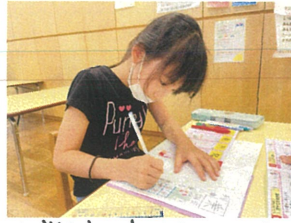
小学校の宿題も少しずつ増えているようです...