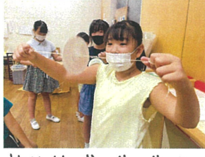
先生!! ブンブンゴマを上手に回すコツ発見しました!