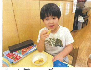
さつま芋もち美味しい♪とってもいい笑顔♡