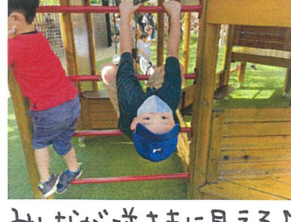
みんなが逆さまに見える♪