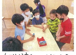
何やら新しいUNOのルールを思いついたようです。