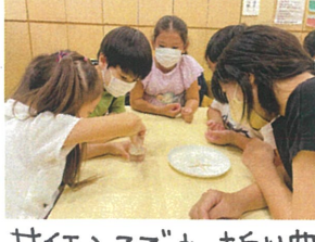
サイエンスでは、折り曲げた爪楊枝に水を垂らしたらどんな反応が起きるのかについて実験しました!