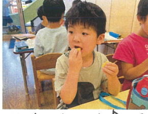
モグモグタイム♪食べる手が止まりません