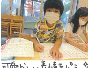
可愛い表情をパシャ♡