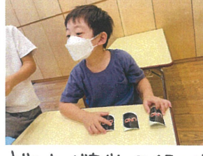
どのカードを出してくるのが気になるようです