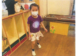
もうすぐ、バレエの発表会があるから練習してるの♪