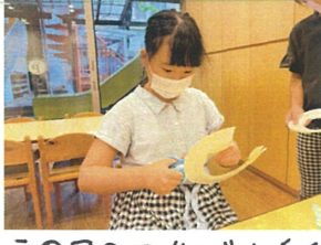
この日の工作では、糸糸皿と刺糸糸を使ってブンブンゴマを作りました!みんな真食りです♡