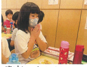
感謝の気持ちを込めて、いただきます♡