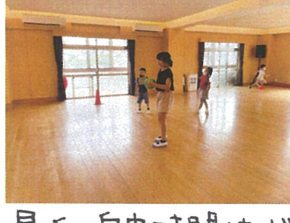
最近の自由時間は、ドッジボールと同じ立、テンカが大人気♪この日もアツイ単独が行われました!!