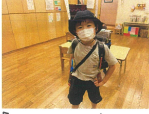
「先生〜!! ランドセルが重すぎて前に進めません」