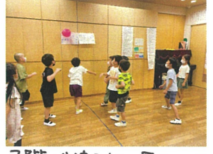
3階が使えない日の-3階、風船バレーに夢中です♡