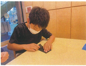
工作では、子どもたちの大好きな折り紙を使って飛行機ブームランを作りました♪上手に出来たかな?