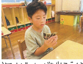
次はどのカードを出そうか♪小盗み中...