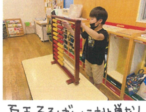
百玉そろばんに挑戦♪