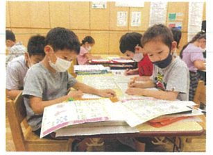
カキカタの日時間も集中して取り組んでいます!!