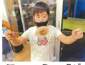
回るゴマを見つめ過ぎて目が回ったようです(笑)