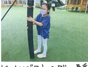
ゆりかごスウィングの順番待ちをしながらしりとりの中♪