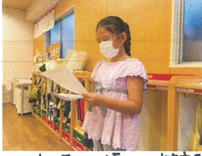
いつも明るく優しい笑の先生の〇〇ちゃん♪将来の夢はキャビンアテンダント♪英語のアナウンスも素敵でした♡