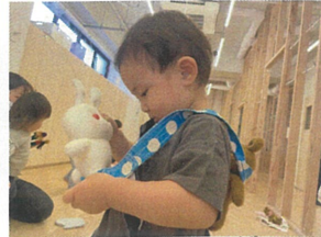
うさぎさん、今日はボクが てらこにあげるね