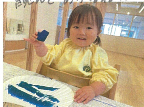
おあ〜絵の具が 付いたよ!! キレイ