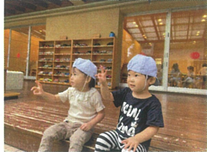
『今、2時!!』 ピースもかわいい♡