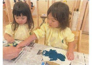
きるとおどりの絵の具を 付けると... 色が変わったよ!!