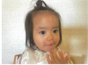
お昼寝のあとは... 楽しめのおやつ。本日のメニューは いちごシリアル入り パンケーキ。今日は ホイップクリーム付き。あつという間に完食でした。