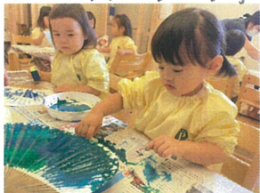
白い戸竹を残さないように... ボンボン... 完成せよ