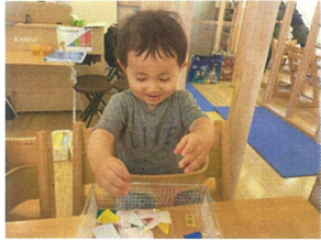
これまたあつひり 草鞋しい... 『ちぎる』 親指と人差し指を上手に使って... 出来た!!