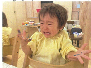
おあ〜絵の具が手に 付いたのどうしよう...