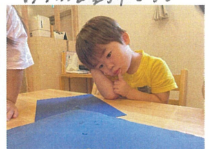
今週は かつむりさんが Baby Pearl Nursery に遊びに来てくれました。先生たちもこは大きな かつむりを見るのは 初めてです。どうやって動いているのかな? あつ!! 目があつたよ!! かつむりが歩いた後は道が出来てキラキラしているネ