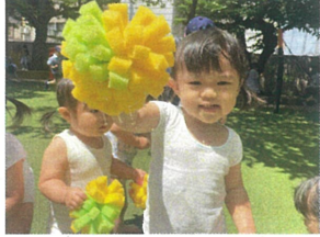
手作りスポンジが大人気!! お水のシャワー作りたいね