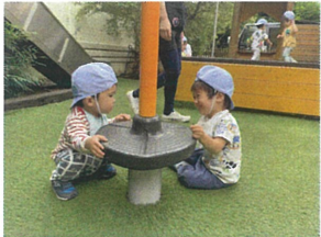
ボクが回してあげようか? ターニングおにぎりだね