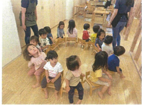
いすとりゲーム、スタート!! 今日のチャンピオンは誰かな?!