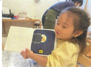
いつもママや先生が読んで くれるけど... 今日は私が 読んであげるね!!