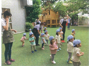
お友達と一緒に... 『おおかみさん、今何時?』