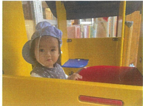
私のおうち... 先生もどうぞー!!