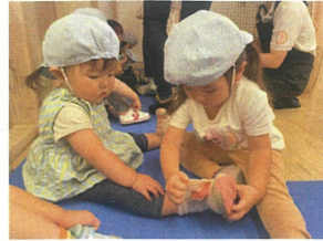
手伝ってあげるね!! バリンさん ありがとう♡