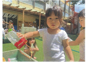
お天気が良くて... お水がきもちいいよ↑↑