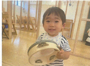
ダンバリンのモイけ音が あるね