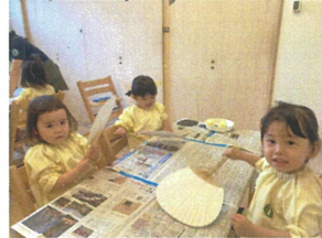
うわあ、風が きもちいいよ↑↑