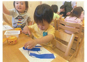
とても集中しているね。お のりの活動中です。