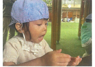
何を手にしているの思いついた? 午中にはダンゴ虫あつ逃げあつ