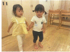
もうすぐ 園庭に行く時間 だから一緒に行く♡♡