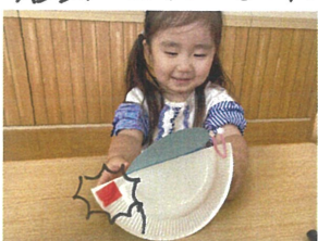
「おお〜!!」といりアクション♡ ゆらゆら 「これ、なあに?」 お誕生日会の出し物です。 なたつむりの完成♡ 興味津々です(笑)