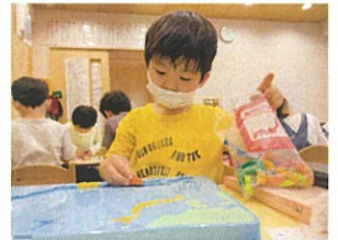
日本地図のパズルに挑戦!