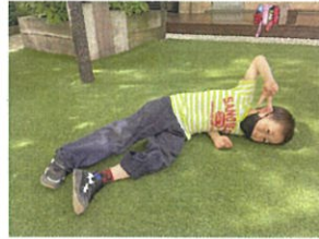
日向ぼこ中...多カメラを向ける 前からポーズをしてくれました!