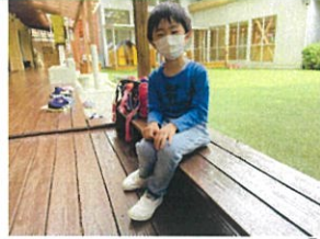
今日、小学校でみまの種 植えたよ!と嬉しそう表情多