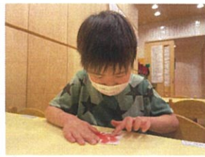
糸画では、「海の生き物」をテーマにクレヨンを使い 1冊かき絵に挑戦!多素直な糸画が完成しました!