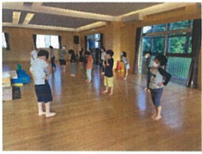
運動前の柔軟体操も 少しずつ整ってきました!!