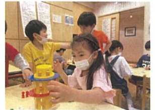
真実な素直でバランス ゲーム多ドキドキ