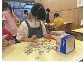
自由時間の様子多子どもたちそれぞれ色々な 遊びをしながら楽しい時間を過ごしていますよ