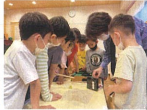
園長先生より、アライマリーの子と子どもたちへ「ビツカード」 をプレゼントしてくださいました多みんな興味深々