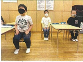
クラブタイムが始まる前の 姿勢もとても素敵です多