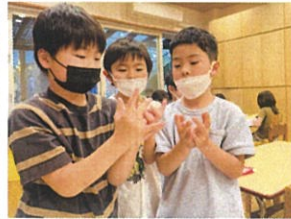
お友達にカエルの作り方を 教えています!出来たかな?