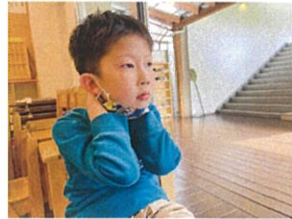
「先生~、わ~♪」と 可愛らしい笑顔を見せてくれました!