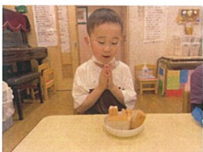
食前の挨拶も心を込めて多