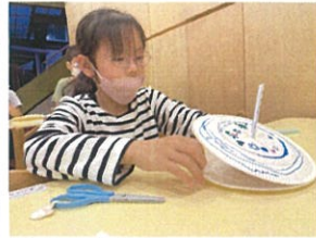
工作では糸画とストローを使い、コマを作りましたよ 最後はみんなでコマ回し対決!!。1位は誰かな?