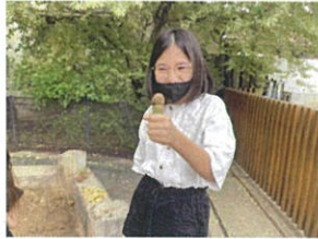
石土場にアイス屋さん多「OOく、早く来ないかな多 」本日のオススメはいちご味です!