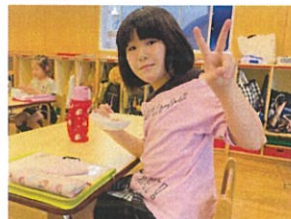
素敵な笑顔を見せました!