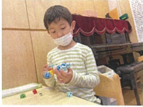
フックとおはじきを使い 上手に車を作っています多