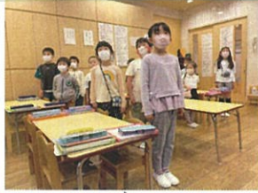
音読も丁寧に心を 込めて全力です多