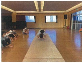
この日の活重がマット運動を行いました!1年生は 初めての前転で多上級生を見本に一懸命頑張りました!