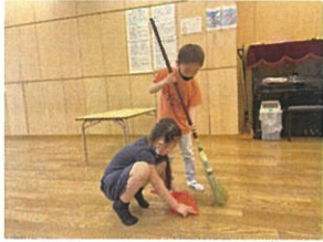
一糸着にワラの掃除を お手伝いしてくれました多