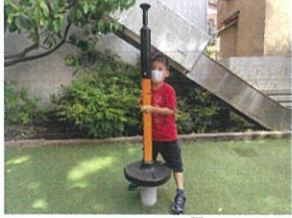
「先生ー!!これに乗ると アメリカまで行けるんだよ」