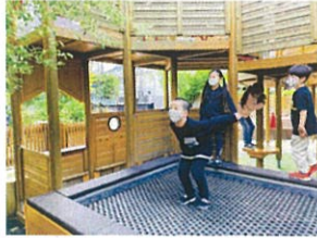
「先生ー!!ボクこの葉っぱに タッチできるように、なれたよ多」