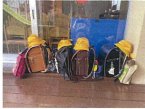
1年生のランドセル多 とてもキレイに並んでいます!!