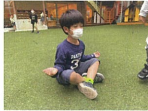
オコごこ前のコマ...多 集中力を高めています多