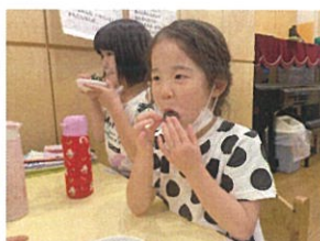
「おにぎり美味しい~♪」「ボク、蒸しパン大好き多」