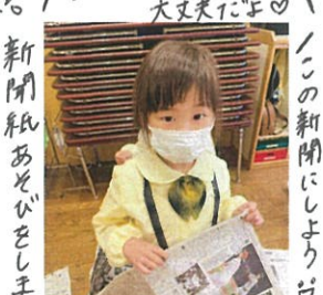
新聞紙あそびをしました。 先生見てさうぞ