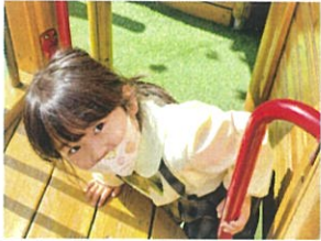
「待つてん!」と先生を 追いかつてハハハ