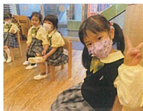
あんなおもしろい遊びはよ かったね◎