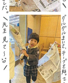
「新聞紙あそびの時のクラスの様子」 「ブルブルまじり、テープを貼ってミ」