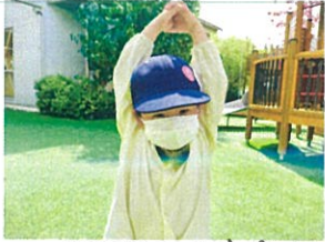
バタバタに大変身! バタバタの最中じゆん(笑)