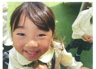
ねえねえ せんせいさいて!!