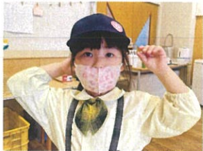
クラスメートのプレゼント ホールのガラスも! おいおい