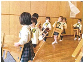
イスも大きくはりました 片の方向を向き、列に並んで おやつ中じゆん!