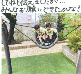
登園の時は大泣きだったけど... すぐに笑顔に◎元気に 遊んでいます!