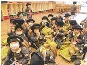
おんせいの おんせいの