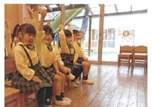
皆質問がたくさんあるよ です