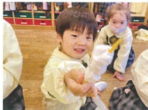
おんせいの おんせいの