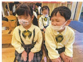
③ すばやく朝の会の準備 をして、待っていていま