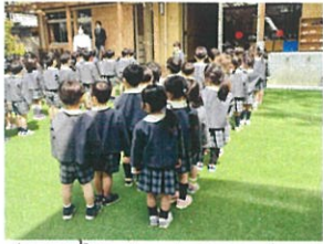
新年度スタートしました。 ホールのガラスのドアもスタート