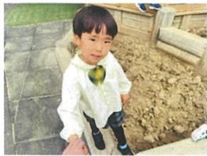
「連れて行ってあげたい」と 牛乳引いてくれたよ!