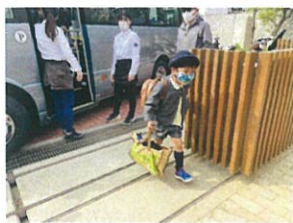
今日から新学期☆ ちょっぴりドキドキで登園です◎自分のどこにあるかな?!