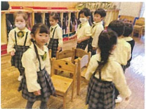
おんせいの おんせいの