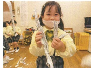
3つ作ったよーグッ 見せに来てくれました◎