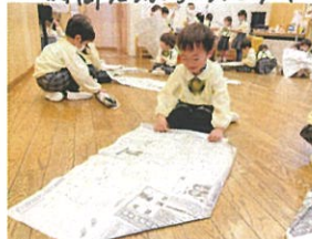
新聞紙を広げて何を 作るのかなー?!