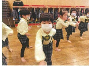
「位置についてよい!」 右足の時は左足を出すOK!