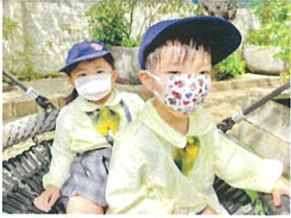
お気に入りの ゆいお宝。宇宙宝贝と 楽しもう