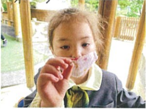
「おんせいの おんせいの」 「どうせんせい」はわかんない