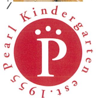
Pearl Kindergarten est. 1955