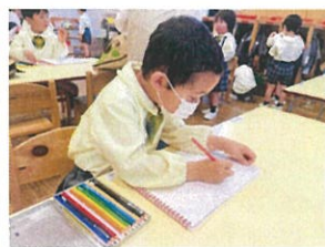
自分の色えんぴつ☆ 早速絵を描いています♪