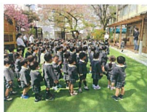
進級式☆新年長と 新年中と気持ち新たに参 りました!!