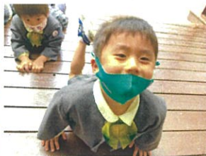
「どうせんせい はやくあそびたいよ」 ガラスの上までお迎え!