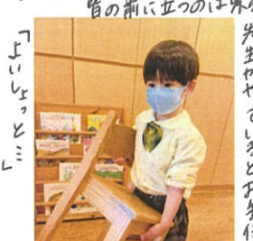
「よいしょっとミ」 先生がやっているとお手伝いしてくれませう