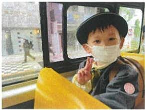
カメラを向けるとピース