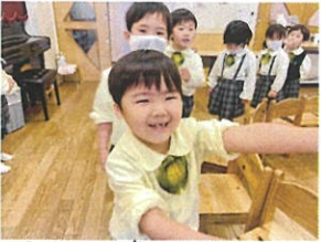
おんせいの おんせいの