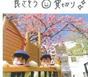
ハ重橋、キレイに 咲いてるねーハ重橋の下で いい笑顔◎