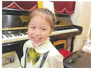
おんせいの笑顔と歌 おんせいの笑顔