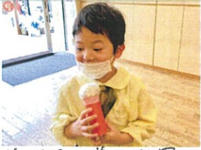
前のクラス、名前、幼稚園の 好きなことを発表しました!