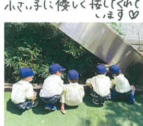
そろそろ出かけるかな... あの子探しています◎