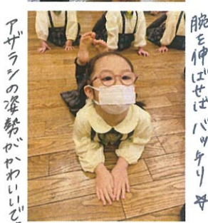
アザラシの姿勢がかわいらしいですね 腕を伸ばせばバックリ