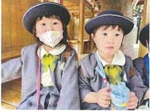
バタバタ... 今日も楽しもうね!