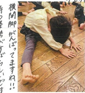
待って姿勢がすばらしいです 横開脚がんばってますね!! 足先は上に! バックリ