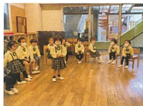
「なんでもバスケット」 // さくらんぼが好きなひー!!