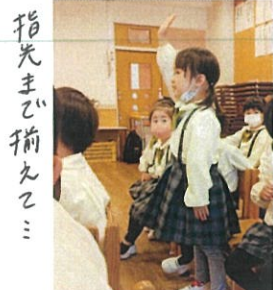
指先まで揃えてミ ① 元氣よく「ハイ!!!」