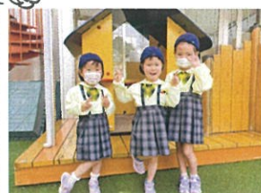
BPNからのお友達♡ 園庭で会えたから一緒に お楽しみ☆