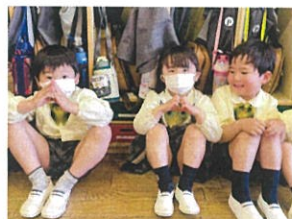
ドキドキしている友達へ 頑張るのハハハハハハ!