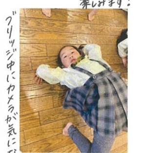
「フリッジ中にカメラが気にならな いからいい」