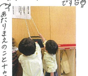
「あたりまえのこと十カ条!!」 指し橋にして先生のマナー