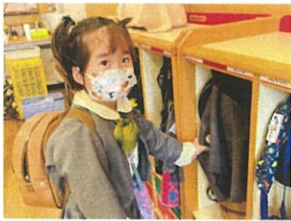
私のロッカーも開け!! 早く見たいわね!!