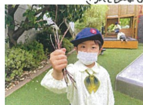
何をひらいていたのかと 思ったら...木の枝◎ たくさん集めたね!