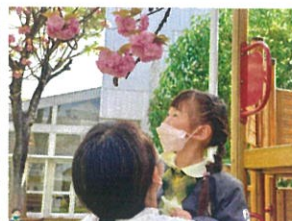
綺麗なハチ重卒業 春ですわ!!