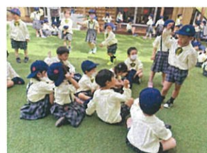
年長クラスのお兄さんとジャンケン! 勝つにばかりクラスへ戻ります♪