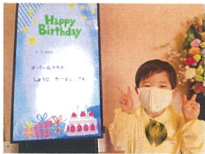
Happy Birthday 5 5歳になりました!