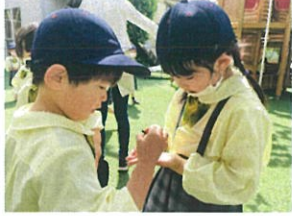
これ何かは?? フルーツに似た実だね