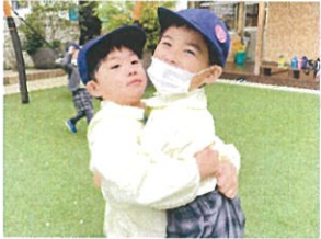
「おんせいの」 おんせいの