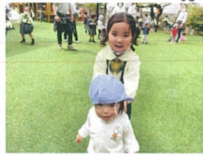
PNSの1才児のお友達から 小さい子に優しく接してくれ ています◎