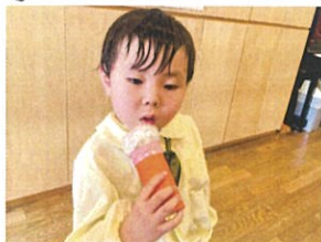
ホールのガラス 全員 「自己紹介」を行いました