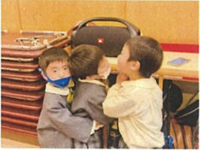
スピーカーから出る 音楽に興味津々!