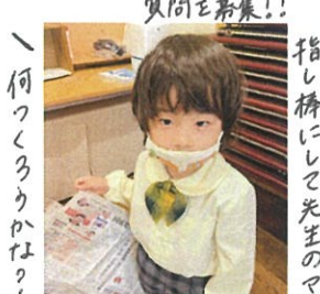
「この新聞にしようぞ」 何つくろうかな?