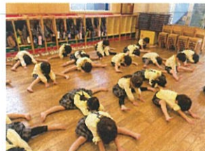
久しぶりにみんなと 柔軟体操!! しゃり伸ばす!!