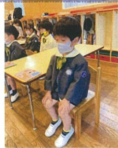
イスを高くしました!! 腰骨を立てて座ります☆