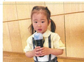
新しいクラスになったので 自己紹介◎緊張気味とす きんとさよなら!