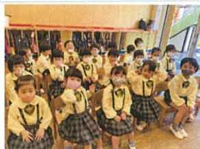
自己紹介の時間 皆の前に立つのは緊張