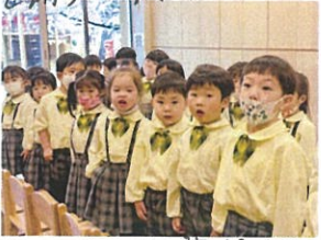
年中クラスでの音読 頑張ろうね!