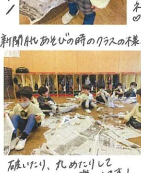
「破いたり、丸めたりして 楽しませます」