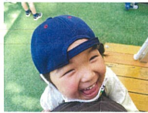
せんせいつかまえたーグッ 探していたのはダンゴムシです