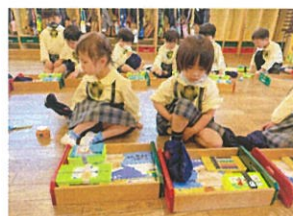
色えんぴつが仲間入りしたの 引き出しの中きれいに整えよう!!