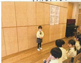
お名前もしっかり言えます