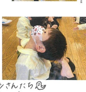
とってもキレイなアザラシさんたち 足先までピンと伸びています。