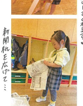
新聞紙をなげこミ