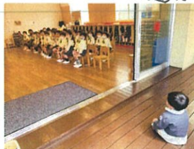
年少のお見学に! みんな元気な声(笑)