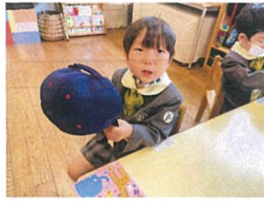
アシストのクラスキップ☆ 画記年中