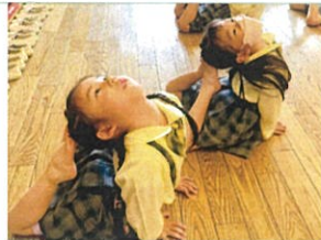
柔軟体操もスタート! アサヒ、とちも上手100!