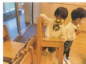
イスが大きいよーグッ 重なるのもちょっぴり大変