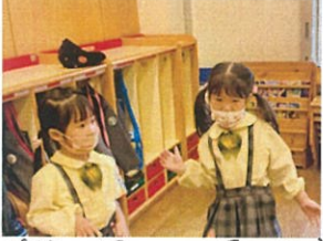
昨年を懐かし... 慣れた保育 活動に「おんせいの」 と楽しもうね!