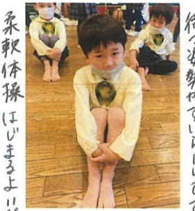
柔軟体操はじまるよ!!