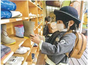
履きものを脱ぎ おんせいの