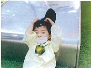
気温が高く、涼しい 日陰でムヒイロカサ