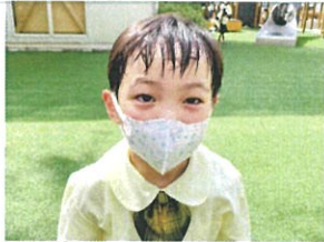
夏日的な水遊びも 水遊びをしました