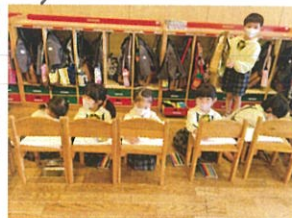
イスの上でお絵描き 色鉛筆デビューだね!