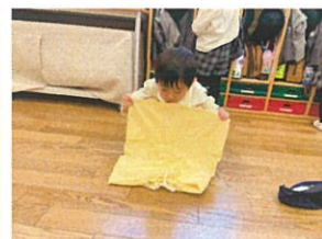
お荷物づくり中 スモック丁寧にたたみます◎