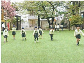
「おんせいの」 おんせいの