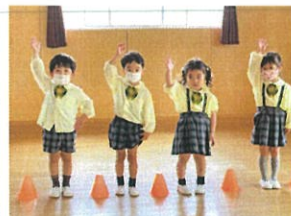
時間があつたので、3Fへ行き、クラスのみんな ダンスを行いました!! 真ん中を走るようにしたため