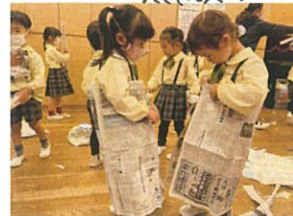
スクートの作り方を友達に 教えてもらって自分で作ります!