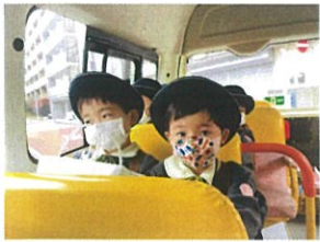
少し緊張...?! 静かにバスに乗っています