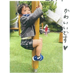
みてー!! おでこさん