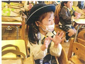
隣園前に手遊び中... 「おおきいおのりおのりおのり」