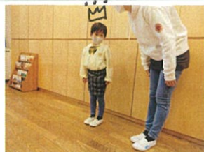
お誕生日だったのび、皆 質問を募集!