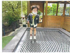
トランポリン気持ち 良さそう◎貸切り☆