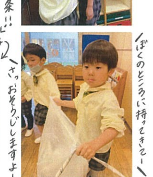
「さ、おどろびますよー」 「ぶくのどろろに持ってこー」