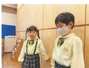
好きな遊具は何ですか?!