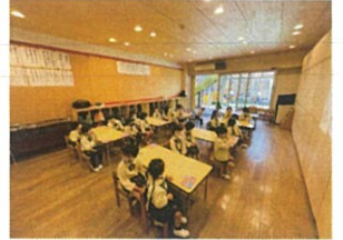
カーネットクラス、 最初の席が決まりました