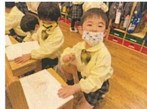
茶色の色えんぴつで「土」を 描いてます◎