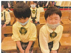
待って姿勢がすばらしいみんな