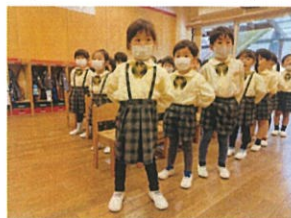
こちらは歌の姿勢がすばらしいみんな 姿勢が良いと、良い声も出ますね。