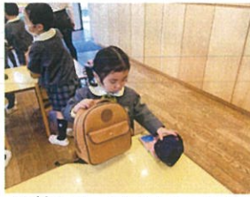
名前を書いてもらうようお願い していただきましたが... みんなお名前を書いてくれたよ!!