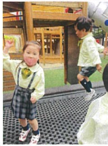
トランポリン楽しい!