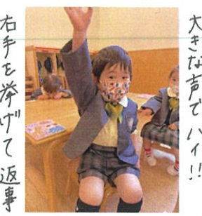
右手を挙げて返事 とっても上手です!!