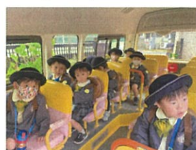
また明日も幼稚園 で待ってるよ♡♡