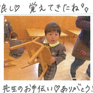
先生のお手伝い♡ありがとう!!