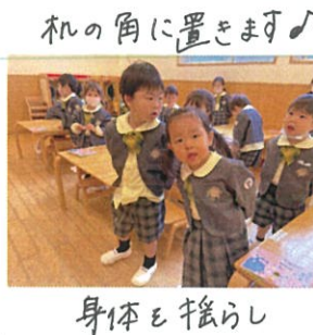
身体を揺らし はがらお歌♡