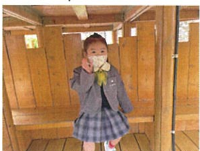
いっ(おい)走ったから ちよっ(と)休憩～