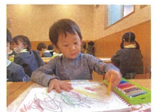
ダイナミックに ワルワル～◎