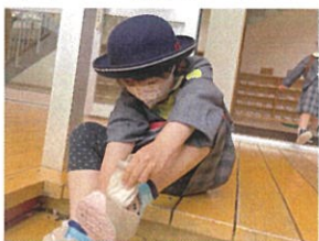
あっというまにお帰りの 時間になりました♡