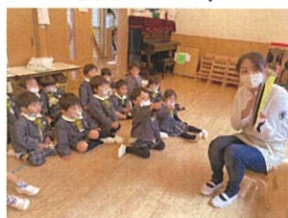
絵本を見ている 時の姿です♡ワクワク!!