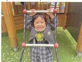
あらっこんなところから 可愛いお顔が♡