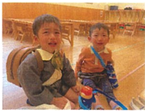
おはようございます!! 慣らし教育活動2日目