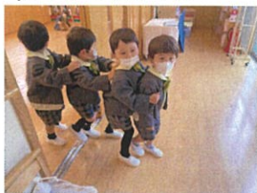
前のお友だちの肩を 持て～出発!!