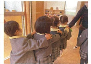
トパーズ列車で トイレにGO!!