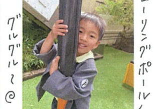
ワルワル♡ ローリングボール