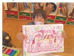
ジャン!! 大好きな ピョンだよ～♡