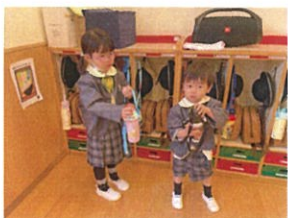
水分補給を忘れずに* あ～美味し!!