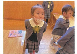
“こぼりのうた” 覚えてきたね♡