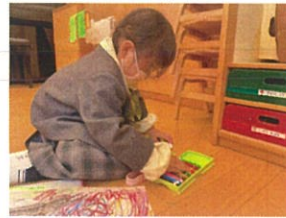
落としちゃったクレヨン を集めて...♡