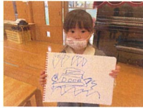
大好きな舟を 描きました!! 上手♡