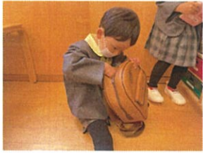
おたよりはさみ探し中.◎