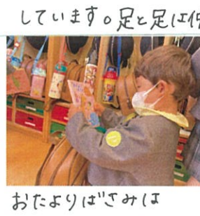
おたよりはさみは 真ん中に入れようね♡