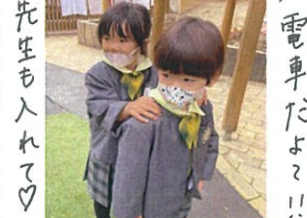
先生も入れて♡ 電車だよ!!