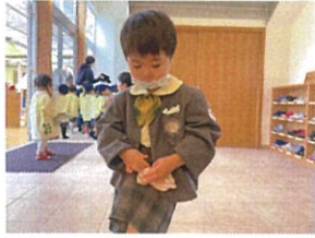
ポケットはどこにだろ?