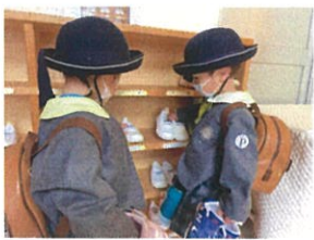
靴の向き、場所 バッチリです♡