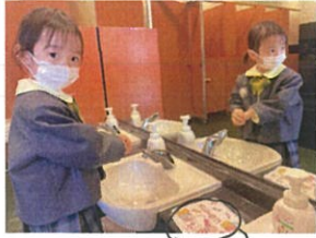
ハンカチの準備も バッチリだね♪