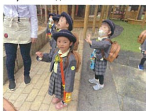
糸糸コースのお友だち にバイバイ♡