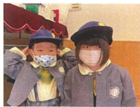
／見て見て～♡ トパーズクラスのクラスキャップ!!