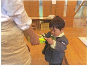
ゴムが固いから 先生-糸者にやう～