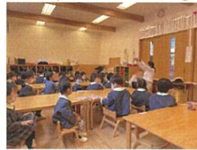
イスの座り方をお伝え しています。足と足は仲良し♡