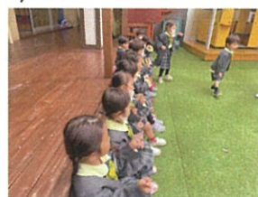
園庭へ行きました!! 先生のお話をよく聞いて♡