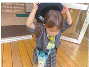
帽子を忘れそくに!! 気付いてよかった♡