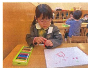
／私のお顔と ママのお顔を描くよ