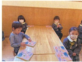
おたよりはさみは 机の角に置きます♡