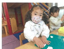
リクエストで 粘土遊び中心