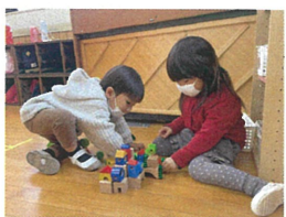
お友だちと一緒に みんな遊びで"もどんどん楽しくおいていきます