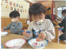
おとっと おちやいそう