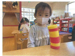
難しかったけど 7番に出来ました☆