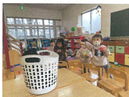
玉入れ競争 よ～いヒーッ!!