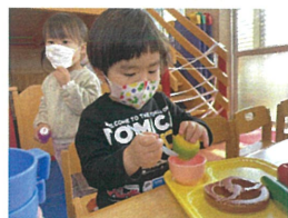
大きなリンゴ、 スプーンに乗るかな?