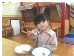
バーンの指で 上手でしよ