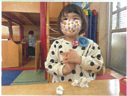
今日はカエルを 作ってるそうです