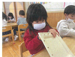
<最後の製作.ひも通し> しかり穴を見て、上手!!