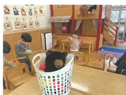
遠くからもホーイ!