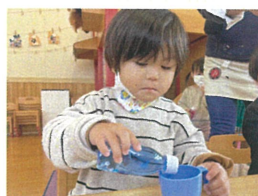
ジュースを注いで この後、クイズと