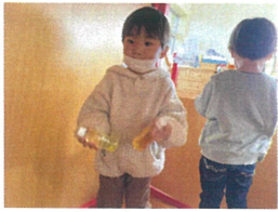
お友だちが、大好きな 黄色とオレンジのジュースの味に△△つかな?