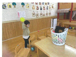
よく狙って この後しかり入りました