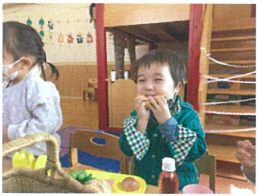
おいしそうに剥き削いで 食べているのは"かぼ"ちゃん