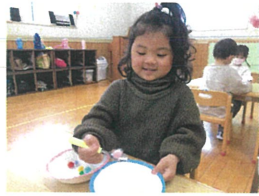
丁寧にゆっくり 一つ一つ