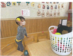
ちよと近くに寄って エイ!!