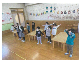
2021年度 最後のお帰りの会でした