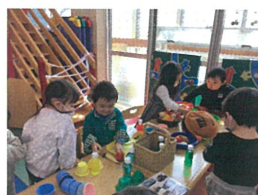
何やらお店屋さんか 始まりました