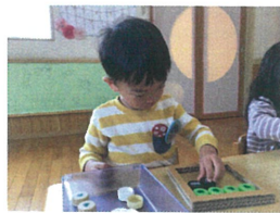
<ペットボトルのキャップの知育> お同じ色やマークを並べていきます