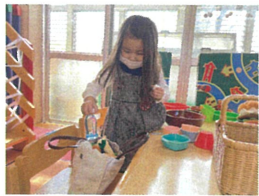
もうカバンには 入らなそう...