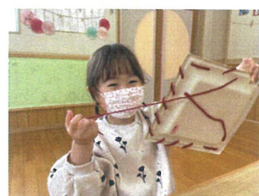
シャーンとあはれ いい表情しています