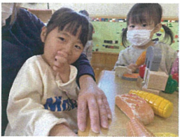
先生のお膝で今日は おおひり甘えモード♡