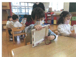
上から下から とへても上手です☆