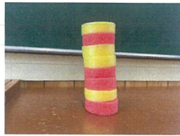
<知育あそび> 先生と同じに出来るかな?