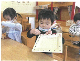
お隣りの穴を擦り、とへても真鍮りに ひもを通していきます。集中してます