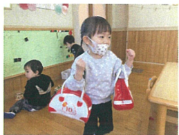
カ持ち～ お買い物帰りかな?