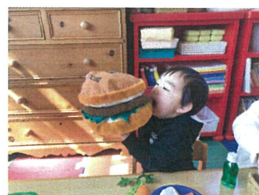
大きなお口で かぶり