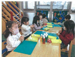
1人始めたらどんどん 増えて...いつの間にか(笑)