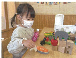
動物達にごはんを 食べさせてあげています