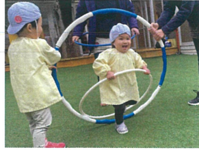
フラフープを持っていても フラフープトネル通れました。