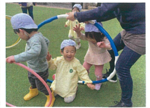
自由あそび中に フラフープトネル発見