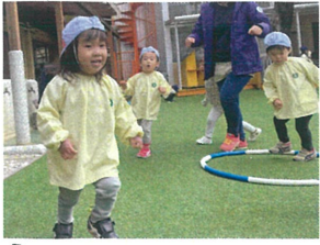
「おうま」の歌をうたって フラフープのまわりを歩きまわす。