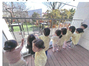
園庭にパールクラスの お友だちを発見