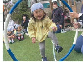
「ぞうさんめ」と言い ながら、なりきれました