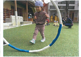
ポンポンポン たぬきに変身