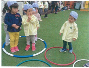
フラフープの中では… 忍者に変身☆