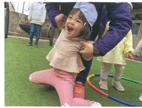
こちょこちょして欲しい お友だちも居ました