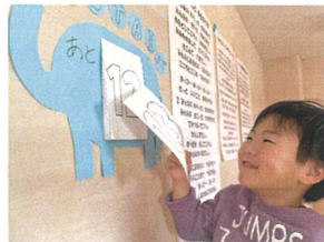
本日のかわいいお友だち めくってもらいました