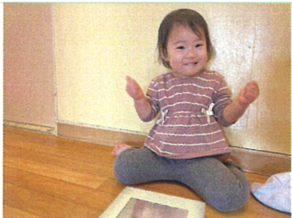
幼稚園に置いてある 仕掛け絵本に大興奮