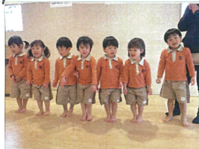
なんと、2歳児クラス 全員が、選ばれました!