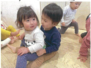
「ブンバ・ポーン」の曲に 合わせて「ガタゴトガタゴト」