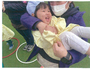
先生につかまると こちょこちょが(笑)