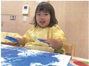
絵の具の感触が 楽しく感じたようです。