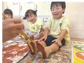
先生の話をよく聞いて 最後まで楽しめました。