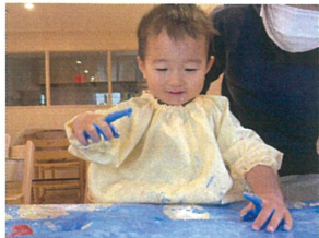
ポタポタと絵の具を 落として楽しんでいました