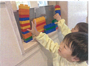
嬉しそうに街を作 り立てていました