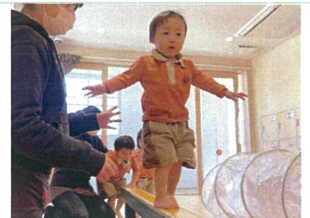
一人で平均台を渡れて 歌や姿勢を頑張っていました。本人もびっくり!(笑)