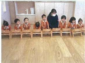
椅子を並べて、ピアノの ように演奏中