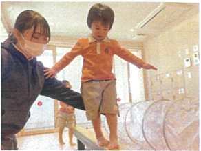
まだ、不安な気持ち 終わってからは、ニコニコ!