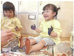
くすぐたいのかな? 楽しくニコニコが止まらない!