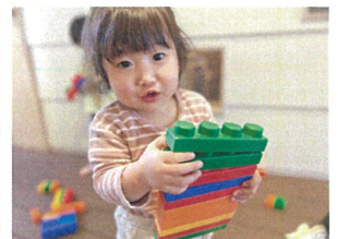
作ったものを見せてくれました