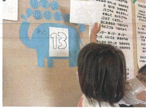
UTABUTAI に向けて 日めくりカレンダーが