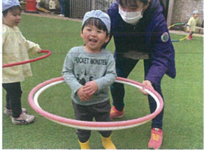
先生につかまっても ニコニコの笑顔が