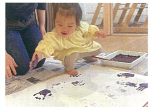
楽しく、へたへたの 手形がたくさん