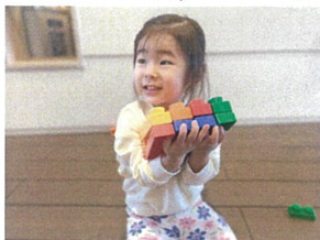
サンドイッチの出来あがり とっても大きいお