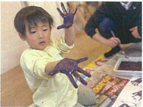
ジャンジャンと手のひらを 見せてくれました