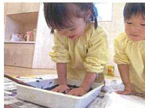
えのぐをつける時から 嬉しそうなお友だち