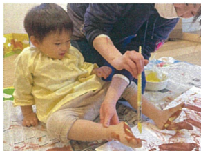
先生と一緒に えのぐを楽しみました。