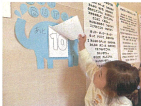
ちょっぴり緊張しながら ペラッめくりました!