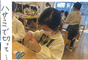
お花を作りました