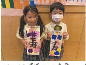
みんな素敵に出来たよ