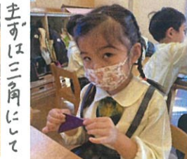
ハサミで切って 真剣に丁寧にお