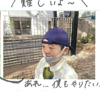
あれ... 僕もやりたい でも、出来なかった(笑)