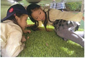
こんなところに ネコさん発見