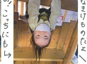
あ、こっちにも なまけものだよ