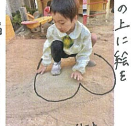
自分の周りに♡にね♡