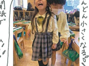
みんな小さくなってる