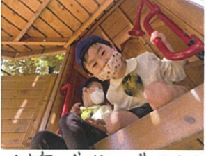
お家で遊んでいるよ! ここにいますよ