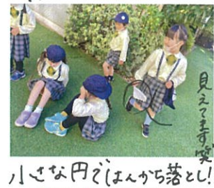
小さな円ぞいんから落とし!!