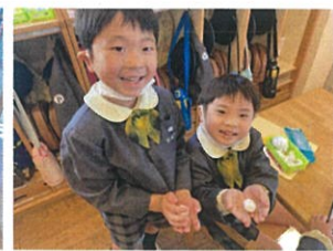
粘土を使って作りました 一緒に作りましたよ