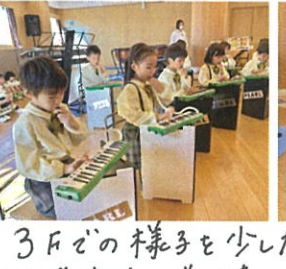
3斤どの様子を少しだけご紹介!!