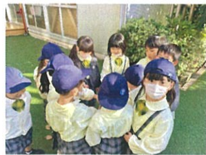
みんなでお決めの中よ!!