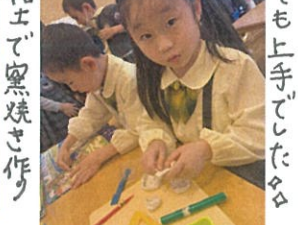
粘土で窯焼き作り 沢山作ったよ!