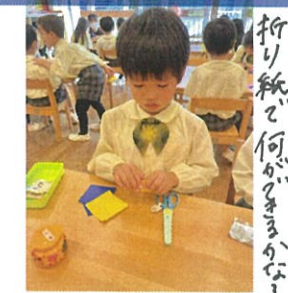
折り紙で何が出来るかな?