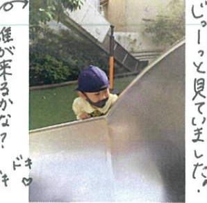
誰が来るかな? もういいよ