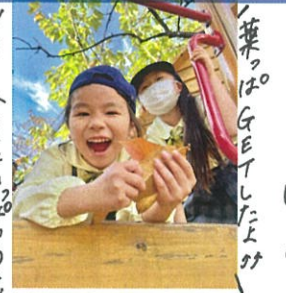
ツリハウスにいろいろある!!