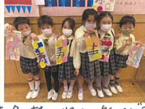
持ってきたの楽しみですね!