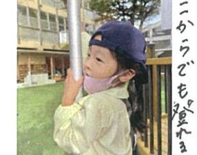
先生を2で見せてね♡