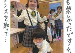
バランスを取って