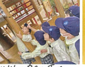
ツリハウスの下にくもがいるよ!!