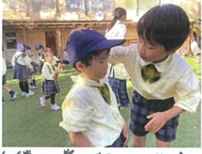
僕の弟だよ〜 頭をよよし... 優しいですね