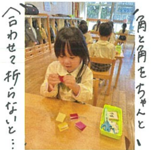
白わせて折らないと...よし!!