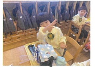
おにぎりマツ おにぎりマツ