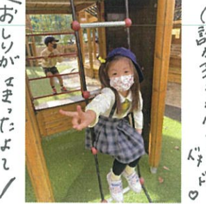
おしりがはまったよ