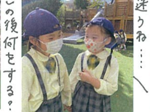
この後何をやるかな?