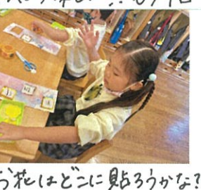
お花はどこに見ようかな??