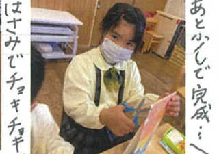
はすみでチョコキキ あ〜と喜んで完成!