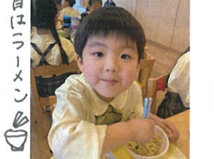
今日はお楽しみ /いっしょに食べるよ