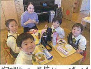
実習生の先生と一緒に! みんなで食べる楽しいね