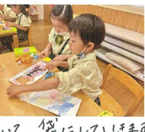
それぞいの味のある