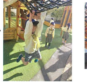
何秒ぶら下がれるかな?