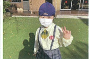
6歳になりました おめでと〜ごさいます