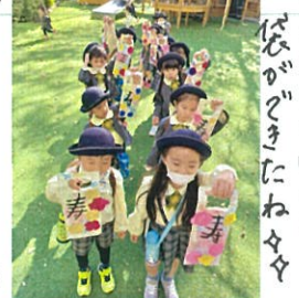
色とりどりの千歳飴袋完成!!