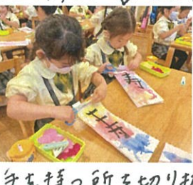
それぞれがの味のある