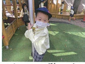
ファイヤボール おど〜!!