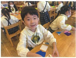
千歳台袋に使う パーツを作りました