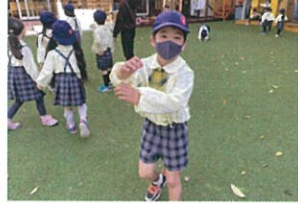
今日も鬼ごっこ おど〜!!