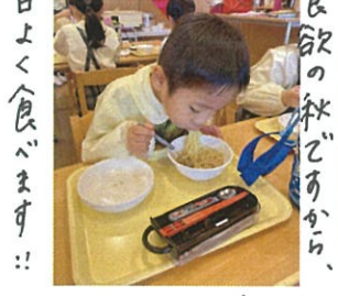
おかわりもいんできます!!