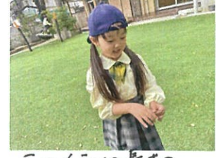
このくらい長さの枝が欲しかったマジック