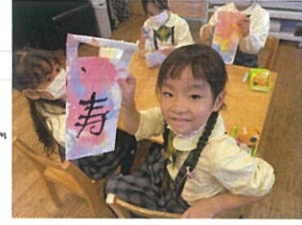
あじく素敵ですね