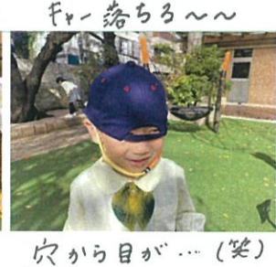
穴から目が... (笑) "外が見えるよ!"