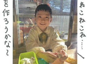
何を作ろうかな? お友だちと考えて作りました!