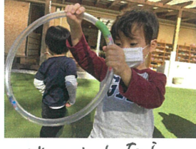
ギュッとしたら 中のキラキラ止まるかな?