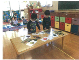
これにきめたぞ おとどけにいこう!