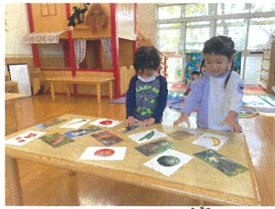
たくさんあって迷っちゃうの 僕はこれにしよう!!