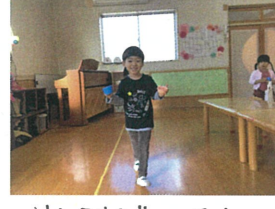
りんごジュースと たまごジュースで～す!!