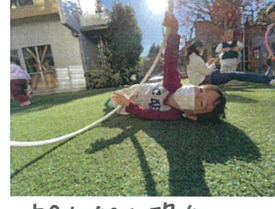
ホカホカ陽気 芝生にゴロゴロ気持ちいい