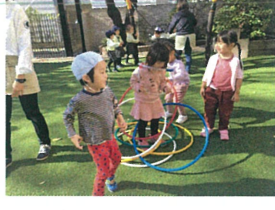
あれあれ フラーフがほしい!!