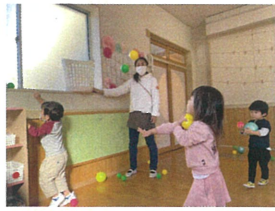
遠くからでもえい! 入れー!!