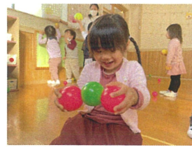
3つ並んでギュッと おたんごめたい♡