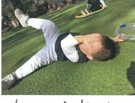
わあ～お空は 眩しいよ～