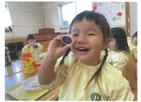
今日のデザートはゼリー ぶどうあげ♡