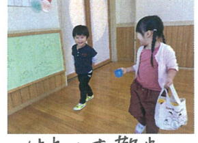
仲良とお散歩 どこに行くのかな?!