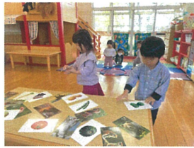
どっちもやりたいな～