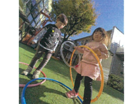
「はんだか立ち歩か」 カッコイイ