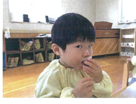
パクリッ おいしいよ～