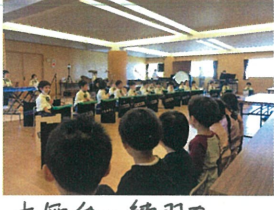
音舞台の練習を 見に行ってきました♪