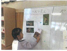
ぞうさん まいごさんのおとどけへんぞ!