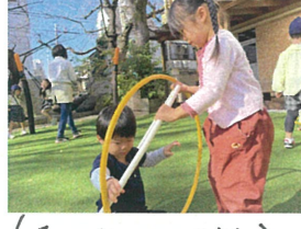
1つか～してぞ! これ、どうぞ!!