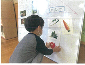
ドキドキ“♡” こちらであってるかな?