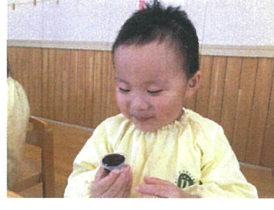
たのしみ～♪ はやくたべたいな♡