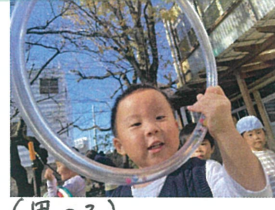
(男の子) あ～おもちゃが入ってる～ぞ