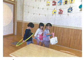
まって～ 連結しようよ～♪