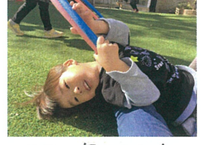
先生の足の上にも ゴロゴロ～♪