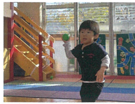
振りかぶって～ 野球の選手みたい!!