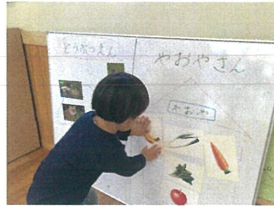
へたぞ バナナは やおやさんです♪