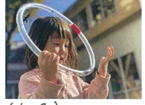
(女の子) あ～宝石が入ってる～ぞ