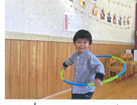
電車が走りま～す ガタン・ゴトーン