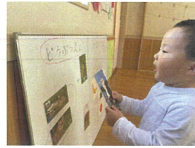
どこにほうかな～ しはどろぼうつえんぞ!