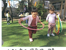
ピンクのフラーフが GET!!