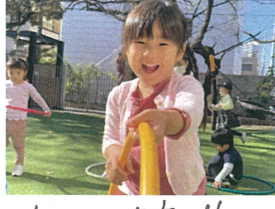
わあ～大変!! 先生にぶつかると!!