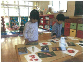
《迷子さんをお届け：野菜はやおやさんへ・動物はどろぼうつえんへ》 どれにしようかな～