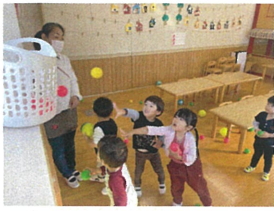
《玉入れ》 みんな頑張っ～