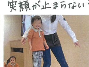
みんなで進めました!