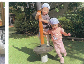
お友だちと一緒に グルグル♡