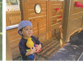
見つけた宝物を大切に 持ってくれました!