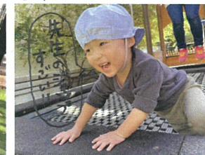
揺れを楽しみ姿も★