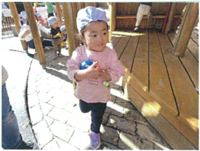
「宝物どこかな」ときょろきょろ