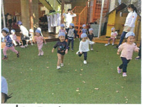
<宝探し> みんな とても良い表情!