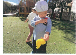
見つけた金魚をポケットへ 1つしかない星の宝物を