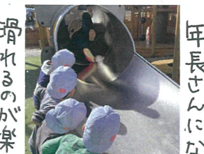
滑れるのが楽しみな 1もういはい〜!