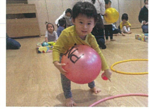
「უნდებ合ってる?」と 確認する姿も...