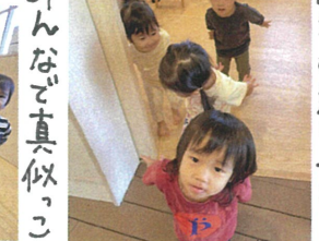
歌の姿勢がどれも 素敵な2歳さん☆