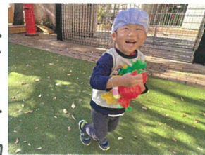
たくさんの宝物に 笑顔が止まらない!