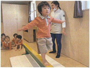
手をあげ、直ぐ前を 向いて渡りきってくれました!