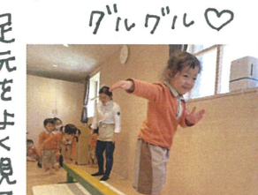
おとと。ギリギリセーフ