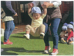
先生にお手伝いして もらいながら、ジャンプ!!