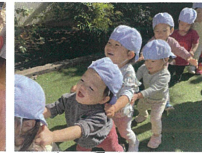
なが〜い電車! 次は Pearl Nursery school 駅です!