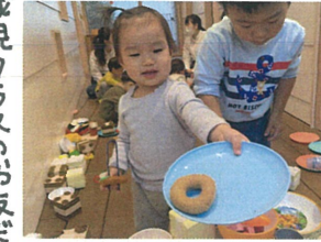
おすすめのドーナツを 選んでくれました!