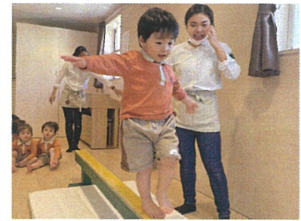
回数を重ねるごとに 一歩が大きくな