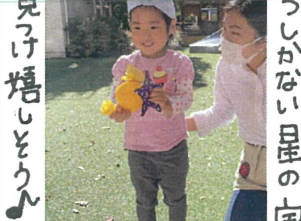
見つけ嬉しもうん