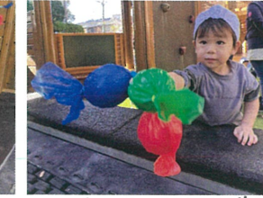
3種類のキャンディー 何味が好きかな?