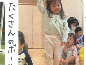
目線の先には たくさんのボールが 〇 / はやくせりにいたよ