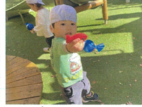
「じゅ〜ん!!」 金魚も見つてよ