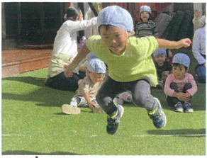
<ゴム跳び> 膝を曲げて飛び越えるぞ!!