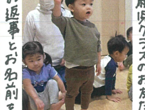
お返事とお名前を元 気お言ってくれます