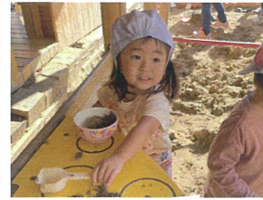
「貸して?」 みんなでお料理中