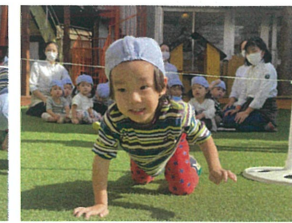
1歳児クラスのお友だちも