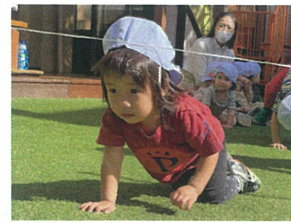
帽子が引っかけちゃった(笑)ハイハイのスピード が速くなってきました