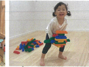
3バーンの飛行機ぞ いてきま〜す =3