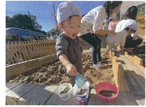
3つも完成 お弁当かな? セリーかな?