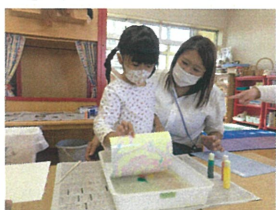
こちらもドキドキしながら 画用紙をパラッ!