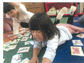
遠のカードにも 飛び込みます!!