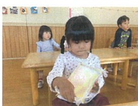
出来栄え チェックかな?!