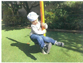
大好きなローリングボール 1日7回は必ず乗ります♡