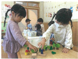
街づくり台 たんだん みんなで遊ぶことが楽しくなってきました♪