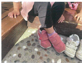
あれ? 靴が反対? これで大丈夫?! (笑)