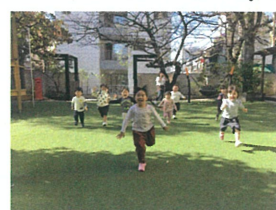
みんな"タッチ" よーいどん!!