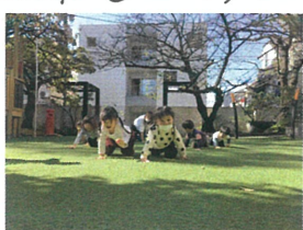
お次はハイハイ競争 誰が1番かな?!