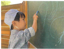
大きな きゅうりを 描いています♡