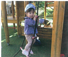
揺れるハシゴは ちびり、布い っ