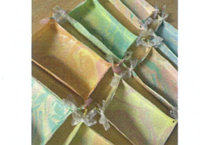
かわいいのが出来ました♡