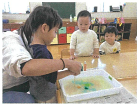
／わあ～ まざっていくねえ～