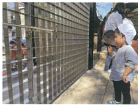
Pearl Nursery schoolの お友だちにハイハイ階段