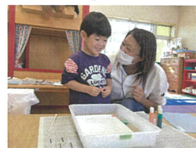
紙を入れたらドキドキ しまがら5点を数えます♡