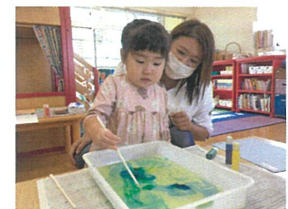
／もうちょっと やりた～い♡