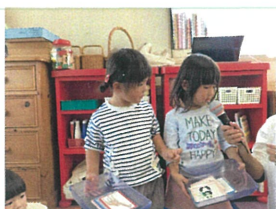
《今日の優勝者インタビュー》 2名のお友だちが11枚で同率優勝!!