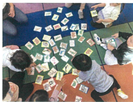
今日のカルタ大会は "動物のカード"