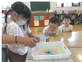
ドキドキ 真剣です!!