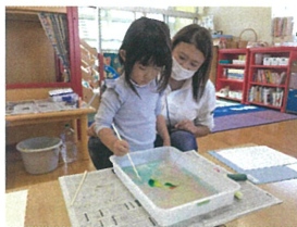
やさしく・やさしく まざれー!!