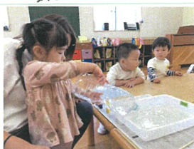
《マーブリングで小物入れ作り》