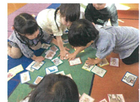
おお? どっちが早かったかな?!