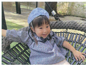
いっぱい遊んだら ちびり休憩♡