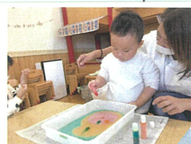
こぼさないようにお水おそめて、5色の中から好きな色も選びました♪