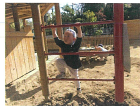
よいしょ!! 今日はおんなの所に登りたい♡