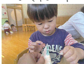
マーブリングが乾いたら リボンのひも通し!!