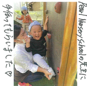
手伝ってもらいました♡