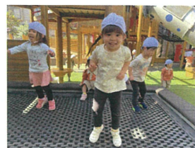
Pearl Nursery Schoolの先生に ヒョン・ヒョン みんな笑顔が止まらない!!