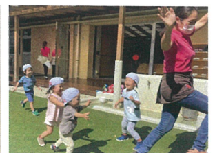
先生やお友だちを みんなで追いかけてます♡