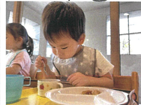
FESTAに向けて♡ よく噛んで食べています。