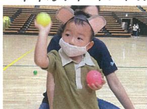
おにぎりの箱を よく見て...えいっ!