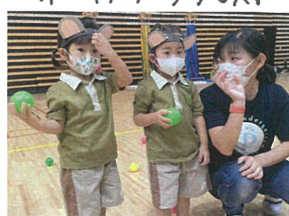
先生と♡お友だちと♡ 「せーのっ！」と一緒に投げました。