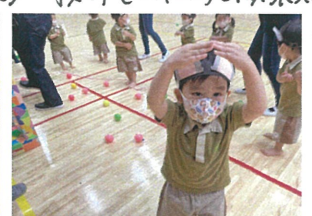
「おにぎり、おにぎり」ポーズも バッチリ♡