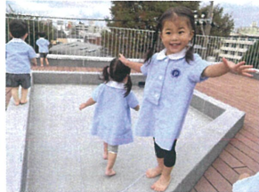
「私、ひとりできるよ」と 先生に見せてくれました。