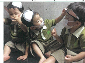
ねずみのカチューシャ 直してあげる！とお友だちに♡