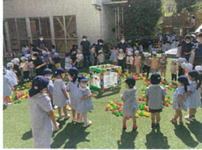
メノウクラスとBaby Pearl Nurseryと一緒に♡