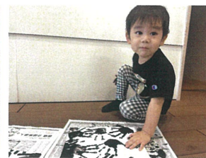
ペタッと押しつけてから 3秒待って、手形完成♡