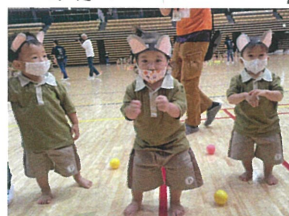
1歳児クラスのお友だちも 楽しみながりダンス♡