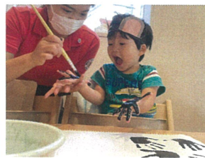
「ペア☆」と手も目も口も！ 全部右手のためは♡