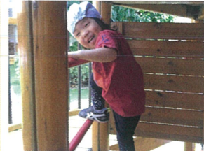
先生を見つけて... この笑顔♡