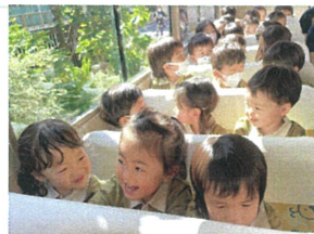
メノウクラスのお友だちと 一緒にバスで更にウキウキ♡