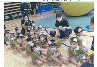
会席に着いてから、 お話をし、さあ入場です♡