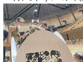
大きなおにぎりの 「のり」は皆の手形です♡