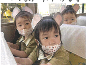
帰りのバスも、ウキウキが止まらないうち、Pearl Nursery Schoolのお友だちでした♡ 大興奮しながらも、前に付いている、手前には、しっかりつかまて乗りました。