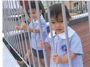
久しぶりに屋上へ みんなで行きました。