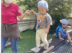
ゆくり、トコトコ♡ 楽しい遊びを見ん♡