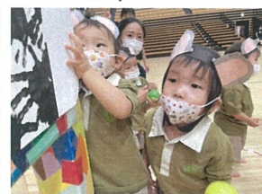
ころり箱に近づいて 入れてお友だちとしました(笑)