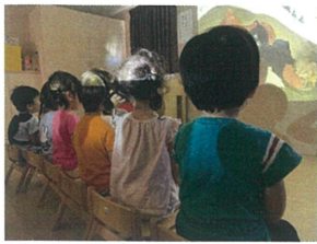
ステキな姿勢を保てる よりになりました♡