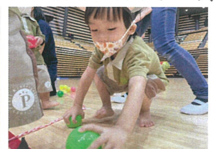
このロープの外から 投げて入れようと頑張ってます♡