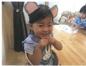
「チュウ♡チュウ♡」 ねずみさん完成です。