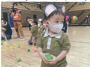
「おむすびころりん」の音楽 に合わせて五入れです。