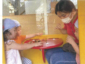
木のお家で、みんなが パーティー中です。