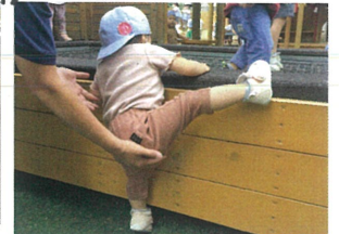
自分のチカウで 登ろうと頑張ってます♡