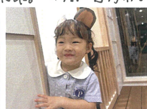
帰りは、ママとパパとあんなに サッパリ♡ねずみに変身♡