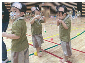
「くるるとまわって、ねずみ♡ ダンスもノリノリでした♡