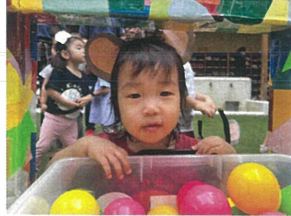
たくさん入ったボールに 近づいて、嬉しそう♡