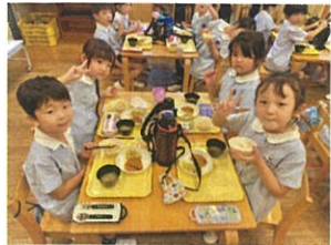
自由席で給食を 食べました88