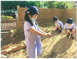
砂をにぎにぎ お団子できるかな??