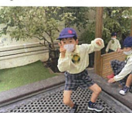
カッコイポーズが おかわりですわ