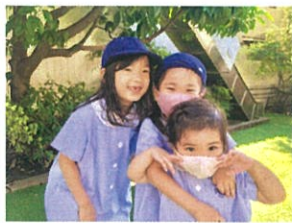
3人で「はい、ホース」♡ スイスイ登ります。