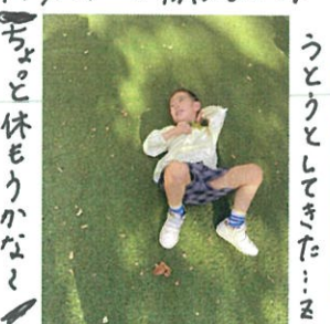
ちょっと休もうかなと