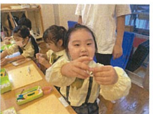
どんぶりの指輪だよ!