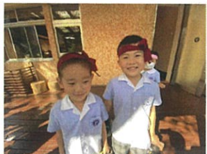
あめのはちまきが...