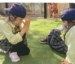
なにを鼻先に貼て いこうでしょうか...?