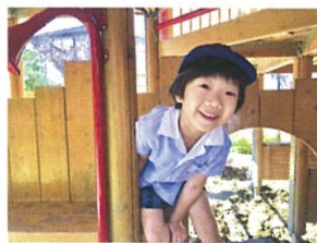
鬼が来ないか休憩しながら 様子を伺っています。