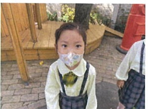
きせあを撮られにあ