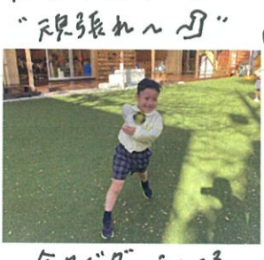
全力でダンス = 3