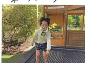
ジャンプジャンプ = 3