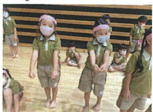
パラバルーン小葉かいゆ