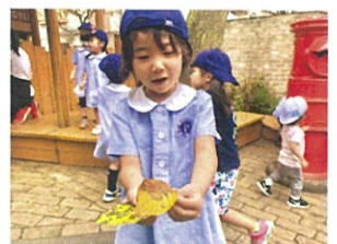
こんなに大きくて 綺麗な葉っぱがあったよ!