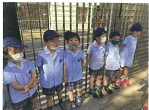
サ〜んな稱まつし... 言いか〜ハレ〜