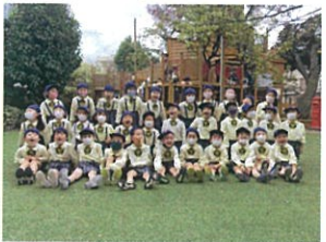
久しぶりに33人が 揃いました!! パンチ