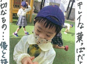
大切なもの... 傷と持て