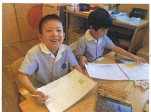
何を描いているのかな?