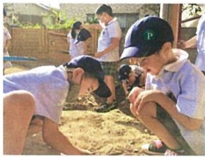
砂遊びに夢中な2人 楽しそうですね。